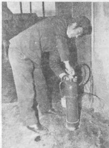
Redni pregled gasilnih naprav

Vsi delavci v proizvodnji morajo biti »izprašani« gasilci, vsaj enkrat letno pa vsem članom kolektiva prikažejo možne načine gašenja. Prostovoljno gasilsko društvo šteje 60 članov, posebej pa imajo organizirano tudi poklicno enoto, ki šteje 12 članov. Za 600-članski kolektiv predstav-