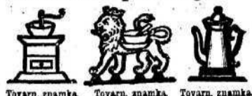
Tovarn. znamka. Tovarn. znamka. Tovarn. znamka. d. X 1447, 1878 II. V.

da imate jamstvo za vedno jednako in naj- boljšo kakovost. — Pazite pri tem na varstvene znamke in podpis, kajti naše zamotanje se v jednakih barvah, papirju in z podobnim natisom ponareja. —