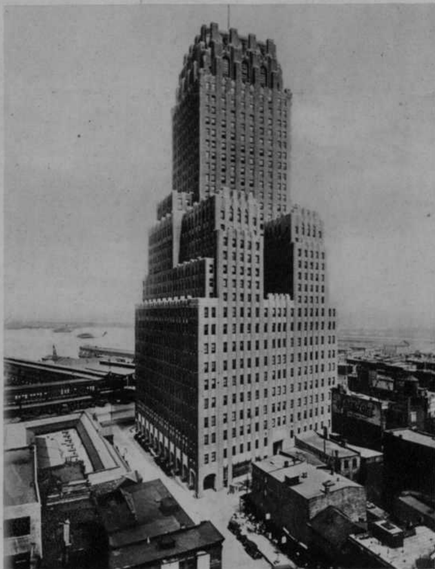
Najnovjša nebotačna palača v New-Yorku.

Kaj hoče orlovstvo? Gojiti v fantih: 1. telesno krepkost (zakaj narod telesnih slabičev je obsojen na smrt), 2. izobrazbo duha (zakaj narod, ki nič ne zna, postane in ostane suženj drugih), 3. čut skupnosti (zakaj ljudstvo, ki se ne nauči skup držati, nič ne doseže), 4. pošteno fantovsko družino (zakaj mladina, ki ima smisel za alkohol in kvanto, pomenja žalosten pogin ljudstva).