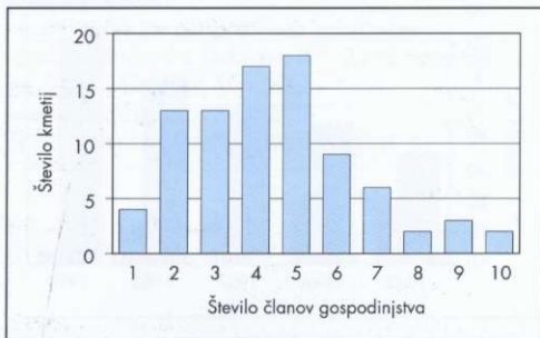
Slika 3: Število aktivnih hribovskih kmetij glede na število članov gospodinjstva.

Analiza gospodinjestev obravnavanega območja je pokazala, da je število prebivalcev na kmetijah bolj povezano s težavostjo obdelovanja kot z velikostjo zemljišča. Izračun korelacije med številom ljudi na kmetiji in njeno