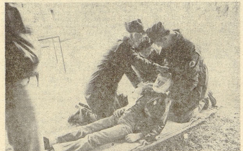
S tekmovanja enot prve medicinske pomoči CZ občine Celje. Na slikah, akcija naše ekipe