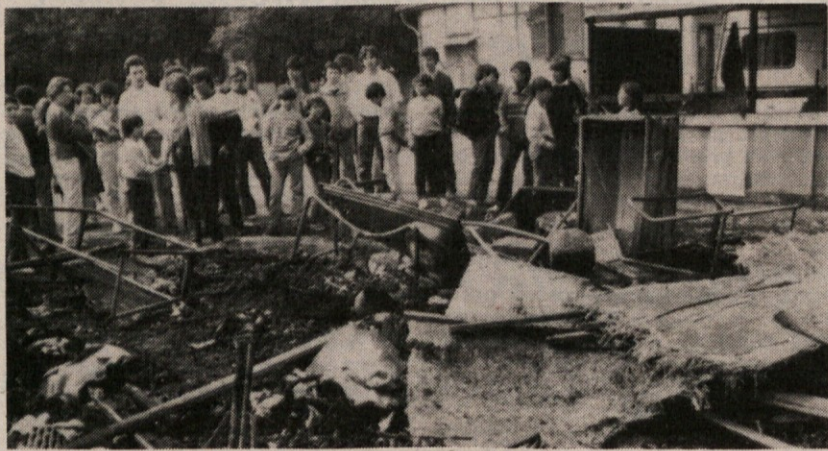
Tako je bila videti stanovanjska prikolicca po požaru, ki jo je popolnoma uničil in povzročil smrt bratcev, ki sta imela dve leti starejši in komaj mesec dni mlajši. Zgodilo se je v Aversu, kjer marsikatera družina po potresu še živi v prikolicah