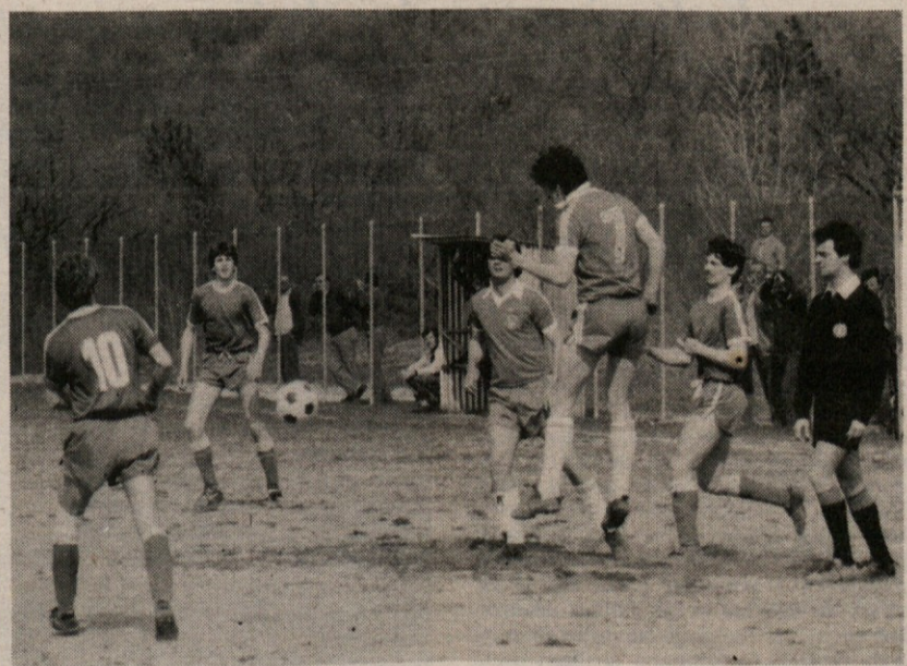
Po velikonočnih praznikih se bodo v nedeljo spet nadaljevala nogometna amaterska prvenstva. Na sliki posnetek z derbija med Gajo in Primorcem