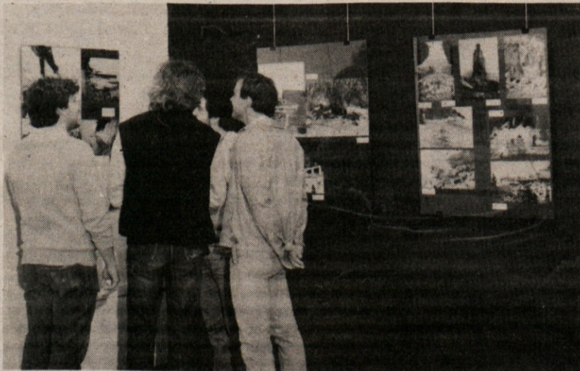
Občinstvo si ogleduje razstavo o tržaški obali

Razstava, ki jo priporočamo vsem, sestoji iz več vsebinskih odsekov, ki se nato zlivajo v eno samo homogeno celoto. Problematika obale postane tako zorni kot za zgodovinarja, biologa, arhitekta in nazadnje tudi za upravitelja oziroma za politika, kateremu prepogostokrat pripada zadnja beseda, tudi takrat, ko bi se lahko ukrepalo drugače. Pri vsem tem izstopajo posledice dolgoletnih gradbenih spekulacij, ki imajo svoje korenine v letu 1913, ko je bila ustanovljena (tudi z jasnimi raznarodovalnimi nameni) družba »Riviera Triestina«, ki je takoj