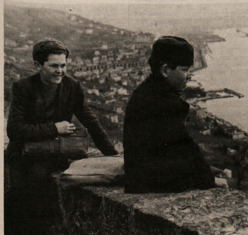
Slika, ki jo objavljamo, je vsekakor lepa in na svoj način nenavadna. Posneta je bila po drugi svetovni vojni in po osvoboditvi Trsta. Mlada šolarčka gledata morje, eden nosi še titovko. Zdi se, da je po krutih letih in zatiranju nov, mlad duh ogrel Trst in Kras. Šolarčka sta vsekakor simbol novih dni, pa čeprav sta oblečena v starih suknjah in imata oguljeni šolski torbi...