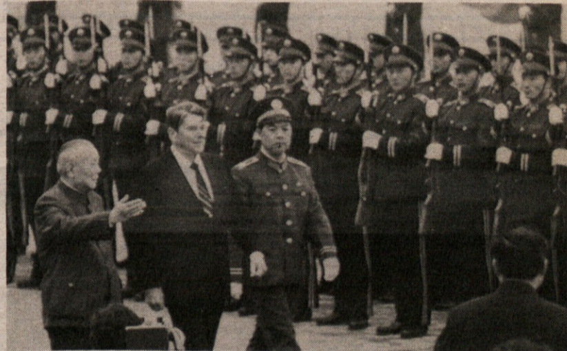
Ronald Reagan v spremstvu kitajskega predsednika Li Xianniana pri pregledovanju častne čete

Prav tega sodelovanja pa si želijo ameriški gospodarstveniki. Med sporazumi, ki jih bodo podpisali med Reaganovim obiskom bo po vsej verjetnosti tudi sporazum o jedrskem sodelovanju v mirovne namene. V bistvu bodo Američani nudili Kitajcem vsa potrebna tehnologija za gradnjo jedrskih elektrarn. Kot kaže so že premostili oviro kitajskih jamstev, da ne bodo te tehnologije posredovali tretjim državam.