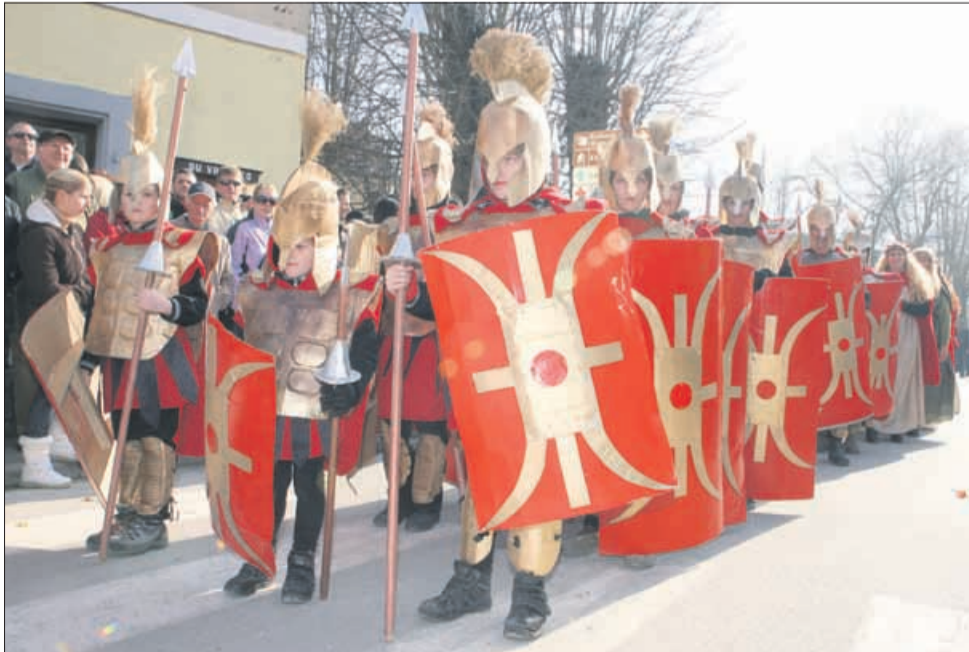
Rimski vojaki so zavzeli Vransko in če so se zelo potrudili, so tudi zelo grdo gledali.