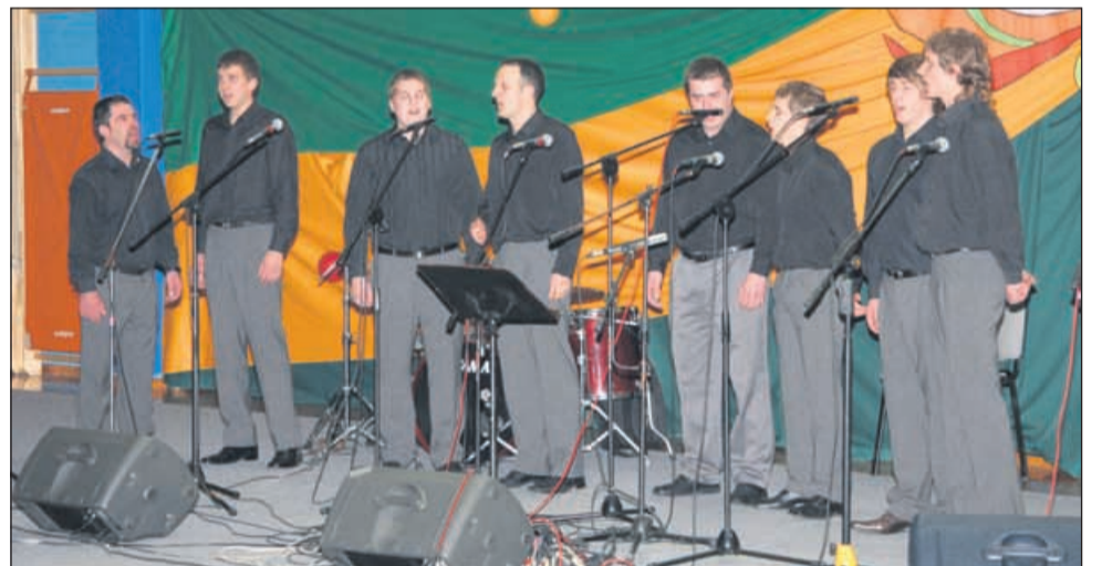
Prvič se je predstavil Braslovški oktet.