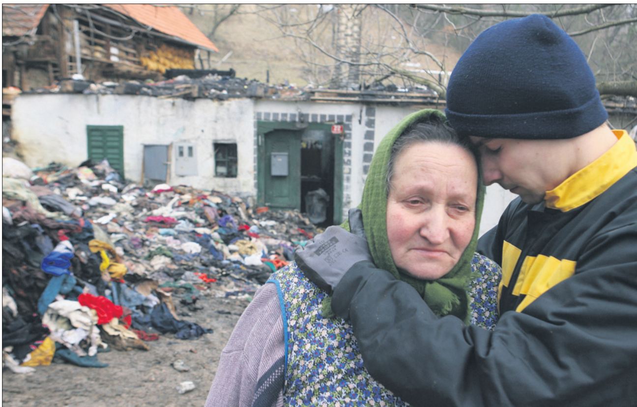
Osetičevi v teh dneh čistijo, kar se očistiti da. Denarja za nov dom nimajo, zato prosijo za pomoč vse, ki bi jim lahko pomagali.