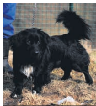
Pino: »Ne boš mi repa majal, ker ga bom sam pokonci držal!«

razliko od mačk, ki so po velikosti in teži precej podobne, se pri psih pojavljajo velike razlike v velikosti, tako da je treba tudi glede na velikost in pasmo prilagoditi prehrano naših ljubljencev. Hrano za pse ali mačke lahko pripravljamo sami, lahko pa jih hranimo z že pripravljeno hrano. Slaba lastnost doma pripravljene hrane je, da je razmeroma težko pripraviti popoln in uravnotežen obrok. Dobra lastnost te hrane pa je, da jo imajo nekateri psi raje kot tovarniško pripravljeno hrano. Vse več skrbnikov svoje hišne ljubljence hrani s tovarniško pripravljeno hrano, ki je na voljo v obliki briketov in hrane v konzervah. Pri takšni hrani ponavadi že proizvajalec poskrbi,