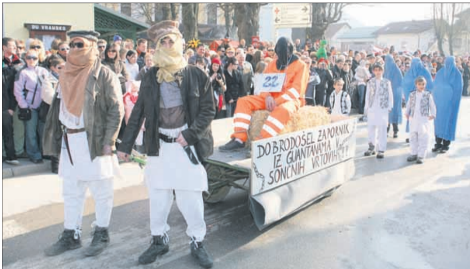
Se jim je na televiziji čisto narobe zareklo. Zapornik iz Guantanamo pač ne bo na Jesenicah, ker se je po čudnem naključju znašel na Vranskem. Kako je s počutjem, raje nismo spraševali, nad sprejemom pa ne bi smel imeti pripomb.