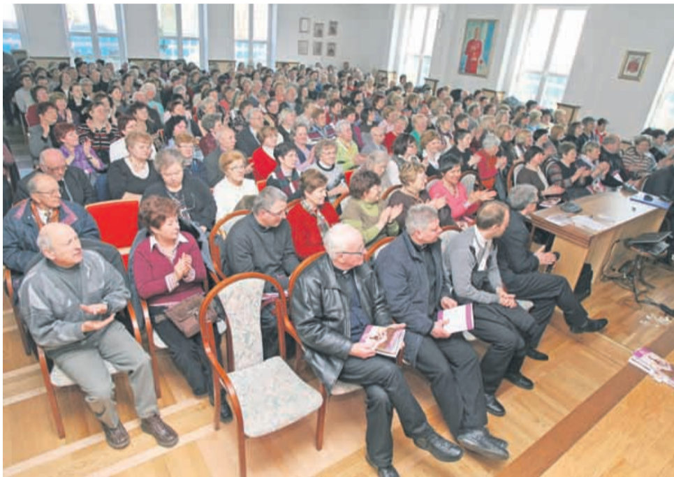
Na letnih plenemih Škofijske Karitas Celje se zbira vse več prostovoljk in prostovoljcev. Letos jih je bilo v Domu sv. Jožefa kar okrog 240 iz 67 župnijskih Karitas.