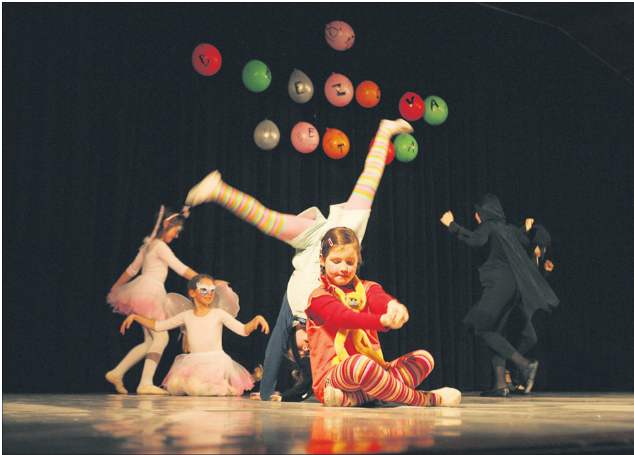
Brezova metla je znova dokazala izvirnost.