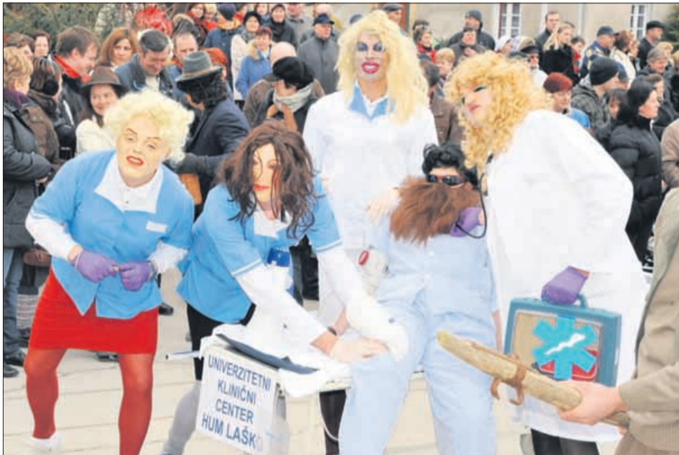
Pustni nedelji pa se niso izneverili v Laškem. Bilo je rekordno tako obiskovalcev kot maškar. Kakšnih 400 šem so menda naštel. Piko na i norčavi nedelji pa je v zvočnem smislu dodala glasba kar treh lokalnih godb na pihala.