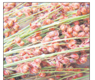
Proso je eno najkvalitetnejših žit.

Njegov alkalični učinek blokira razmnoževanje gnilobnih bakterij in razstruplja telo. Ker vsebuje kar osem esencialnih aminokislin, je dobro dopolnilo za vegetarijance. Zaradi vitamina B in holina zavira kopičenje holesterola in bolezni ožilja nasploh. Proseno kašo skuhamo v mleku ali vodi kot samostojno jed ali kot prilogo raznim jedem. Proseno kalčke dodajamo solatam, obnesejo pa se tudi kot dietna prehrana pri številnih boleznih.