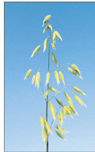
Oves očisti telo.

Postno obdobje je namenjeno utrjevanju vere in pobožnosti, obenem pa tudi razstrupljanju in čiščenju telesa. Ker se pozimi v njem nabere veliko nesnage, je čas pred veliko nočjo nad vse prikladen za generalno čiščenje. V tem obdobju pijmo čim več vode in čaja, na jedilniku pa naj se poleg sadja in zelenjave pojavijo tudi jedi iz žit.