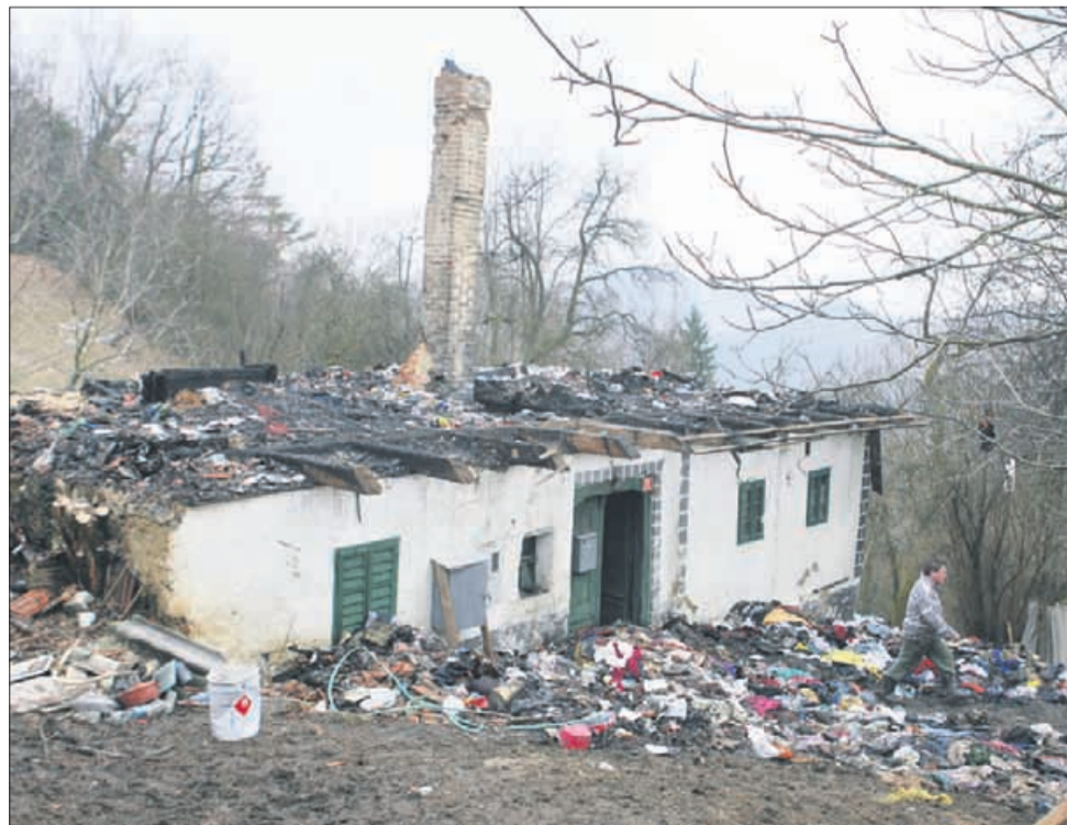
V požaru je nastalo za približno 60 tisoč evrov škode. Hiša in gospodarsko poslopje nista zavarovana, zato so se Osetičevi znašli v težkem položaju.