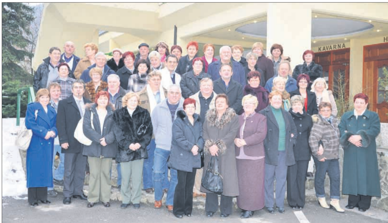
Skupinska slika za spomin na prvo tovrstno srečanje