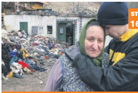
Na pogorišču doma