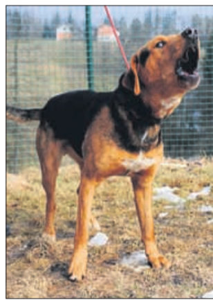
Tedy: »Hov, hov, jutri upam, da grem domov!«

Uradne ure zavetišča Zonzani: od ponedeljka do petka od 8. do 16. ure; ogledi psov: od ponedeljka do petka od 12. do 16. ure. Telefon: 03/749-06-00; internetni naslov www.zonzani.si