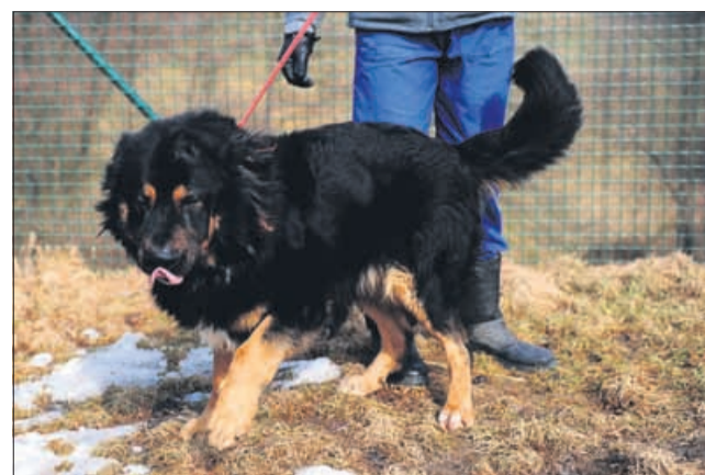
Zeus: »Njam, tole je bilo pa odlično!«

da je obrok uravnotežen in popoln. Poleg hrane mora žival imeti vedno na voljo zadostno količino vode. Zaradi menjav hrane lahko naši ljubljenci dobijo prebavne motnje ali celo alergije, povezane s hrano. Veliko lastnikov, ki za svoje ljubljence uporabljajo hrano iz pločevink, za pse dodaja makarone in podobno, ker je tovarniško pripravljena hrana videti kot da vsebuje le meso. Resnica pa je drugačna, razmerje snovi v pločevinkah je običajno enako tistim v briketih. Pa še nekaj o kosteh, za katere je precej ljudi prepričano, da so koristne za pse. To ni res. Kostni lahko povzročijo