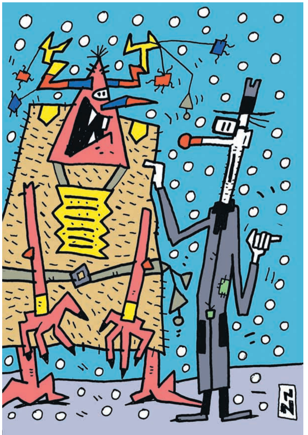
» Kaj ne bi bilo pametneje pustiti zimo pri miru in se raje lotiti preganjanja lopovov in lopovščin, ki so preplavili našo deželo...?!« Avtor: Dalibor Bori Zupančič