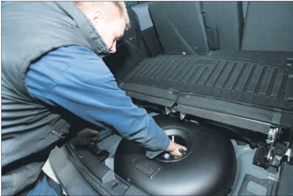
Rezervoar vgradijo običajno na mesto, kjer je rezervna guma. Če vam med vožnjo guma spusti, si lahko pomagate s posebnim setom, ki ga dobite za takšne primere pri predelovalcih avtov.