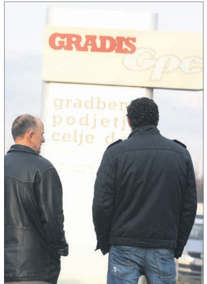
Kdaj lahko pričakujemo sojenje za škodo, ki naj bi bila povzročena v Gradisu? (slika je simbolična)

Kot je že znano, je šest zadev Gradisovih domnevnih poslovnih goljufij trenutno na celjskem okrožnem sodišču, kjer naj bi se začela sodna preiskava, ostale zadeve so še vedno v fazi kriminalistične preiskave. »Od