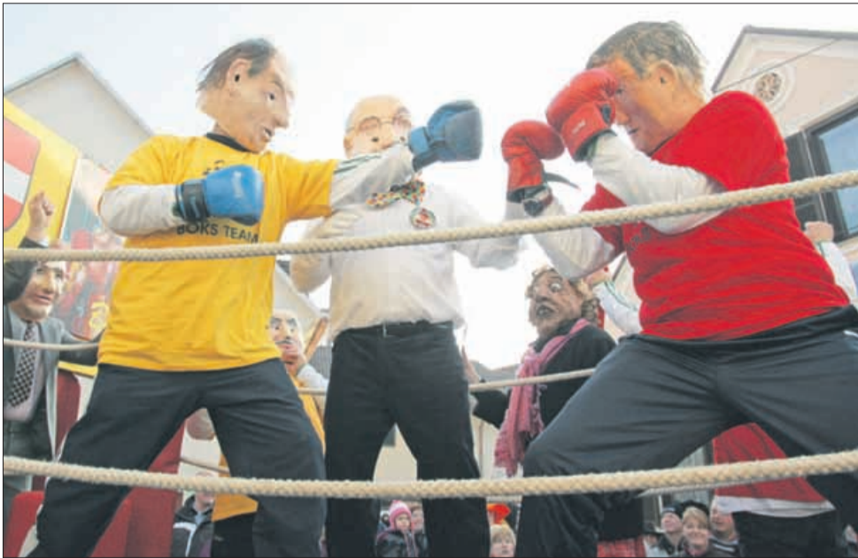
S kom se to Beno »daje«? Ah, saj ni važno. Proti večnemu županu tako ni imel nobenih »šans«.