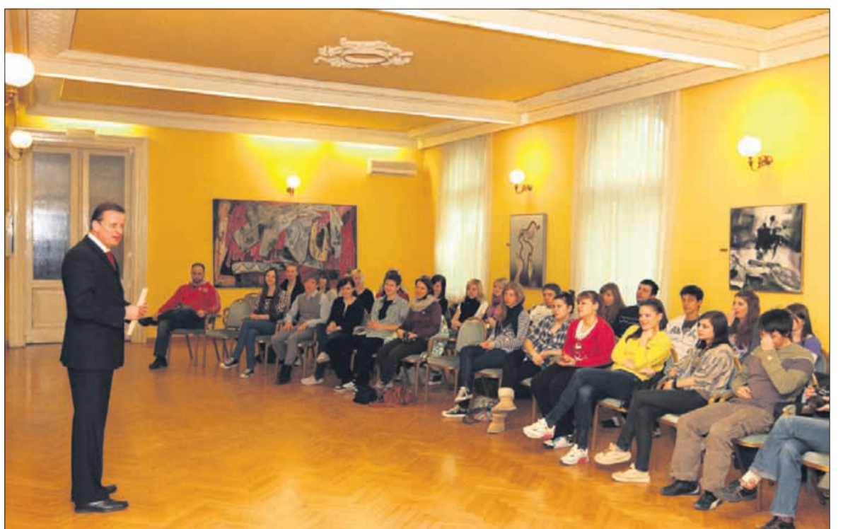
Mlade iz Zrenjanina je včeraj sprejel in pozdravil tudi celjski župan Bojan Šrot.