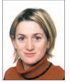
Piše: PAVLA KLÍNER

Če se oves ( Avena sativa ) le poredkoma pojavi na vaši mizi, je postni čas kar pravi za pokušino tega žita, za katerega je srednjeveški človek verjel, da mu očisti telo in zbistri duha in razum. Germanski narodi so ovseno kašo uživali za zajtrk dolga stoletja, vse dotlej, dokler je nista izpodrinila kava in kruh. V zeliščni enciklopediji iz leta 1737 beremo: »Ovsena zrna so koristna tako za človeka kot tudi za živino. Kuhan je odličan za spodbujanje vsakodnevnih prebave, prav tako napolni želodec in je vir hranil.« Zaradi velike količine esencialnih aminokislin in mineralov so ovseni kosmiči med najbolj priporočljivimi viri prehranskih vlaknin in sodijo med najboljše dietne obroke. Prehranske vlaknine, ki jih kosmiči vsebujejo, znižujejo vrednost holesterola v krvi, preprečujejo zaprtje, varovale naj bi celo pred nastankom raka na debelem črevesu.