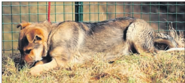
Kan: »Kar beži, a ne boš mi ušel!«

Živali imajo krajša prebavila od človekovih. Zaradi tega mora biti hrana za pse in mačke bolj prebavljiva. Splošno lahko trdimo, da so mačke bolj mesojede živali