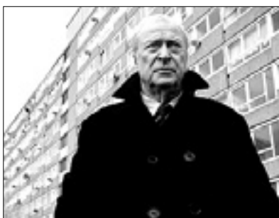
23.05 Film: Harry Brown (akc.)

12.55 19.20 Once Upon a Time 13.55 Sabrina, vita da strega 14.40 Stargate Atlantis 15.25 Andromeda 16.05 Aktualno: Anica - Appuntamento al cinema 16.10 Star Trek: Enterprise 16.55 Doctor Who 17.50 Novice 17.55 Film: In fuga a quattro zampe (pust.) 20.05 Star Trek: Next Generation 21.10 Film: Il Quarto Stato (triler)