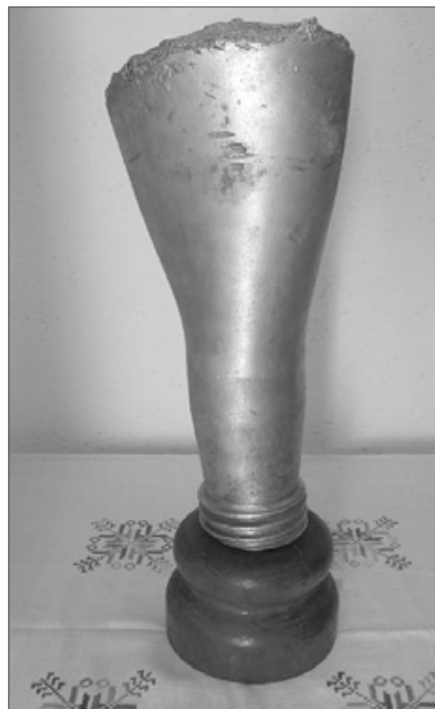
Spodnji del propelerja ameriškega letala B17g