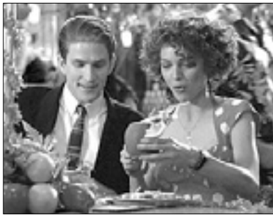
21.15 Film: Una vedova allegra... ma non troppo (kom., '88, i. M. Pfeiffer) 23.20 Film: Il silenzio degli innocenti (triler, '91, i. N. Hopkins, J. Foster)

13.40 23.05 Venezia Daily 13.55 Film: A Single Man (dram., '09, i. C. Firth) 15.35 Film: Sopravvivere coi lupi (dram.) 17.40 Novice 17.45 Film: Una sconfinata giovinezza (dram., It., '10) 19.25 Film: Miracolo italiano (kom., It., '94, i. R. Pozzetto)