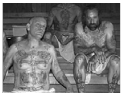
23.15 Film: Educazione siberiana (dram., '13, r. G. Salvatores)

6.00 Pregled tiska 7.55 Dnevnik, prometne informacije, vreme, borza in denar 8.45 Mattino Cinque 11.00 Aktualno: Forum 13.00 19.55 Dnevnik in vreme 13.40 Nad.: Beautiful 14.10 Nad.: Una vita 15.15 Pomeriggio Cinque 18.45 Nad.: Il segreto 20.40 Paperissima Sprint - Estate 21.10 Nad.: Squadra antimafia