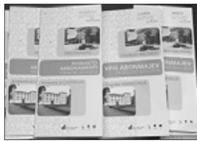
Zgibanke so pripravili v dveh jezikih KM

In v novi sezoni bodo imeli v novogoriškem kulturnem domu res kaj ponuditi: glasbeni abonma prinaša osem koncertov, usmerjenih pretežno v orkestralno glasbo, med gosti so tudi slovaška Capella Istropolitana, ki velja za enega izmed najboljših godalnih orkestrorov na svetu. Vpis za nove abonente traja do 2. oktobra. Letošnji cikel Glasbene harmonije prinaša na grad Kromberk niz treh koncertov komorne in solistične glasbe, trije koncerti se bodo zvrstili tudi v okviru letošnjega cikla Dnevi stare glasbe. Prva letošnja novost bo zazna-