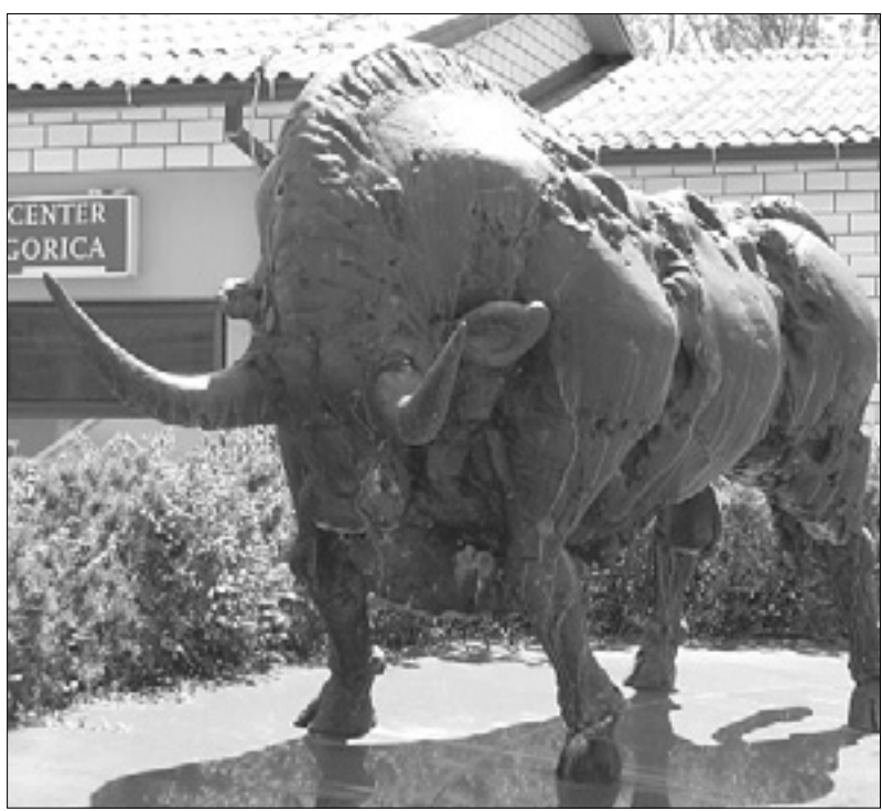
Mipov bronasti bik