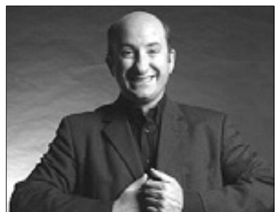
21.00 Film: La fame e la sete (kom., It., '99) 23.00 Adesso cinema 23.15 Il ruggito del leone

13.05 Film: Agente 077 dall'Oriente con fuore (akc.) 15.15 Film: Africa Express (pust.) 17.10 Note di cinema 17.15 Film: Mark il poliziotto (det., It., '75) 19.10 Venice Today 19.15 Serija: A-Team 20.05 Serija: Walker Texas Ranger