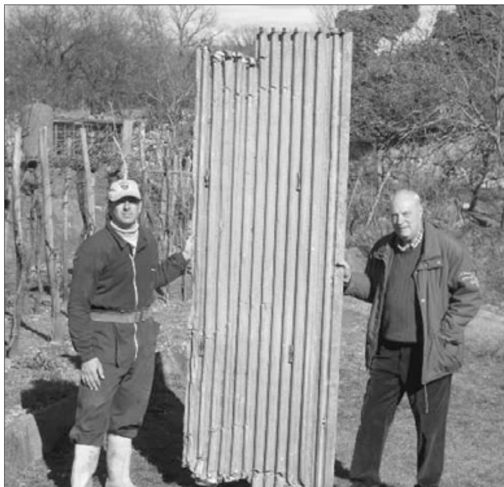
Del letalskega krila, hrani ga družina Komar s Fernetičev

Ameriški bombnik B17g naj bi zadela nemška protiletalska obramba že pri Postojni, a kljub temu je poletel do Lipice, kjer je naredil veliki krog, iz njega se je kadilo, nakar se je nad Lipico iz njega vrgel s padalom en član posadke. Tega so Nemci kasneje ujeli ter ga vozili in razkazovali po Sežani v ustrahovanje domačinov. Ko je bombnik letel nad Fernetiči, so bili v njem trije člani posadke in zdi se, da je bil eden že mrtev. Jasno je, da je pilot iskal ustrezno ravnino za prisilni pristanek, zato je letalo naredilo velik krog, nakar se je pilot odločil, da se