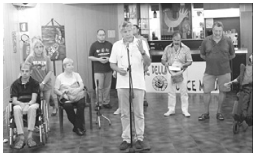
Z odprtja razstave v Kulturnem domu

V petek so v goriškem Kulturnem domu odprli likovno razstavo Diversarte. Razstavljenih je nekaj desetih slik, ki so jih izdelali varovanci CISI, konzorcija za osebe s posebnimi potrebami, ki obiskujejo dnevno središče v Ulici Palladio v Severni mestni četrti.