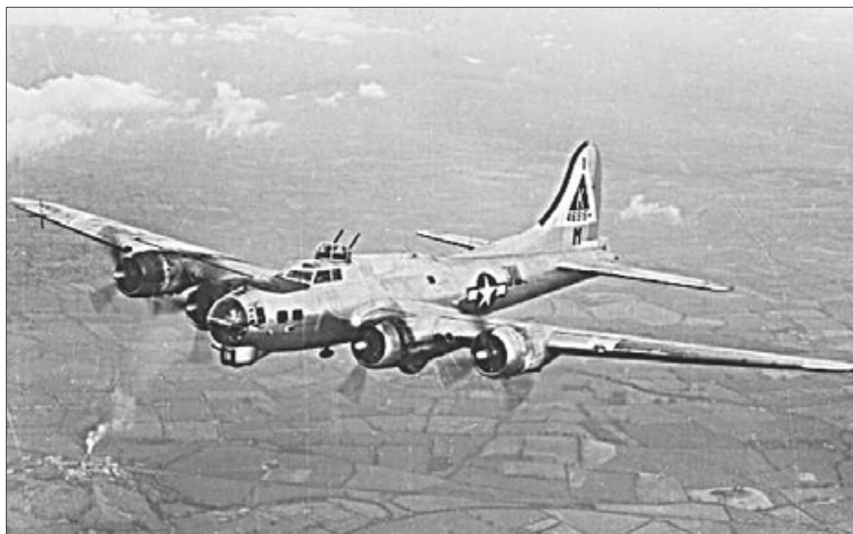
Bombnik letelca trdnjava - B 17g - (imel je 10- člansko posadko). Takšen je padel pri Fernetičih

spusti prav na gmajno pri Fernetičih. Letalo torej ni strmoglavilo, ampak je zasilno pristalo. Zahvaliti se je treba prav prisebnosti pilota, da ni prišlo do prave tragedije, če bi letalo strmoglavilo na nasele. Po teh podatkih se ujema tudi število članov posadke, sedem se jih je vrglo s padali, kar so ljudje videli in je bilo torej znano vsem, trije pa so ostali v letalu, za katere se ni vedelo, deset je bilo celotno število članov posadke v teh letalih, oziroma sedem plus tri.