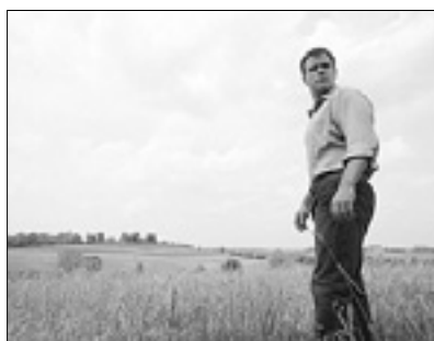
20.05 Film: Obljubljena dežela (dram., '12, r. G. Van Sant, i. M. Damon) 22.00 Odmevi 23.05 Gledališče: Malomeščani

6.05 Odmevi 6.55 Dobro jutro 11.15 18.20 Kviz: Vem! 12.00 Umetnost igre 12.30 Dok. feljton: Zadnja tramvajška postaja 13.00 15.00, 17.00, 18.55, 22.35 Poročila, športne vesti in vreme 13.30 Intervju 14.30 Glasnik 15.10 Mostovi - Hidak 15.40 Kviz: Male sive celice 16.20 Profil 17.25 Dok. film: Privlačnost (s)polo 17.55 Novice 18.00 Risanke in otroške serije 19.30 Slo- venska kronika