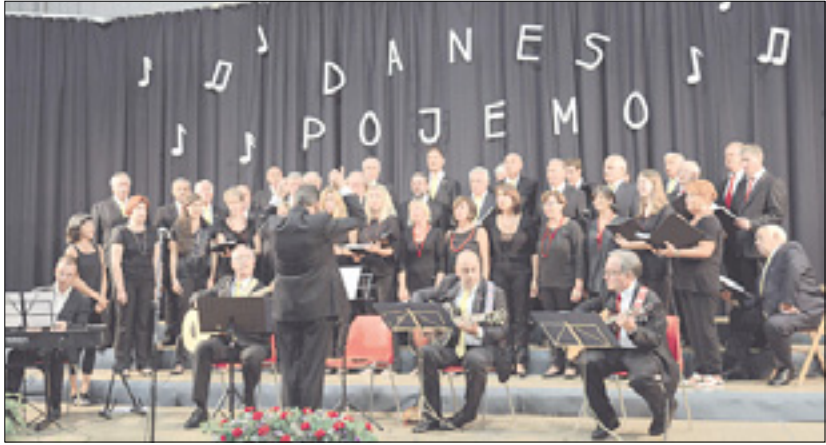
Slavljenci (zgoraj) in gostje na sobotnem koncertu v Zgoniku

Na odru se je slavlencem pridružilo še šest zborov