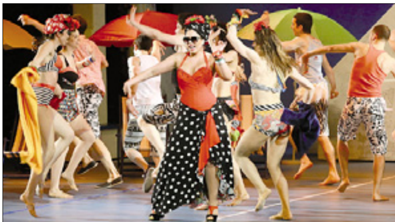
Slovenska inačica muzikala Mamma mia!, desno Eros Ramazzotti

Parni Valjak - ena najpopularnejših pop-rock skupin s prostora bivše Jugoslavije, 40 let delovanja praznuje z novo pesmijo, videospotom ter številnimi koncerti. V Sloveniji bodo nastopi v živo dosegli vrhunec v četrtek, 24. septembra, v ljubljanskih Križankah. Na glasbeni sceni je - s krajšo prekinutivjo med letoma 2005 in 2009 - za Akija Rahimovskega in ostale že 40 aktivnih in uspešnih let. V teh letih je skupina pustila neizbrisno sled