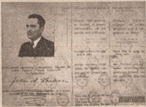
POTNI LIST, S KATERIM JE TOVARIS TITO POD IMENOM SVEDSKEGA DRZAVLJANA JOHNA ALEXANDRA KARLSSONA POTOVAL PO INOZEMSTVU