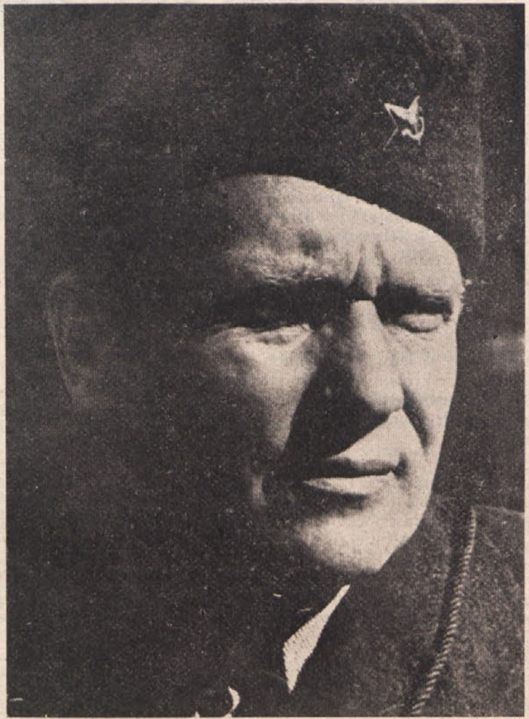
ENA IZMED PRVIH FOTOGRAFIJ TOVARISA TITA KOT VRHOVNEGA KOMANDANTA PARTIZANSKIH ENOT, SLIKA JE BILA POSNETA V ČASU TRETJE OFENZIVE SPOMLADI LETA 1942

Medtem je prispel v Zagreb Edvard Kardelj, ki je bil 6. aprila zjutraj v Beogradu in je doživel vsa bombardiranja. On je Titu in Aleksandru Rankoviću, ki je bil prav tako v Zagrebu, prinesel prve podrobne vesti o porušenju Beograda in zmešnjavi, ki je vladala v jugoslovanski vojski. Prinesel je tudi prve vesti o tovariših v Beogradu. Djilas in Svetozar Vukmanović-Tempo sta bila 6. aprila zjutraj v bližini Kalenića guvna, kjer sta pričakovala, da se bodo začele manifestacije v zvezi s podpisom jugoslovansko-sovjetske pogodbe, ki je bila tisto noč podpisana v Moskvi. Ko je priletel prvi val bombnikov, sta se skrila v neko hišo v Štiški ulici. Toda Djilas in Tempo nista hotela