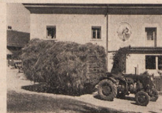
„Mojster trošenja“ kot navadni priklopni voz

vosti, ki ima sklepno vreteno (Zapfwelle). Nosilna ploskev meri 2,65 m v dolžini krat 1,60 m v širini, dolžino lahko podaljšamo (za seno in snopje) na 3,65 m. Voz lahko obremenimo s težo do 2,5 ton. Priklopni voz je opremljen z zavoro in sedežem za 2 osebi. Os je pomaknjena pod zadnji del, kar poveča vlačilno sposobnost traktorja. Ogrodje je zelo stabilno, prav tako naprava za trošenje gnoja in razsipanje gnojil. To napravo — okroglo široko cev z ogrebalnim vijakom (Förderschnecke), ki leži v dveh zaprtih krogličnih ležajih — žene traktor potom sklepnega vretena. Hlevski gnoj naprava do drobna razreže in zdrobi ter ga trosi z ekscentrično silo. Za trošenje gnoja in razsipanje gnojil sta potrebni 2 osebi, traktorist, ki vozi in druga oseba, ki sprav-