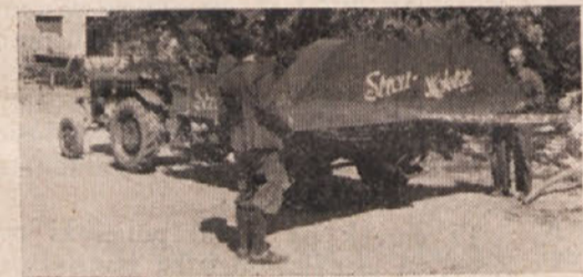
„Mojster trošenja“ pripravljen za razsipanje gnojil

»Streumeister« — mi ga bomo imenovali »mojster trošenja« — je enosni priklopni voz, ki ga lahko priklopimo k vsakemu traktorju z vsaj 12 PS zmogiji-