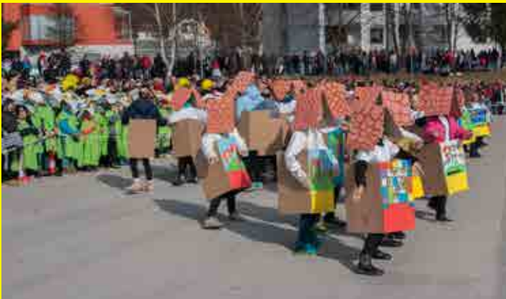
Potujoči panji (4., 5. razred)