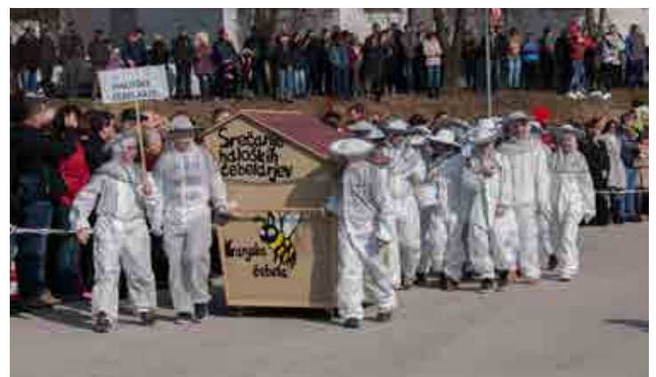
Haloški čebelarji (7. b razred)