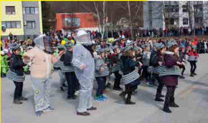
Koški (POŠ Ptujška Gora)