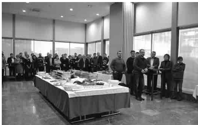
Srečanje s poslovnimi partnerji