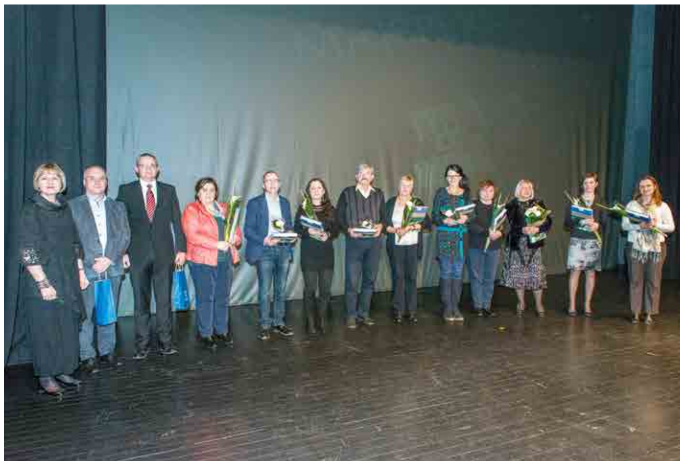
Avtorji zbornika in uredniški odbor