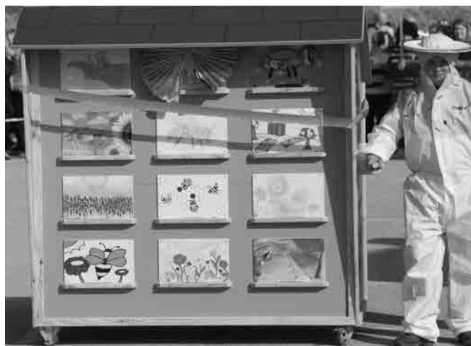
Panj haloških čebelarjev

Med otroškimi maskami so bili zmagovalci Potujoči panji iz 4. in 5. razreda, drugo mesto so zasedle Čebele BZZZZ 8. a, 8. b in 9. a. Razdeljene so bile tudi tri nagrade za tretje mesto. Prejeli so jih Medenjaki iz podružnične šole Stoperce, Koški iz podružnične šole Ptujška Gora in Sivke na travniku iz vrtca. Komisija se je odločila, da nagrade za društvene skupine razdeli po naslednjem vrstnem redu. Prvo nagrado so prejeli Od cveta do medenjaka ŠPD Preša, drugo nagrado Medjedi FS KPD Stoperce ter tretjo nagrado Smeškoti/Razpoloženkoti KUD Majšperk. Ker ni bilo prijavljenih družinskih mask, se je komisija odločila, da sponzorske nagrade razdelijo med društvene skupine. Sponzorji nedenarnih nagrad, hvala vam, da že kar nekaj let sponzorirate nagrade za družinske maske.