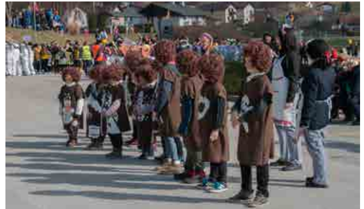
Medenjaki (POŠ Stoperce)