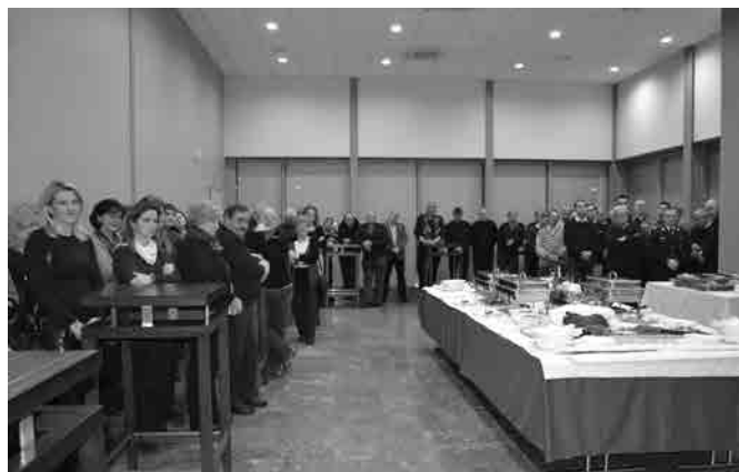
Srečanje z društvi in organizacijami