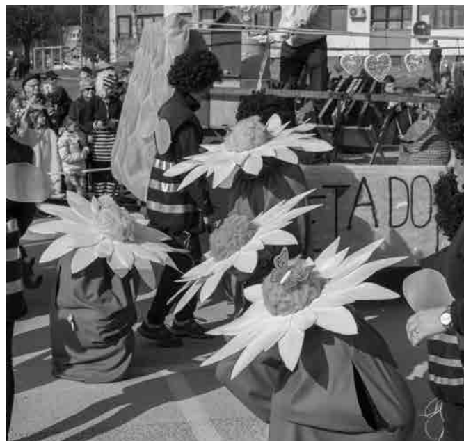
Od cveta do medenjaka (ŠPD Preša)