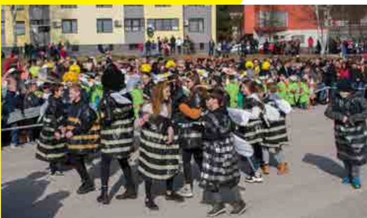
Čebele (7. a razred)