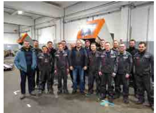
Zaposleni v podjetju W-metalTech