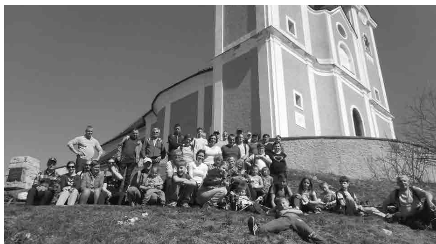
Pohod na goro Oljko