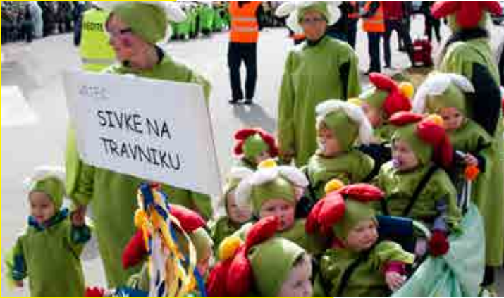
Sivke na travniku (vrtec)