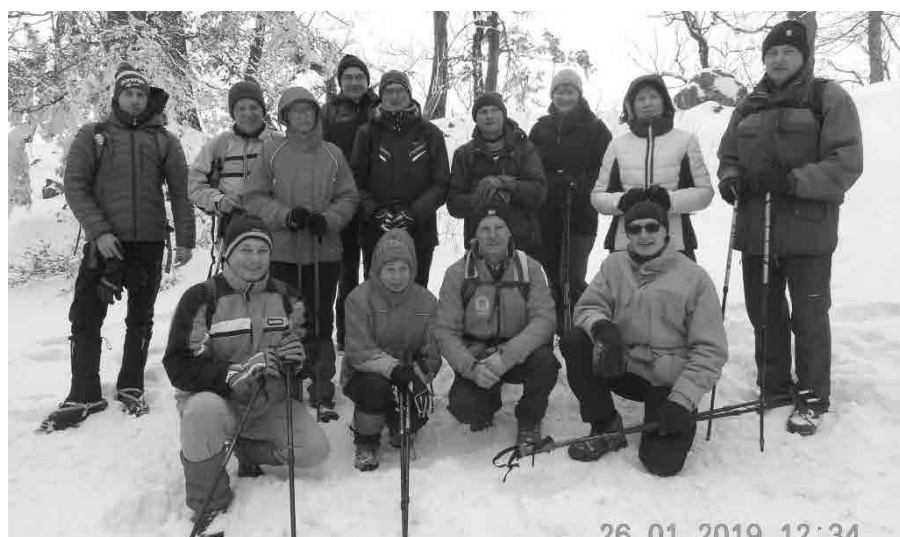
Zimski pohod na Boč