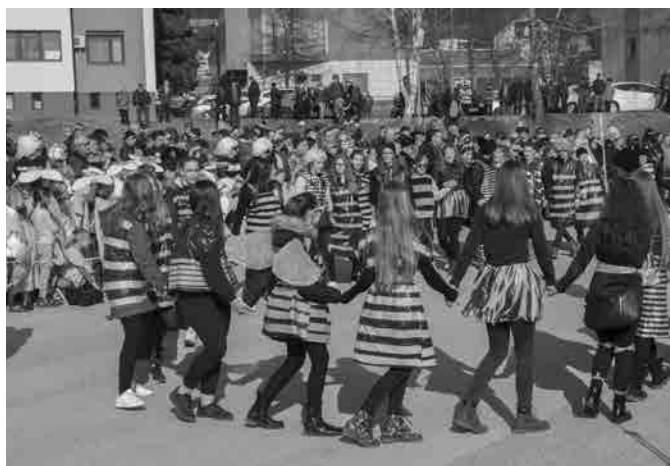
Čebele BZZZ iz 8. in 9. razredov

Po predstavitvi skupin smo se zbrali pred gasilskim domom, kjer je otroke čakala malica, odrasle pa pogostitev, ki sta jo pripravila Društvo žena Tisa Ptujška Gora in Društvo vinogradnikov Majšperk. Sledila je podelitev nagrad in rajanje s skupino Show band Elita. Dan nam je bil zelo naklonjen. Vso pot nas je spremljalo sonce, ki je privabilo številne gledalce. Spremljali so nas v povorki in si ogledali predstavitev ter podelitev nagrad. Na koncu smo se vsi skupaj povesečili pred gasilskim domom. Med potjo in pred gasilskim domom so otroke animirali animatorji iz Zum kreative.