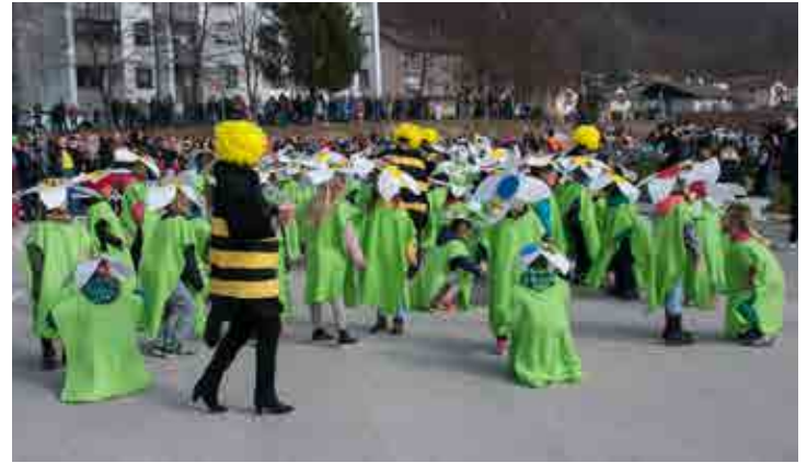
Čebelji piknik (1., 2. in 3. razred OŠ Majšperk)