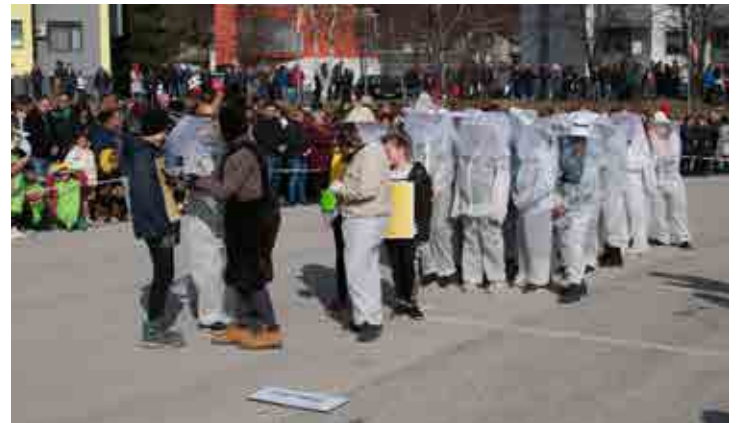
Čebelarji (6. razred)