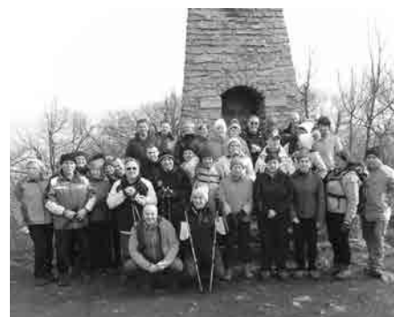
Pohod ob kulturnem prazniku na Donačko goro

V februarju se nas je na tradicionalni pohod ob kulturnem prazniku na Donačko goro odpravilo kar 50 pohodnikov. Tako tudi planinci iz Majšperka