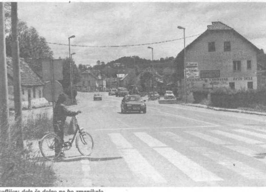
Škofljica: dela se dolgo ne bo zmanjkalo

MOŽNOST NAKUPA: na 4 ČEKE TER KARTICO EUROCARD Kljub kanalizacijskim delom je dostop možen