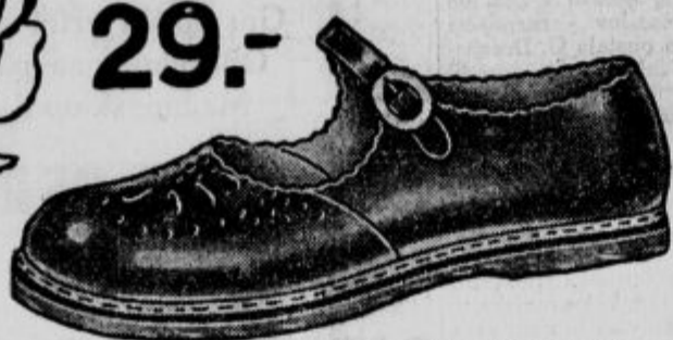
2941-42000 Vel. 27-29 Din 39.- Vel. 30-33 Din 45.-