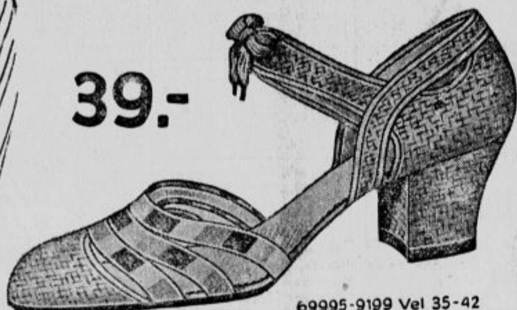
69995-9199 Vel 35-42