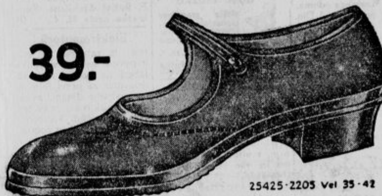
25425-2205 Vel 35-42