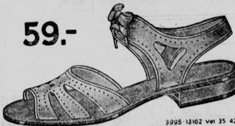
3995-13162 Vel 35-42