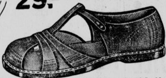
40692-61 Vel. 30-33 Din 35.-