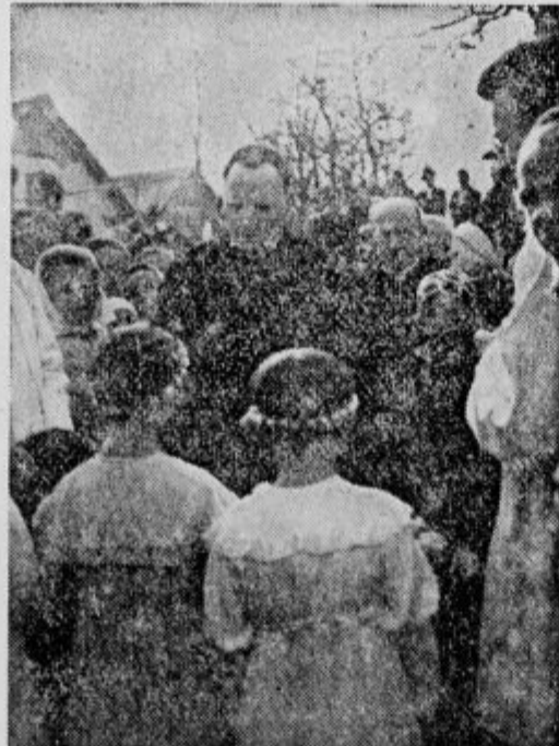
škof dr. Gregorij Rožman, ki je nosil glavno breme pripravjalnega dela za kongres.

Zato vsi skupaj danes Njega proslavimo, naj vse to slavje naše izveni v zahvalo.