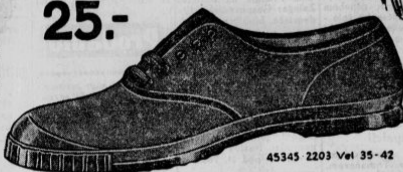
45345 2203 Vel 35-42