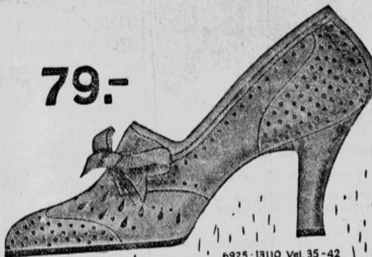
6925-13110 Vel 35-42