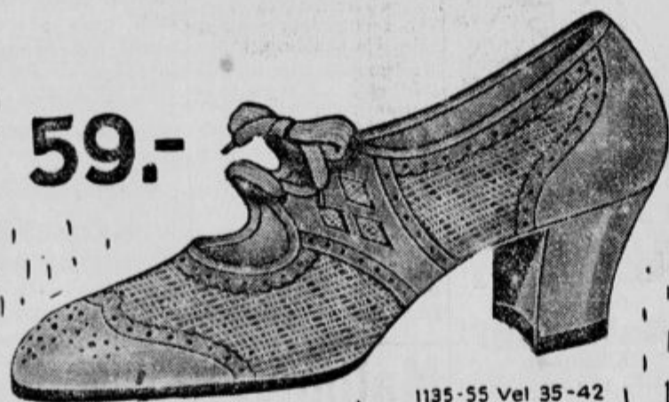
1135-55 Vel 35-42