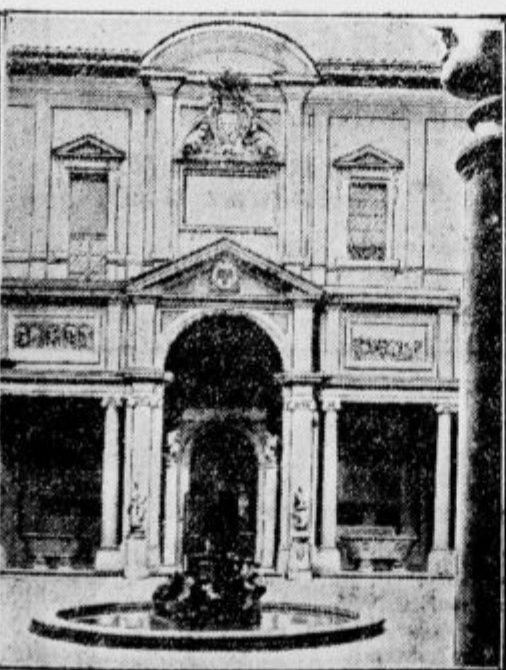
Galerija slik in dvorci Belvedere (dvorišče) v Vatikanu. O priliki nesreče, ko se je udri strop v popotju papeške švicarske straže v Vatikanu, je dal kardinal državni tajnik preiskati tudi papežovo zasebno stanovanje, če ne proti tudi tam podobna nevarnost. Prerokava je dognala, da so papeževi prostori varni, da so pa nekateri drugi deli zgradbe potrebni opore. — Vatikan, katerega zgradbe nimajo para na svetu, so začeli graditi že v 6. stoletju. Olepšavali in povečavali so ga potem razni papeži. Vatikan ima 20 dvorišč in nad 1000 sob. Najslavnjša knjižnica in najdragocenejši arhiv, prebogate umetnostne zbirke se nahajajo v Vatikanu poleg osrednjih cerkvenih uradov.