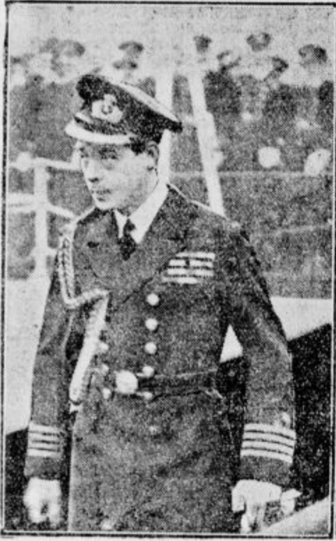
Prine Waleski, angleški prestolonaslednik, ki je svoje potovanje okoli sveta zaradi obolevnosti v Afriki prekinil in odpočival nazaj v London.

Kmalu je pozvonilo in prišel je profesor Salvemini. Dolgčas se je nekoliko ublažil, a kritičen položaj je ostal isti, kajti Salvemini je prinesel sabo zelo, zelo veliko politike.