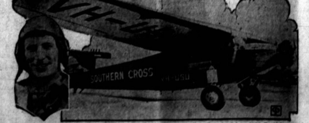
Pilot Charles Kingford-Smith, ki je v svojem letalu "Southern Cross" preletel leta 1931 Pacifično morje iz Californije v Avstralijo, namerava preleteti Atlantik iz Irske v Ameriko. Do sedaj se ni še nikomur posrečilo preleteti Atlantik iz Evrope v Združene države.

Chicago. — Čikaški planetarij v Grant parku, prvi in doslej še edini v Ameriki, ima dnevno 20,000 obiskovalcev. Policija mora delati red pred vhodom, kjer ljudje stoje v vrsti celo ure.