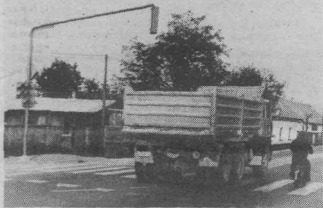
Semaforji na Litijski cesti so pričeli utripati in upajmo, da bodo začeli redno delovati že pred zimo. Sicer pa: montirani so bili že spomlad. K. HVASTIJA