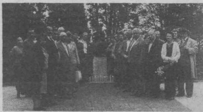
Spominski posnetek z našega izleta: ob spomeniku pred otroškim taboriščem v Jastrebarskem smo se poklonili spomenu najmlajšim žrtvam fašizma