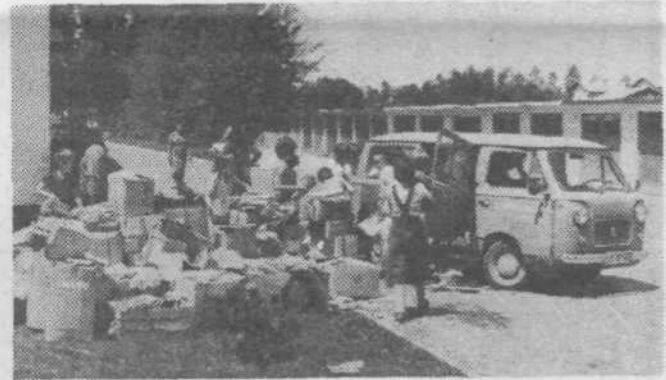
Stari pregovor: Zrno do zrna pogača! še vedno velja. Najmlajši Vevčani so se dobro odrezali pri zbiranju papirja. Naša papirna industrija pa bo prišla do prepotrebni surovin.