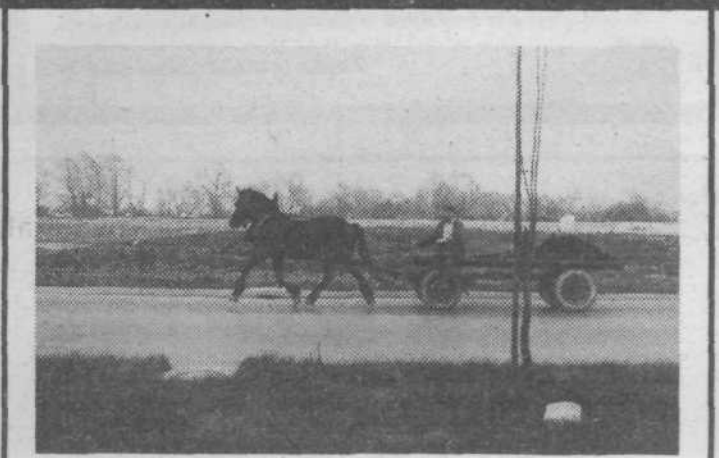
Veselo domov.