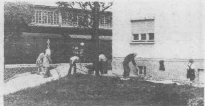
Vevčani so sami odločili za posipavanje gramoza pred stanovanjskim blokom ob Cesti 30, avgusta št. 1. Na delovni akciji so za delo poprijeli skoraj vsi stanovalci.