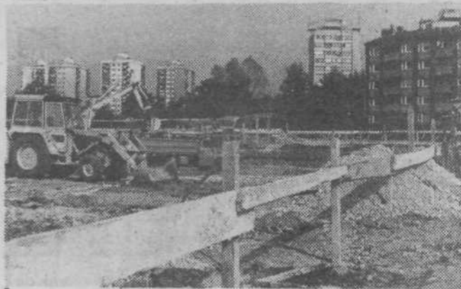
Dom starejših občanov je zakoličen