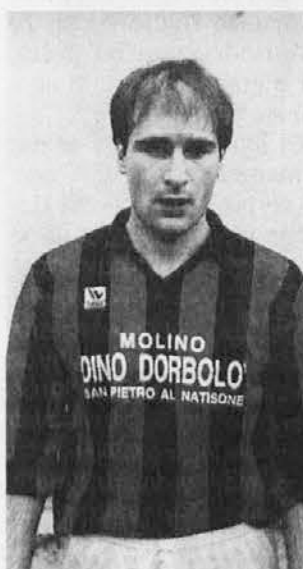
Liberale - Real Pulfero