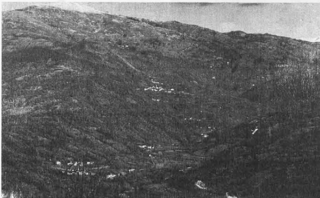
Una vecchia veduta della valle della Rieka, con Klenje (in basso a sinistra), Tarpeč, Gorenj Barnas ed il Matajur

La cosa cominciò in questo modo. Il nunac Macikov era uscito, a notte fonda, sul pajù con l'intenzione di dare un'occhiata alla stalla dove la mucca doveva fare il vitellino.