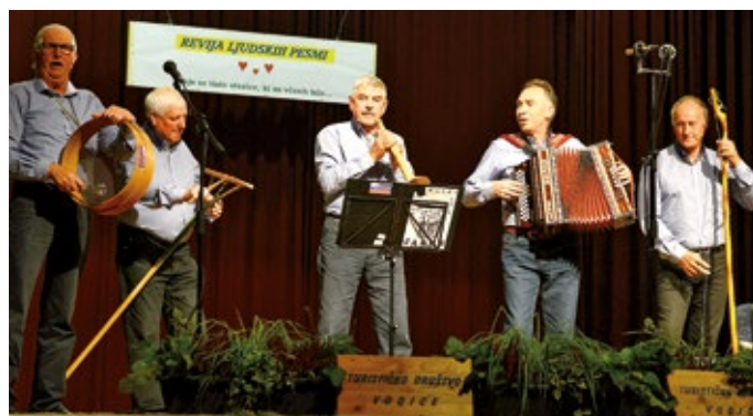
Kerglci spod Ahca.