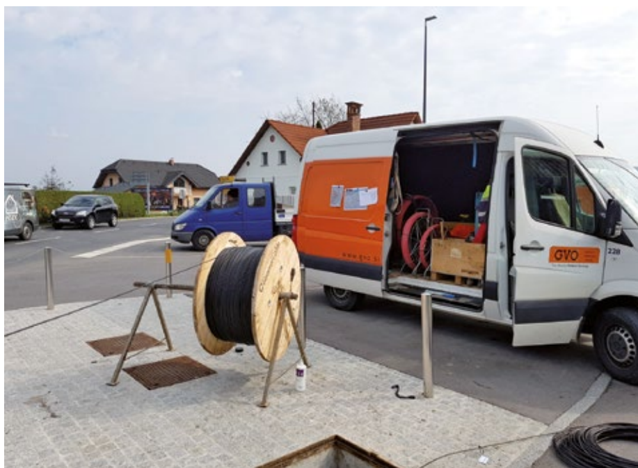
Gradnja optičnega omrežja v naselju Vodice se je pričela.

Zgrajena telekomunikacijska kabelska kanalizacija bo omogočila, da bo širitev optičnega omrežja v nadaljevanju možna tudi v južnem in vzhodnem predelu naselja Vodice (posamezni uporabniki z ulic Ob šoli, Nove ulice,