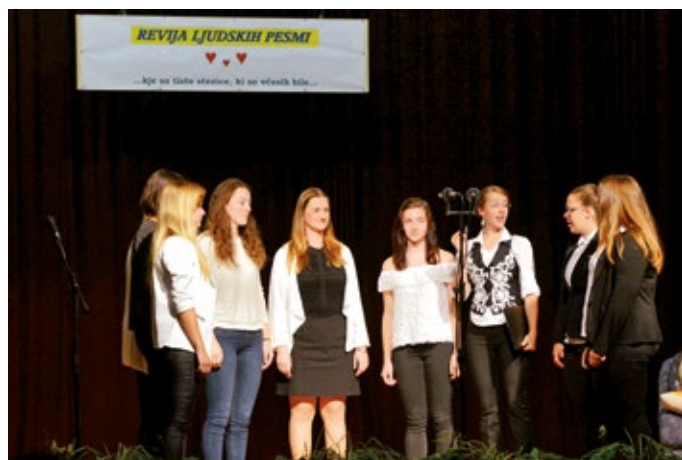
Dekliški pevski zbor Flora.