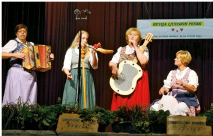
Ljudske pevke Pušeljč.

Pomemben del prireditve je predstavljalo tudi druženje po koncu pevskih točk, ob preprosti, vendar okusni pogostitvi (na tem mestu hvala tudi vsem prostovoljnim pekem/kuharjem) in neuradnem, spontanem programu – plesalo in pelo se je še dolgo v večer. Gostje in obiskovalci so stežka zapustili dvorano, večina je to storila šele tedaj, ko so bili v to časovno prisiljeni. In to pove veliko. V iskreno čast nam je, da so pesmi polnile deževno noč ter da se mnogi, ki so vas zsrbele pete, niste branili plesa. Minilo je, kot bi mignil, društvo je še poslednjič tistega dne staknilo glave in si zaslužno podalo roke, češ pa smo spet ustvarili nekaj dobrega za dušo!