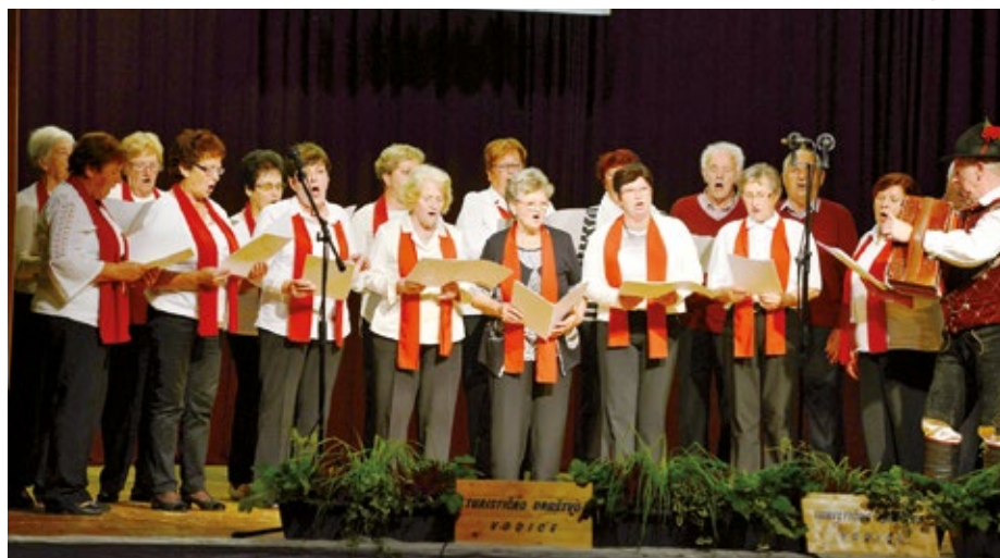
DU Bukovica Šinkov Turn.