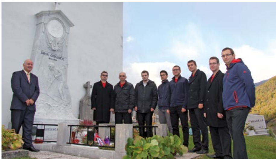
Ob Gregorčičevem grobu.

Čakala nas je še zadnja postaja. Obisk pesnikovega groba na Libušnjem, kamor ga je pospremila nepregledna množica, potem ko je v Gorici dne 24. novembra 1906 zatisnil svoje oko. Prižgali smo svečko, zmolili za pokoj duše in zapeli. V soju zahaja-