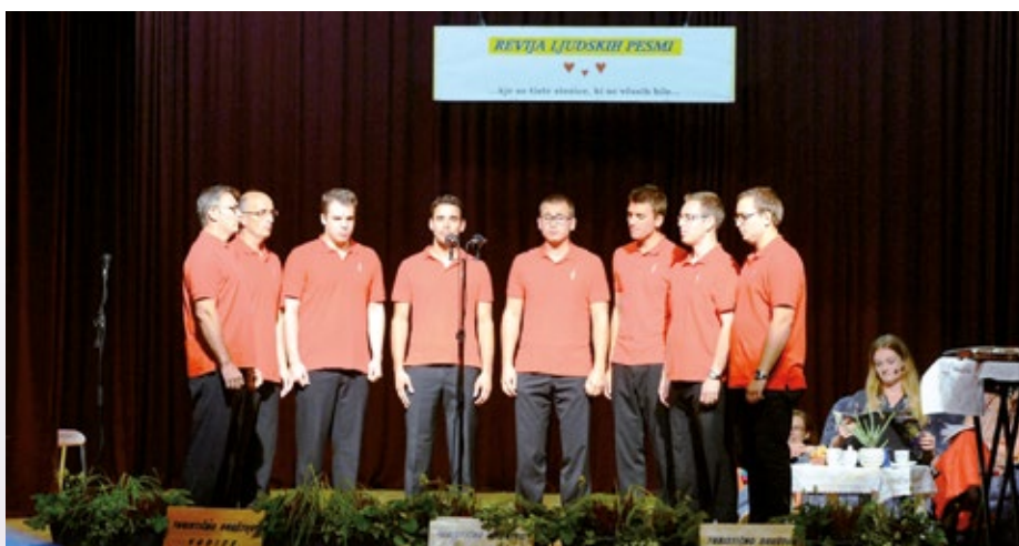
Pevska skupina Matici.