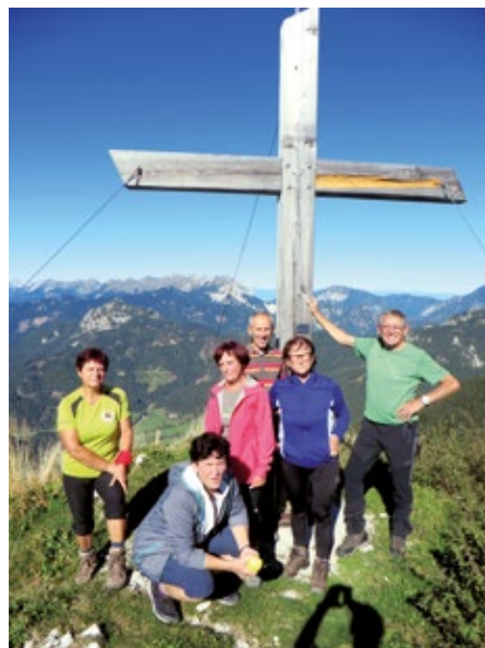
Na vrhu Golega vrha nad Jezerskim.

Pot na Peč iz Rateč je primerna tudi za nezahtevne pohodnike, ki jih na vrhu, če je primerno vreme, kot smo ga imeli mi, nagradi z razgledom, za katerega bi se moral marsikje bistveno bolj potruditi. Pogled na Julijce na jugu in koroške doline na severu – tja do Vrbskega jezera, je plačilo za prehojeno pot.