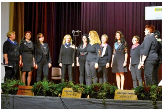
Pevska skupina Tuščak Bač.