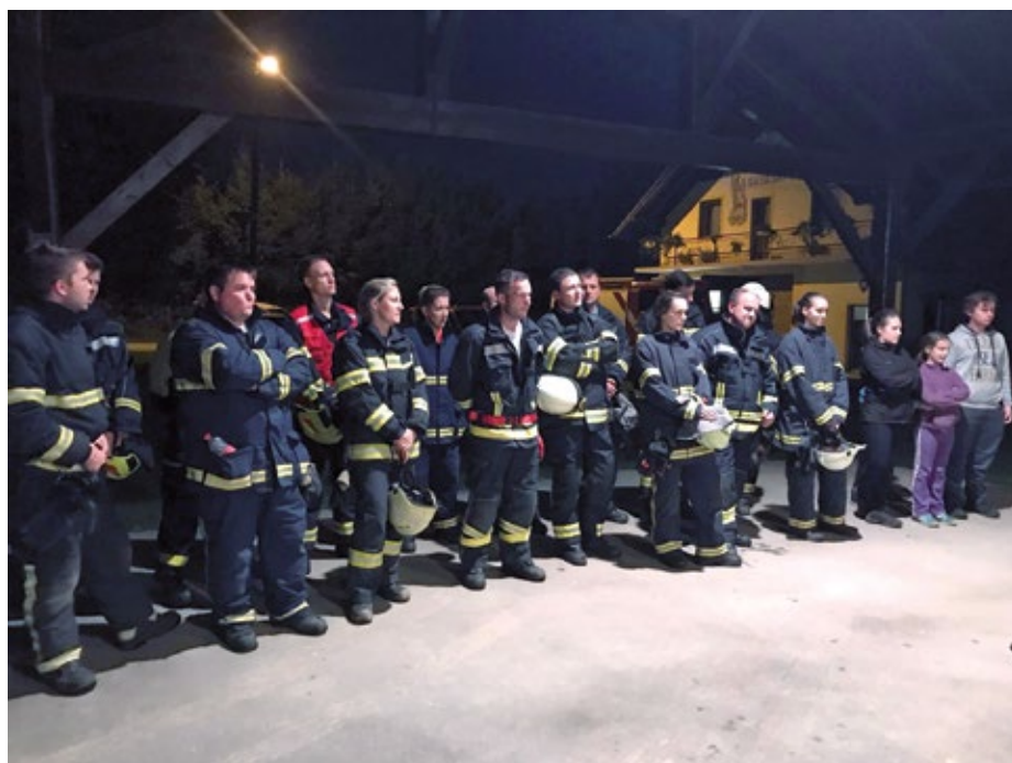
Vaja Šinkov Turn.

Poleg zgoraj omenjenih vaj so operativne vaje izvedla tudi vsa društva. Seveda nismo pozabili na preventivo – izobesili smo plakate in podelili letake, katerih osrednja tematika je letos klicna številka 112. Društva so organizirala pregled, servis in možnost nakupa gasilnikov, ki bi jih moralo imeti vsako stanovanje. Krajanom se iskreno zahvaljujemo za možnost uporabe objektov za urjenje znanj! Prav tako je vredno izpostaviti pohvalo in zahvalo za strpnost in potrpežljivost, ko smo delno ali v celoti zaprli cestišče in vam morebiti spremenili predvideno pot. To delamo za vas, da bomo pripravljeni in kar se da učinkoviti, ko bomo pozvani na posredovanje na intervenciji.