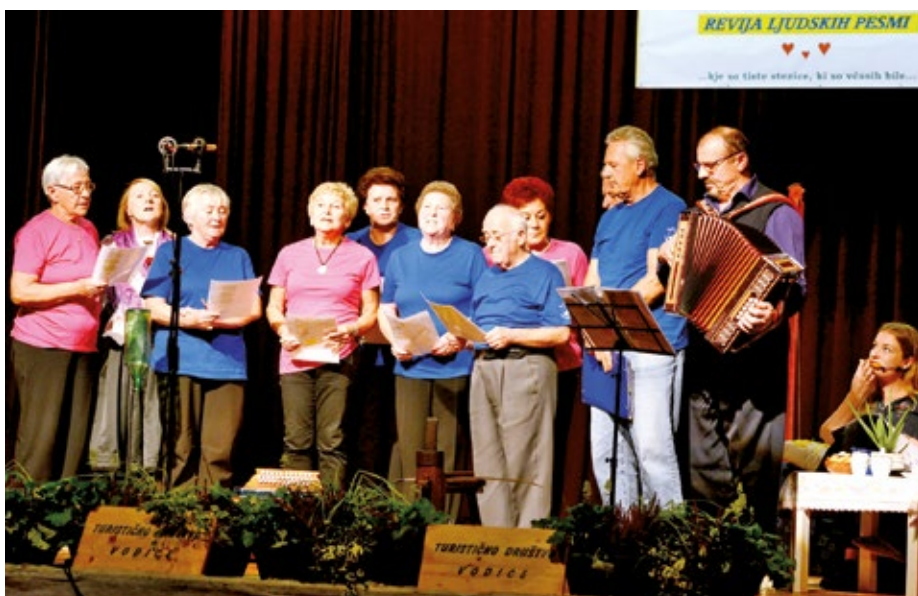
Pevski zbor DU Vodice.