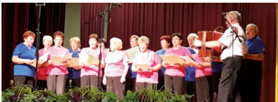
Pevska skupina DU Bukovica – Šinkov Turn.

Po končani prireditvi se je voditelj zahvalil Občini Vodice in gospodu županu za odobrena finančna sredstva in povabil vse navzoče na druženje. Nedeljsko popoldne se je zaključilo nadvse prijetno.