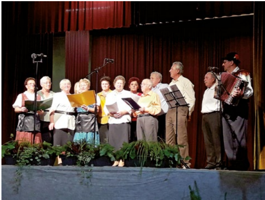
Pevska skupina DU Vodice.

S posebno priredbo plesa Vodiške preste so nas najprej razveselili člani