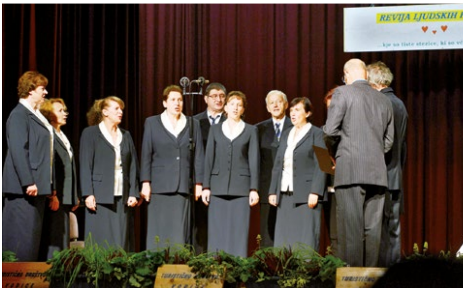
Pevski zbor Biser.

Hvala vsem, ki ste na kakršen koli način prispevali k izvedbi same prireditve – v prvi vrsti najlepša hvala vsem članom društva, s katerimi smo znova dokazali, da smo zelo složen in zagnan tim, hvala vsem izvajalcem ljudskih pesmi, ter seveda najlepša hvala vsem gostom in obiskovalcem! Prav vsak je prispeval kamenček v