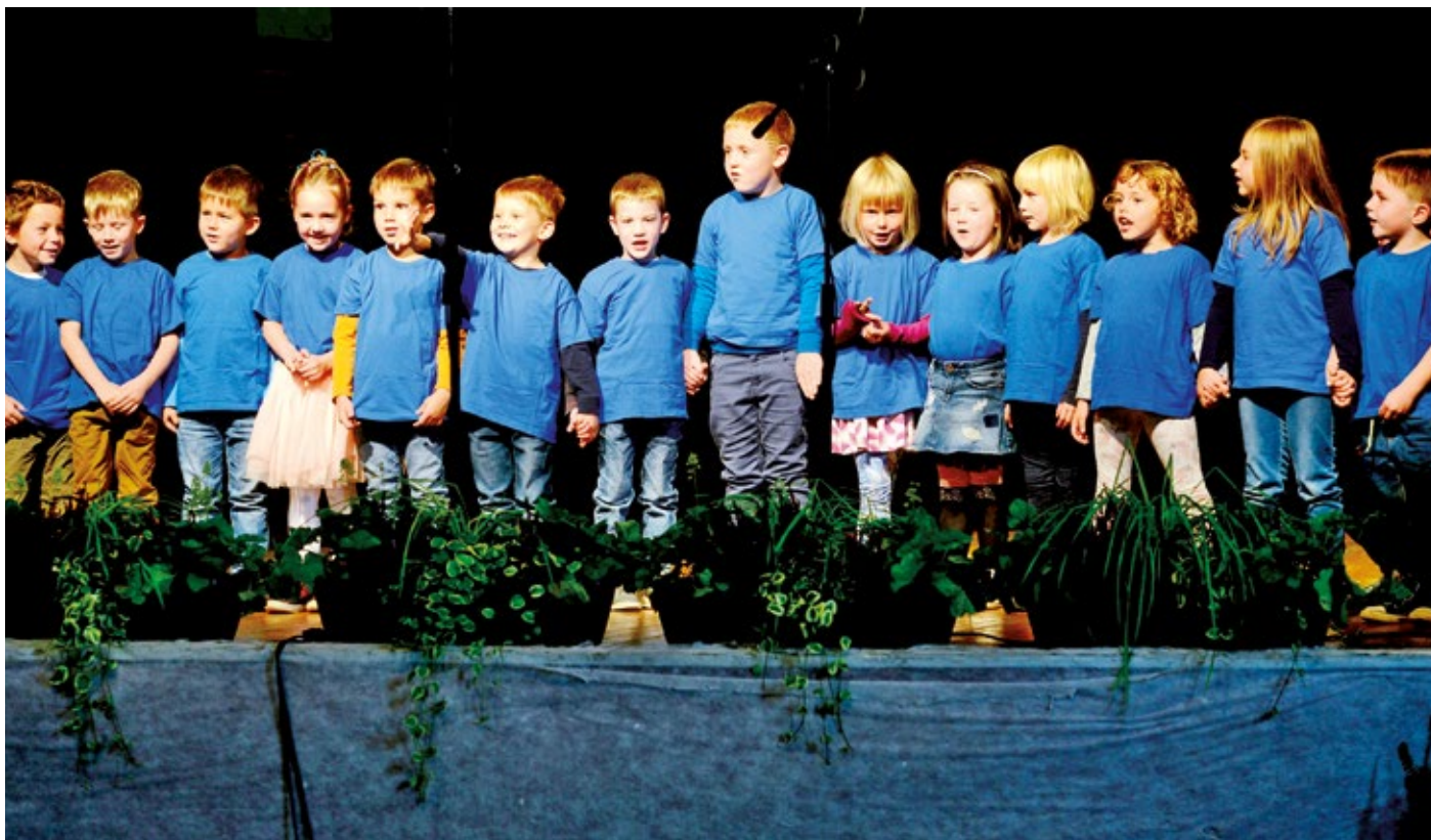
Otroci vrtca Škratek Svit.

smo nadaljevali z nastopom Godčevskega tria in Folklornega društva Šenčur s pesmimi: Ko mati kruh je dala, Bleda luna, Pod rožnato planino in še zaigrali Vse sobote in nedelje in Kadar spomnim se.