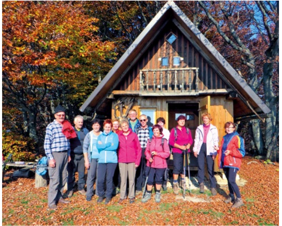
Zadovoljna družba na vrhu Kojce.

Na prvi septembrski pohod smo se odpravili iz Logarske doline. Obiskali smo manj znano Krofičko (2083 m/nv). Pot nas je vodila pod severnim ostenjem Ojstrice do prijetne planinske kočje na Klemenči jami. V bližini kočje je najdebelejši macesen v Sloveniji, ki smo ga seveda obiskali. Pot se je za kočjo začela strmo vzpenjati, vendar smo zaradi lepo speljane trase do vrha prišli po prijetni senci. Po nekaj urah vzpona sta nas na vrhu sprejela sonce in čudovit razgled na okoliške vršace, ki pa so jih občasno zakrivale jesenske meglice. Ojstrica je bila tako rekoč »na doseg roke«, kot tudi, preko Logarske doline, Olševa in proti vzhodu Raduha ter nekoliko bolj oddaljena, v ozadju proti severovzhodu tudi Peca. Proti zahodu so se lepo videli vrhovi Kamniško-Savinjskih Alp tja do Kočne in severno od njih na vrhove nad Matkovim kotom in naprej v Avstrijo. Po krajšem predahu na vrhu smo se prijetno okrepčani spustili proti dolini. Med spustom