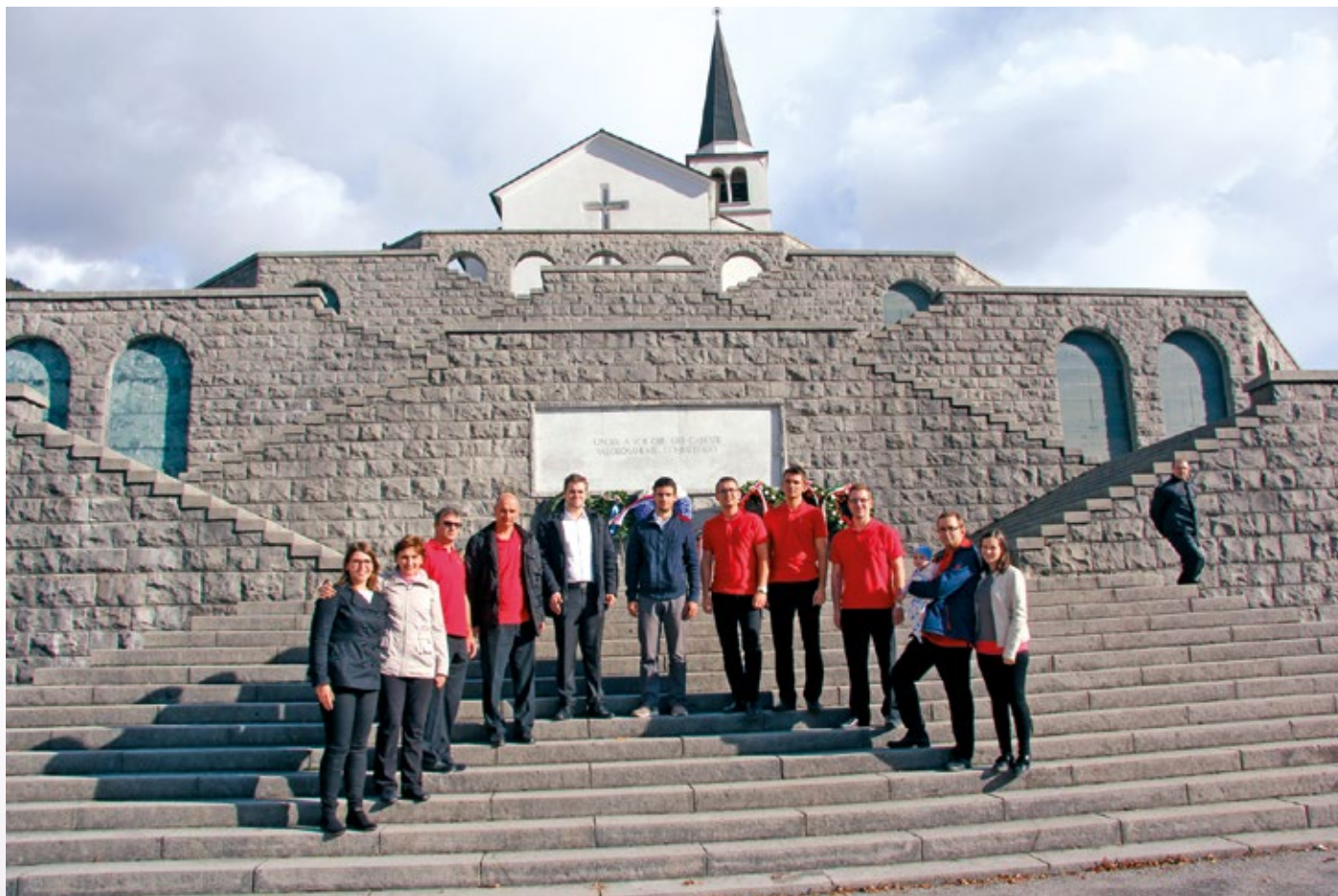
Kostnica sv. Antona.

arja, so doživele zasluženo krono ob stiku z ljudmi, zgodovino in kraji, ki jih malo poznamo in redko obiščemo. Več o dejavnosti društva lahko preberete in si ogledate na http://kulturnodrustvoutik.si/