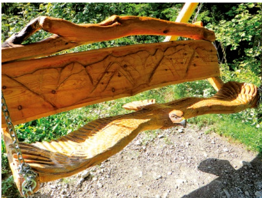
Zanimiva klop „orel“ pri koči na Klemenči jami.

Ko se bo ponovno nabralo kaj zanimivega, se spet oglasi.