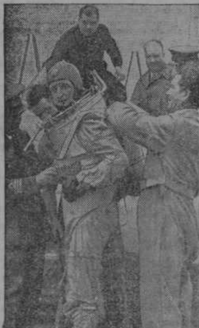
Italijanski letalec Pezzi se je povzpел 15.000 m visoko v letalu in je dosegel svetovni rekord. Na sliki vidimo letalca po doseženem rekordu.

Streljanje s tihotapci. Pri Grūtovcih in Komorcih je zadela ob državni meji obmejna pa-