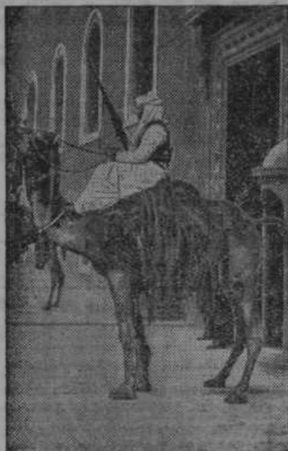
Na obletnico proglasitve italijanskega imperija so tvorili v Rimu pred palačo Venezia, v kateri vlada Mussolini, častno stražo afriški jezdeci na kamelah.

kakor jajce debela toča, ki je zbila vse mestne nasade in zasebne vrtove.