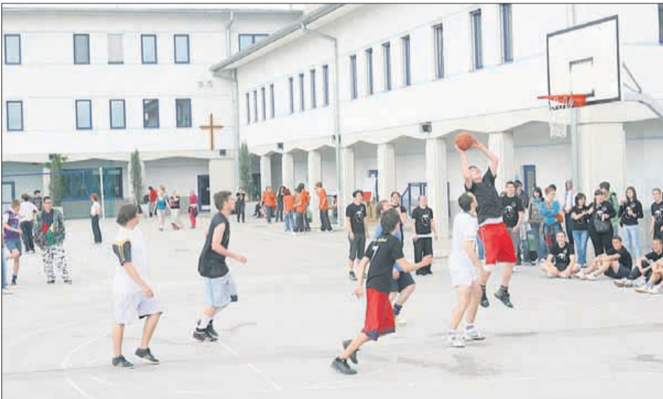
V košarki se je med pumovci iz različnih krajev Slovenije vnel pravi boj.