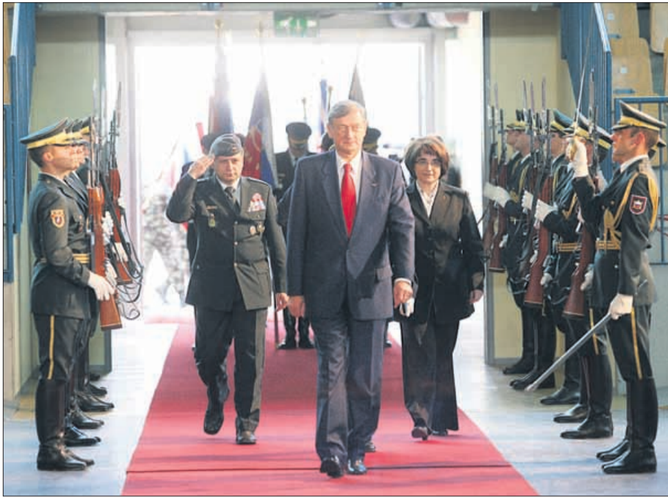
Slavnostni prihod predsednika države in vrhovnega poveljnika obrambnih sil dr. Danila Türka v spremstvu ministrice za obrambo dr. Ljubice Jelusič in načelnika generalštaba generalmajorja mag. Alojza Šteinerja.