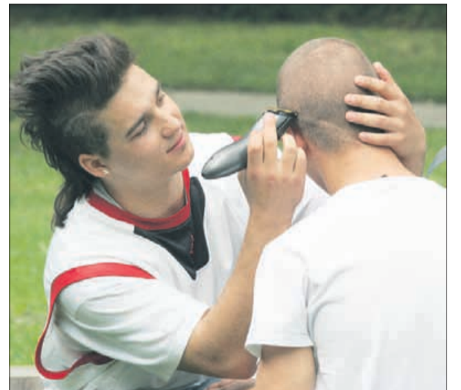
... si vzamejo čas za novo pričesko ...

Velika nagrada za celjske pumovce pa je bila osvojitve skupnega pokala na nedavnem medpumovskem športnem turnirju, ki je bil pred Don Boskovim centrom. Tudi ta turnir ima že petletno tradicijo. Prišli so udeleženci programa PUM, neformalnega programa izobraževanja, ki nudi brezplačno pomoč in spodbudo pri učenju in iskanju zaposlitve, iz vse Slovenije. Pomerili so se v nogometu, odbojki in košarki ter