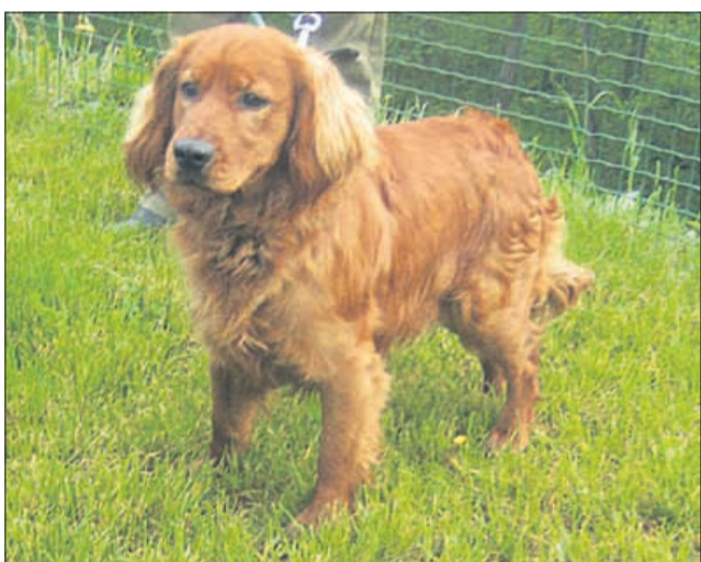
Sem leto in pol star koker španjel, ki so ga našli v Laškem pri zdravilišču. Zelo pogrešam svoje lastnike, zato jih prosim, da pridejo čim prej pome. Hvala. (7965)