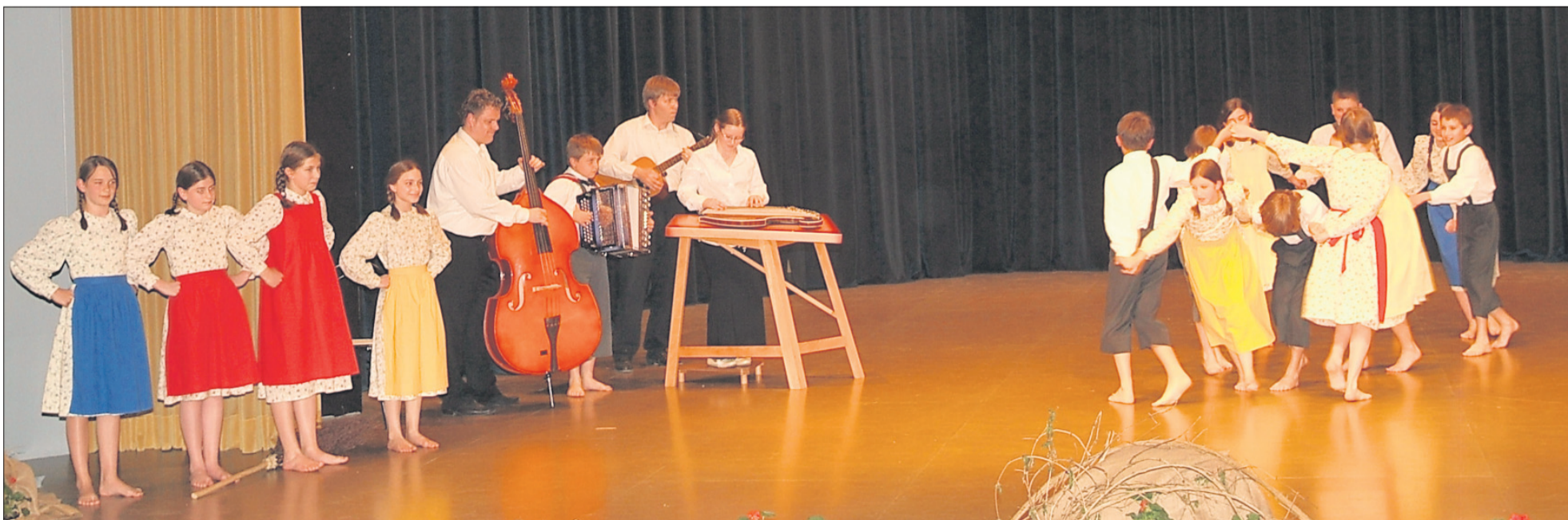
Folklorna skupina I. osnovne šole Rogaška Slatina je sodelovala na reviji Pika poka.