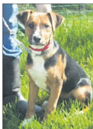
My name is Suzi and I am 4 months old (moje ime je Suzi in sem stara 4 mesece). I speak English and Slovene and I am a very nice and sweet dog (govorim angleško in slovensko in sem zelo prijazna in ljubezniva psička). Would you like to know me? (me želiš spoznati)?