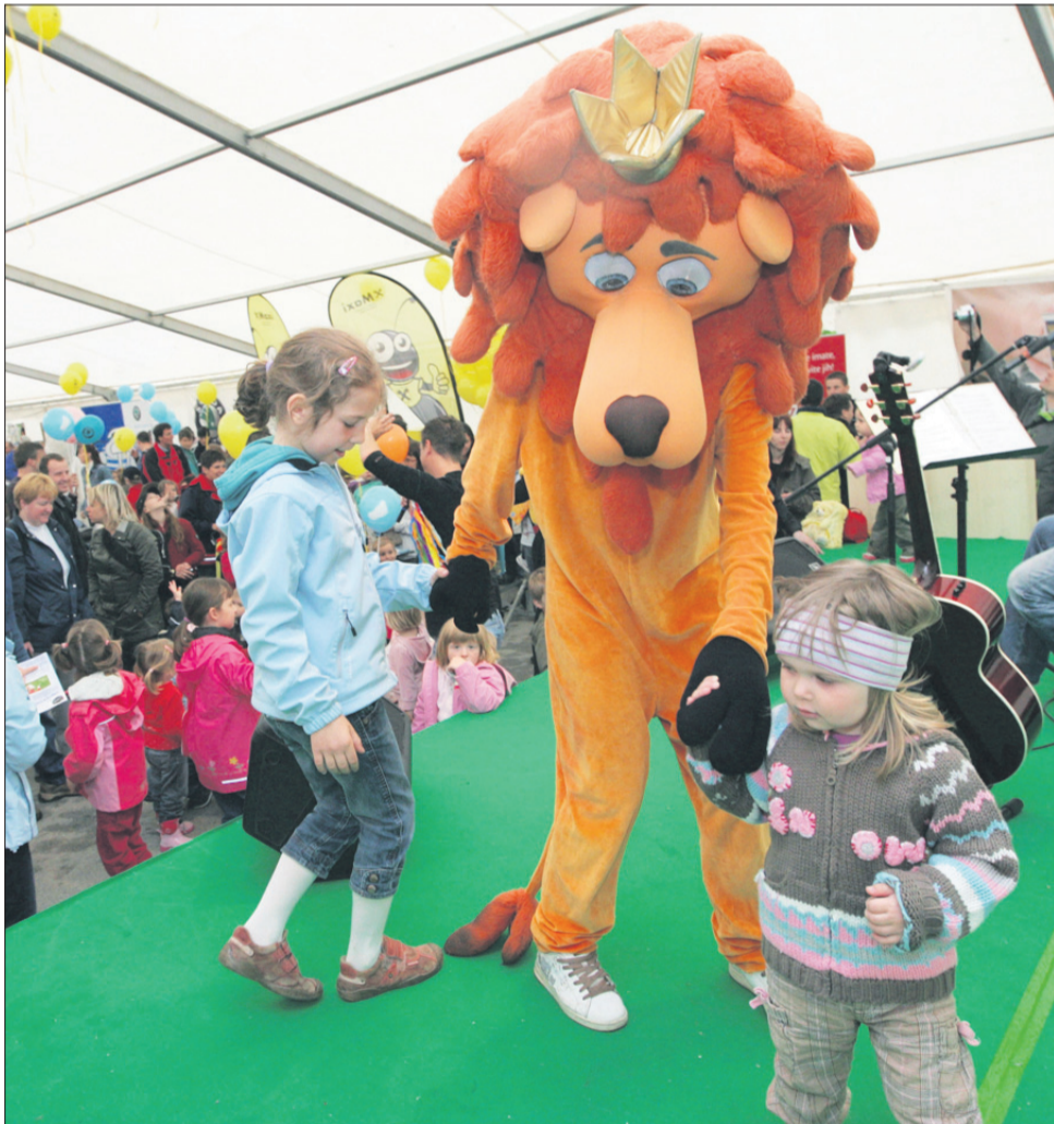
Otrokom so bili v Laškem na vsakem koraku na voljo prikupni animatorji, predvsem liki iz najbolj priljubljenih otroških knjig in risanih serij.

Mojstri učinkovitosti energije, opreme in trajnosti