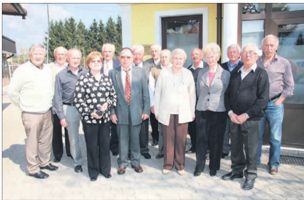
Gasilski posnetek za spomin na visok jubilej