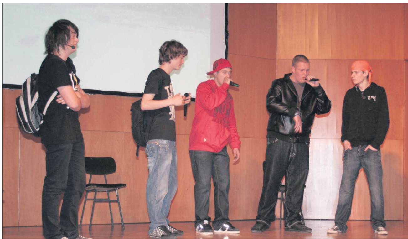
Angleška dramska skupina

čijo v ta projekt, že veselijo nove teme, ki bo razlog za dodatno medgeneracijsko sodelovanje prihodnje leto. AL