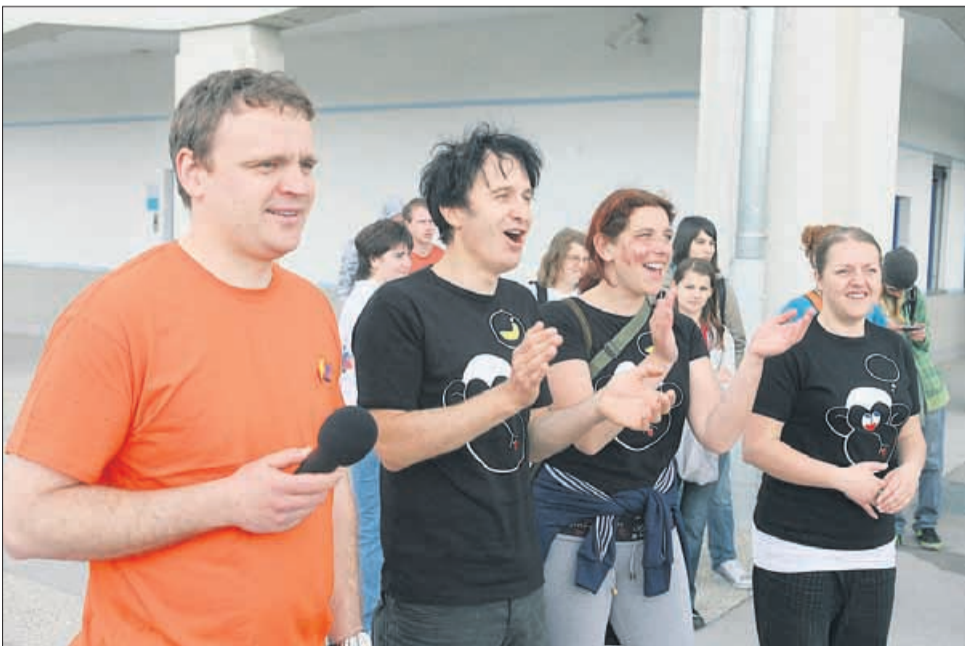
Navijači so bili glasni.