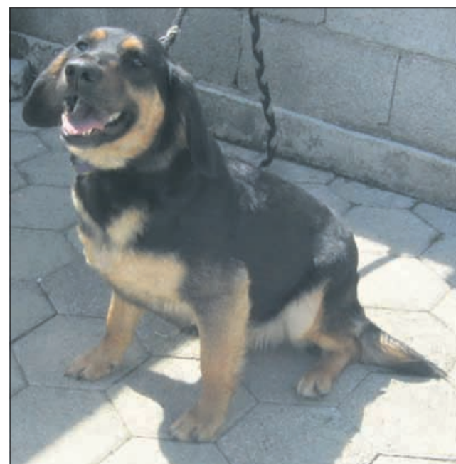
Ha-ha-ha, kako smešno! Prosim, ne spravljaj me več v smeh, saj mi bo drugače še počil trebušček. Ha-ha! (7962)