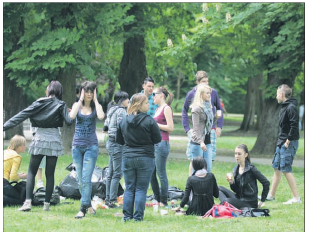
... eni se raje zabavajo po svoje.