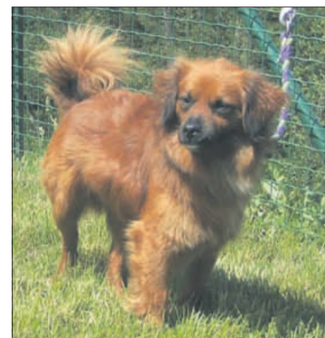
V sebi prepoznam malo pekinezerja in malo koker španjela. Kaj pa vi vidite v meni? Mor-da svojega novega ljubljence?

DELOVNI ČAS pon. - pet. 7. - 19. ure sob. 7. - 12. ure ned. 7. - 8. ure dežurstvo 24 ur