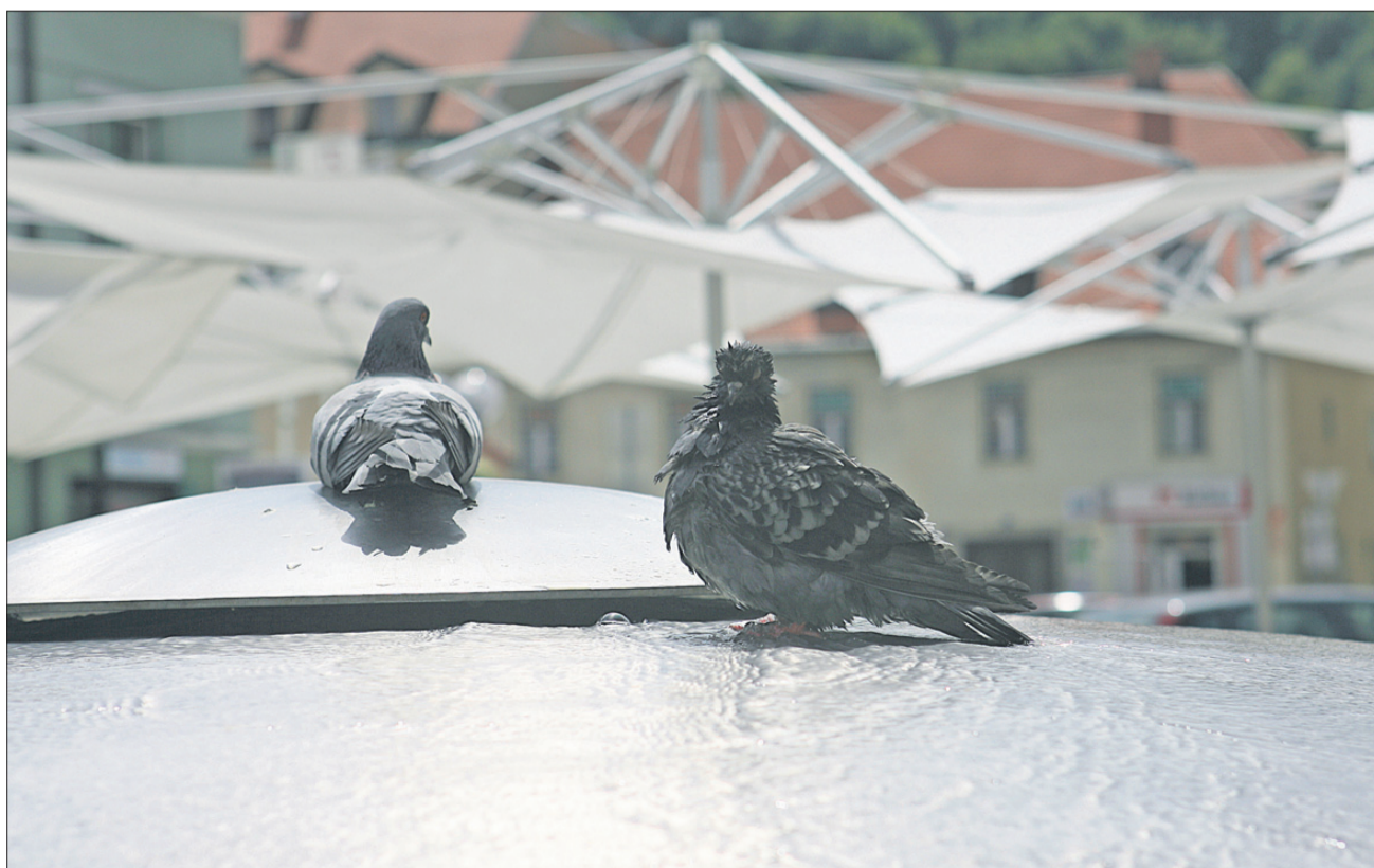
Golobom je vroče.