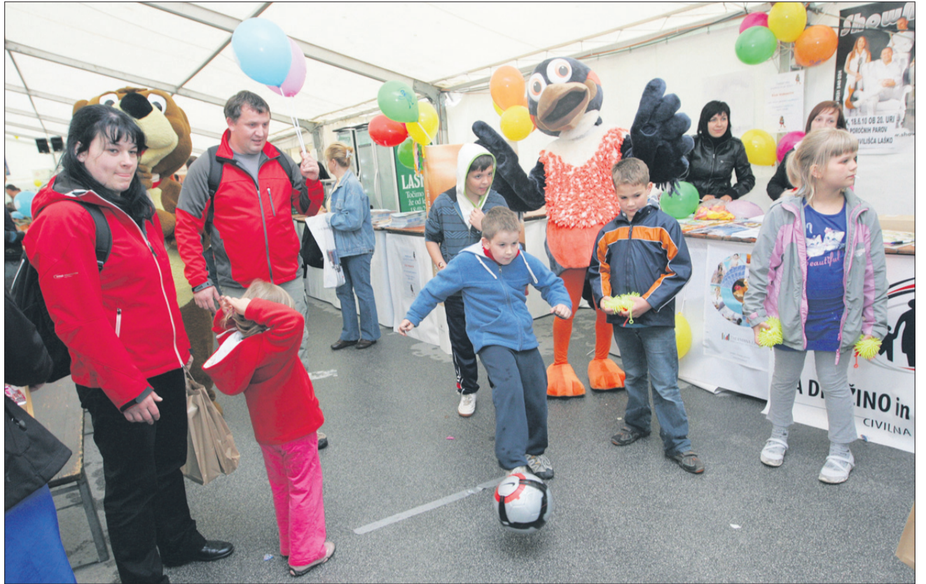
Sobota in nedelja sta bila v Laškem družinska dneva, aktivnosti pa v skupno zabavo prilagojene tako staršem kot otrokom.

menjena glasbenim in gledališkim dogodivščinam za najmlajše. Niso manjkali niti klovni, čarodeji, animatorji, lutke, prireditve pa so bile tudi izobraževalne narave. Starši in otroci so, čeprav pod šotorom, množično obiskali tudi Fifi s cvetličniki na njeni ekokmetiji ... Že dopoldne so se številni udeležili družinske mase, na okrogli mizi pa so se pogovarjali o pomenu in vlogi družine v današnjih ča-