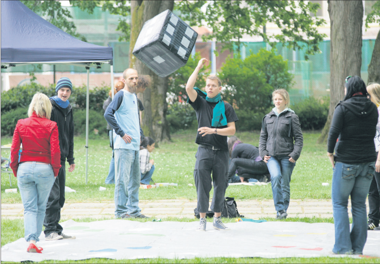
V parku so na voljo različne družabne igre, po katerih mladi radi posežejo ...