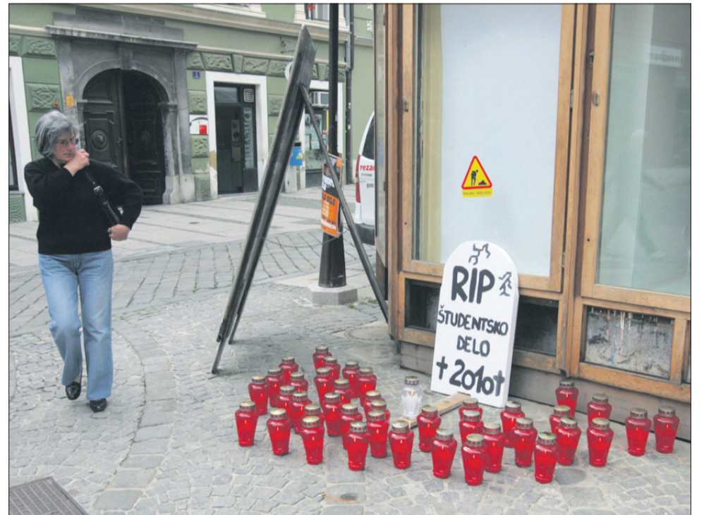
Mladi so se v petek popoldne s prižiganjem sveč v središču Celja poslavljali od študentskega dela.