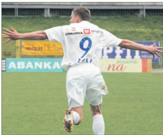
Premalokrat so se celjski nogometaši v tej sezoni veselili po zadetkih. Dosegli so jih 53, prejeli pa tri več.