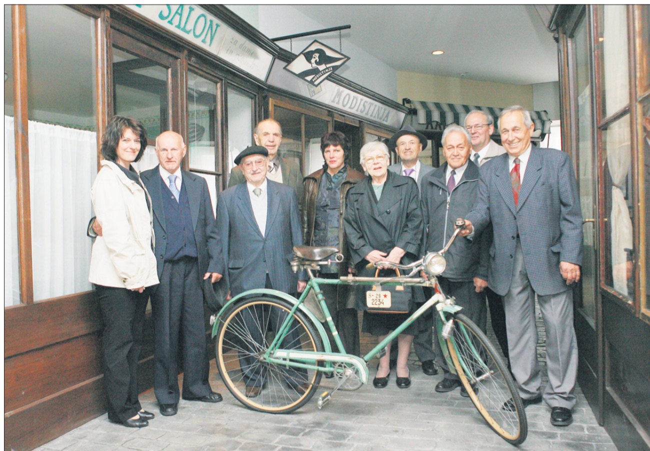
Častno Valvasorjevo priznanje so v ponedeljek v Ljubljani prejeli demonstratorji – obrtniki, ki so se pred odhodom na slovesnost za spomin takole postavili pred objektiv v »svoji« ulici.