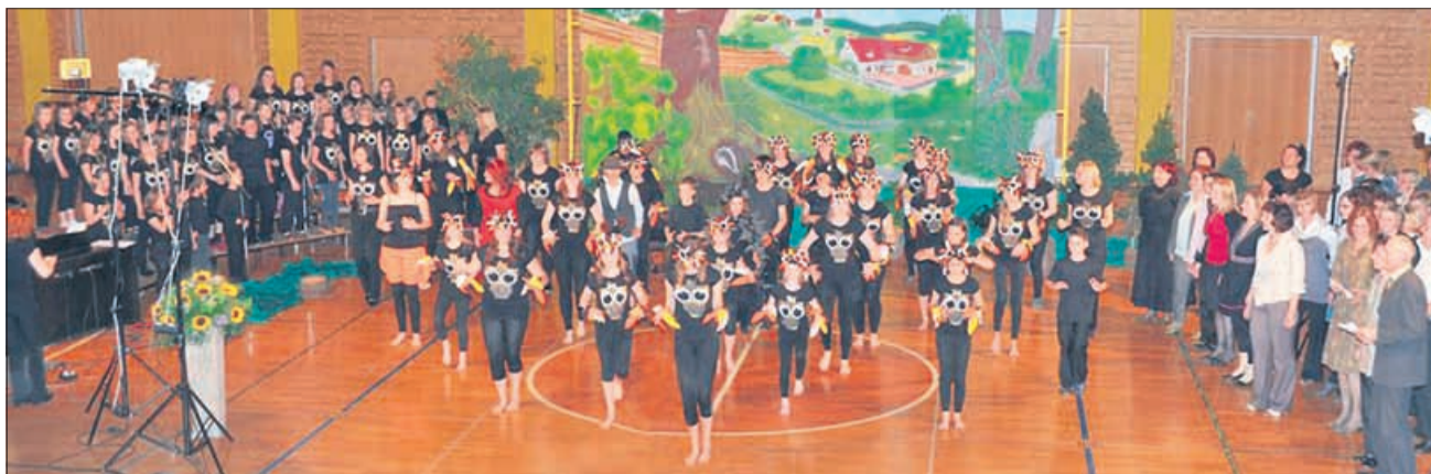
Slovesno praznovanje z muzikalom Čuk na palici ob 100-letnici OŠ Prebold