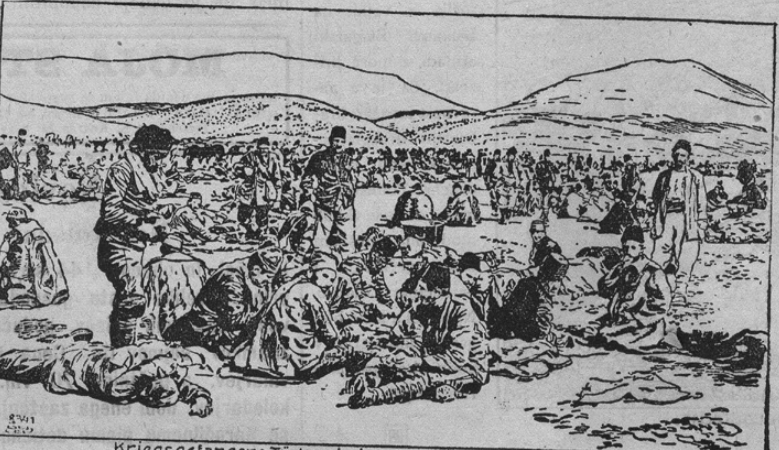
Kriegsgefangene Türken im Lager von Podgoritz

Mesto Podgorica bilo je že začetkom te grozovite balkanske vojne ena najvažnejših postojank in glavno taborišče črnogorske armade. Naša slika kaže v krvavih bojih okoli trdnjave Skutari vjete turške vojake, ki so jih spravili Črnogorci v svoje taborišče v Podgorici.