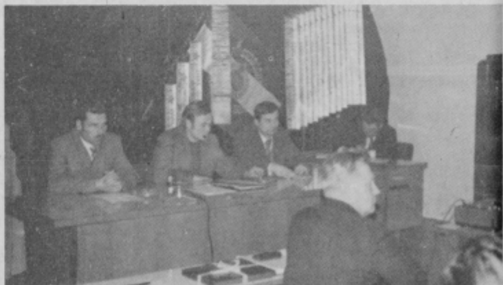
Druga skupščina občinske organizacije ZRVS Ormož.

OSNOVNA ŠOLA FRANCA OSOJNIKA V PTUJU razpisuje prosto delovno mesto