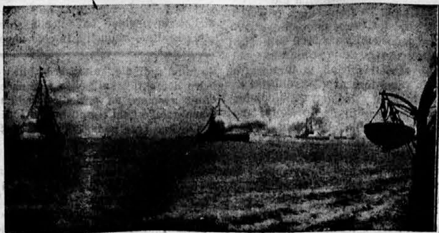
Manevri japonske mornarice.

— Demokrati proti vmešavanju Združenih držav v Nikaragui. Na zadnji seji ameriškega senata je demokrat Hefflin ostro nastopil proti ameriškemu vmešavanju v Nikaragui ter zahteval takojšen odpoklic ameriških čet. Hefflin je dejal, da je zagrešila ameriška vlada z vojaškimi transporti v Nikaragui kršitev ustave, ker je dejansko pričela v varstvo predsednika Díazja vojno, ne da bi preje poslala njegovemu nasprotniku vojne napovedi, kakor to zahteva ustava. Hefflin je nadalje predlagal resolucijo, da se ne sme ameriških čet nikdar več uporabiti za intervencije pri privatnih sparih v osrednji Ameriki. — Nastop demokratskega senatorja je posledica poraza ameriških čet v Nikaragui. Kakor pa govore zadnje vesti, bo ostal nastop Hefflina brezuspešen, ker namerava ameriška vlada še zvišati število svojih čet v Nikaragui na 25.000 mož. Prvi novi transporti čet so bili že odposlani.