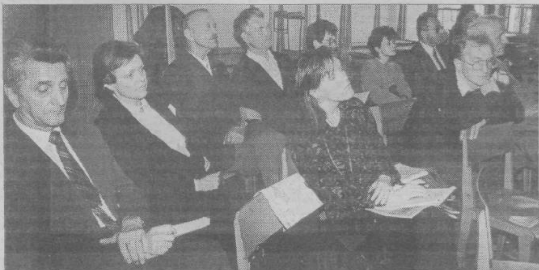
Udeleženci sekcije so prisluhnili zanimivi razlagi uvodničarjev in kasneje v razpravi dodali še svoje misli