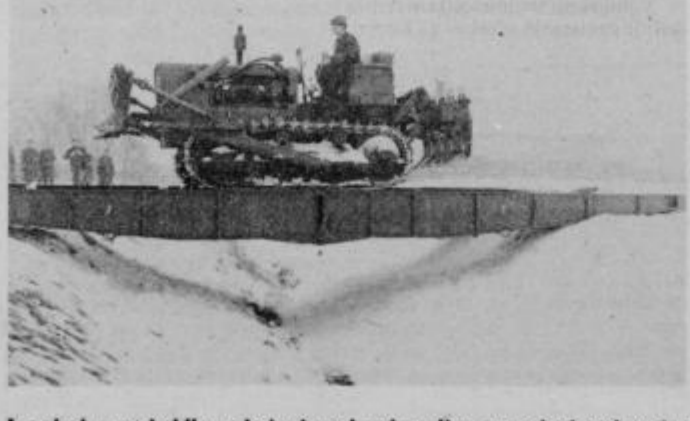
Lansirni most je bil v nekaj minutah pripravljen za prehod prek vodne ovire.

Da bi prikazali javnosti njihovo delo na čim bolj neposreden način, so predstavniki Ljubljanskega armadnega območja prejšnji teden povabili novinarje na obisk v inženirsko enoto v Mariboru. Gostitelji so nam prikazali delo v lansirnih mostovi pri premogovanju vodne ovire, delo rovokopača, s katerim so izkopalni že na kilometre jarka za vodovod okrog Rogaske Slatine. Videli smo tudi naprave za prečiščevanje in fil-