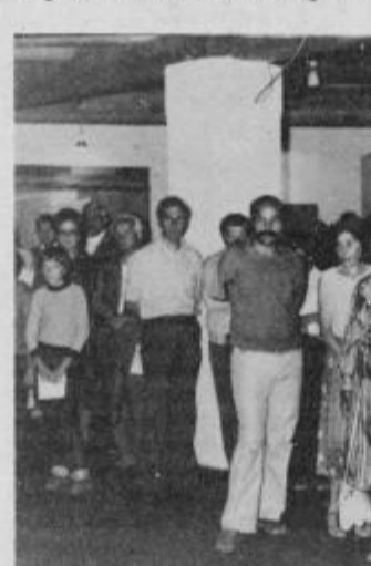
V paviljonu Dušana Kvedra