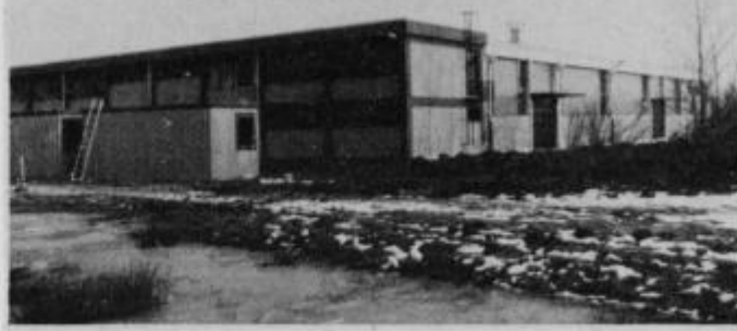
Sodobni obrat pohištvenega okovja RŠC na Zg. Polskavi pričakuje nove naložbe.

Delovna zavest, mladostni pollet in prav gotovo tudi pomembno spoznanje, da so mnogi v KS Zg. Polskava dobili zaposlitev v domačem kraju in se jim tako ni treba več voziti v oddaljena industrijska središča, so dovolj trden motiv za nadaljnje doseganje proizvodnih uspehov, seveda v odvisnosti od tržnih razmer in potreb. Ob tem je potrebno tudi poudariti tesno sodelovanje obrata z življenjem in delom v krajevni skupnosti Zg. Polskava in v širšem okolju.