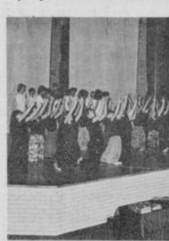
In na odru v centru srednjega usmerjenega izobraževanja v Ptuj.

vor, da bo nekaj več o tem mogoče povedati delegatom do naslednje skupščine. Danes pa vemo, da smo ta denar namenili za ureditev obstoječih prostorov muzejskih zbirk na gradu in da zaenkrat o novem muzeju NOB ne bo nič, niti z ureditvijo nekdanjih prostorov ptujskih zaporov, kjer je bila dolžna prvotna lokacija in kjer bi muzej — po mnenju nekaterih že bil, če bi se del lotil pravočasno in bolj zavzeto. Ta mesec se je v Ptuj začelo tudi občinsko srečanje gledaliških skupin, na katerem so se najprej predstavili Ptujčani z Goldonijevimi ZDRAHAMI, sicer pa smo na ptujskem odru videli osem več ali manj uspešnih nastopov igralcev iz Hajdine, Vitomarc, Stoperc, Destrnika, Grajene, Zetala in Ptuj.