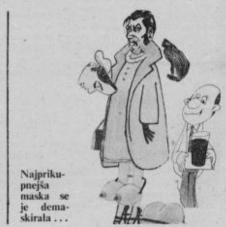
Najprikupejša maska se je demaskirala ...