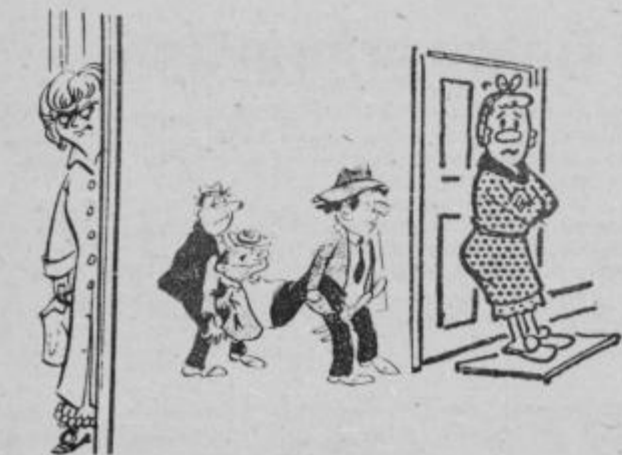
— Hvala lepa, da sta ga prinesla, kar semle ga položita. — Zelo ste prijazni, gospa. — Kaj bi ne bila, ko sta mi pa prinesla domov celega prašiča!