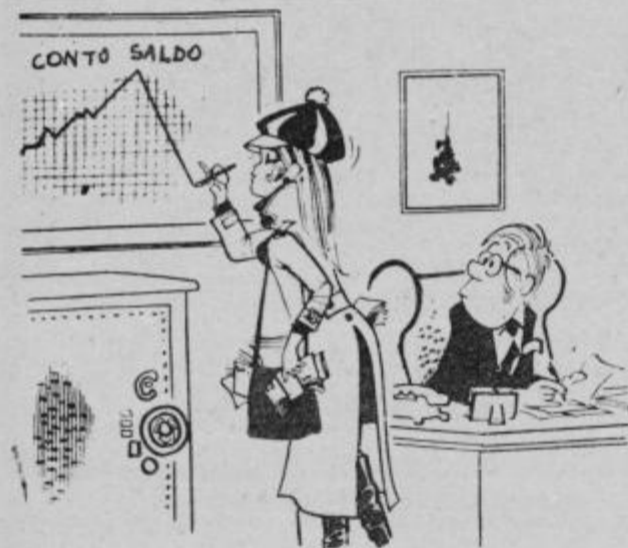
Rekli ste, da si naj za praznik izberem kako malenkost po želji, sem si samo izposodila malenkost iz blagajne ...