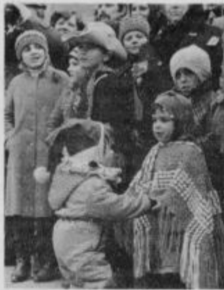
Mali obiskovalci kurentovanja sta preganjali dolgočasno čakanje tako, da sta sami zaplesala.

Na folklorno in karnevalsko povorko, ki je bila v nedeljo popoldne v Ptuj (21. februarja), je bilo treba precej časa čakati, ker se je pač čas obhoda nekoliko zavlekel. Čeprav je bilo pošteno mrzlo, to najmlajših ni oviralo, da ne bi vztrajali. Se več, ponekod so prav najmlajši s svojo živahnostjo zabavali starejše, ki