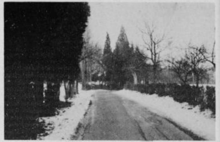
Sprehajalna pot na Hardek je tudi pozimi zelena.

V ormoški okolici kot »ljubiteja in zbiratelj lepotičnega rastlinja menim, da je hortikulturna dediščina Ormož tako bogata, da bi upravičeno Ormož še z nadalj-