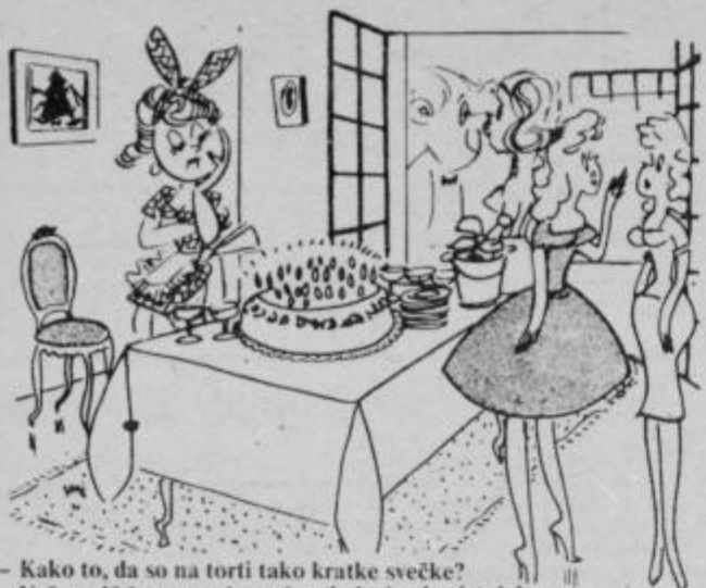
— Kako to, da so na torti tako kratke svečke? — Veš, petič že praznuje svoj petindvajseti rojstni dan.