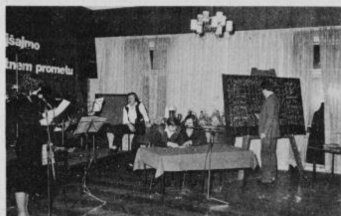
Zmagovalna ekipa iz delovne organizacije Agrotransport Ptuj

V delovnih organizacijah je predhodno Svet za preventivo in vzgojo pri SO Ptuj organiziral predavanja in preverjanje znanja, ki se ga je