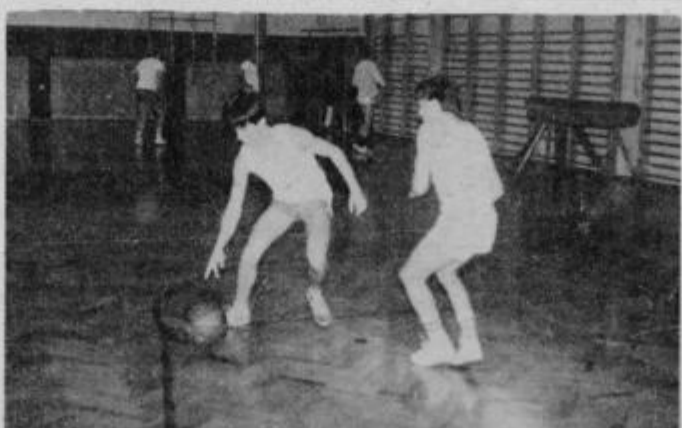
Sedaj košarka in majhno število mladincev, prav gotovo pa bo kmalu postalo bolj množično.

PTUJ: Filipič 8, Erbus, Šeruga, Vučinič, Beranič 19, Bedrač 6, Cobej 12, Gailhofer, M. Kotnik, R. Kotnik 4, Dobrijevič 14, Musič 12. V 13. kolu tekmovanja v območni ligi so člani KK Ptuj v Novem mestu premagali ekipo Straže. V začetku so imeli pobudo domačini, vendar so Ptujčani z nekaj menjavami prevzeli pobudo in si do konca prvega dela priigrali veliko prednost. Dobro so nadaljevali tudi v začetku drugega polčasa. V zadnjih minutah pa so se jim domačini z agresivno igro približali. 35 sekund pred koncem so pri rezultatu 75:74 za Ptuj domačini pripravili napad, Ptujčani pa brez meta žogo zadržali do konca srečanja ter tako dosegli novo zmago na gostovanju. Opaziti pa je, da popustijo v drugem delu, kar bo v bodoče potrebno popraviti. Priložnost je že to soboto, ko se bo ekipa KK Ptuj doma pomerila z Brežicami. Srečanje bo v dvorani Mladika, pričelo pa se bo ob 19,30. Vrstni red po 12. kolu: 1. Dravograd 24, 2. Litija 20, 3. Podbočje 14, 4. Ptuj 12, 5. Pomurje 11, 6. Straža 10, 7. Sentjur 10, 8. Zlatorog 8, 9. Kamnik 7 in 10. Brežice 2 točki. I. Z.