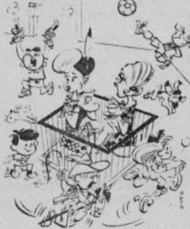
Najbolj sem brez skrbi, da jim pustim kar neval privediti kar doma.