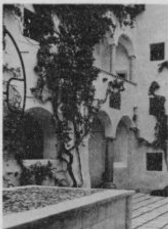
Notranje dvorišče ob koncu vojne porušenega gradu Vurberg

V Ptuj in njegovi okolici je mnogo gradov, dvorcev in graščin, ki opozarjajo nase s svojo mogočno in arhitektonsko skladno gradnjo. Svoječas je bilo takšnih zgradb dosti več. Mnoge so povsem izginile, da za njimi ni drugih sledov kot so arhivski zapiski, vse preveč pa je takšnih, ki vidno propadajo, ker zanje ne najdemo sredstev za vzdrževanje,