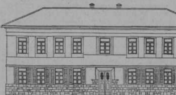
Тип школске зграде са 3 одјелјенија.

Problem šk. zgrada ukazao се у svojoj veličini. Valjalo је početi riješavati то teško pitanje.