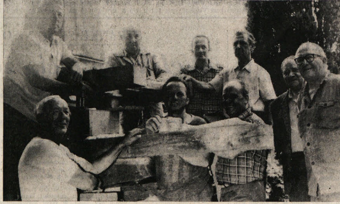
Nasmejani obrazi domačinov ob pomembnem odkritju pred spomenikom dolinskega tabora

Ovoj iz trdega papirja je bil zavit v izvod Edinosti in Slovencev iz oktobra 1878