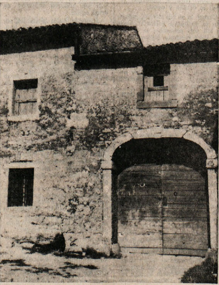
Tipični kraški motivi

Omeniti je treba mednarodno begunsko taborišče in biser taborišče istrskih beguncev, katerega hočejo preurediti v mladinsko poboljševalnico ter zavetišče za gluhoneme.