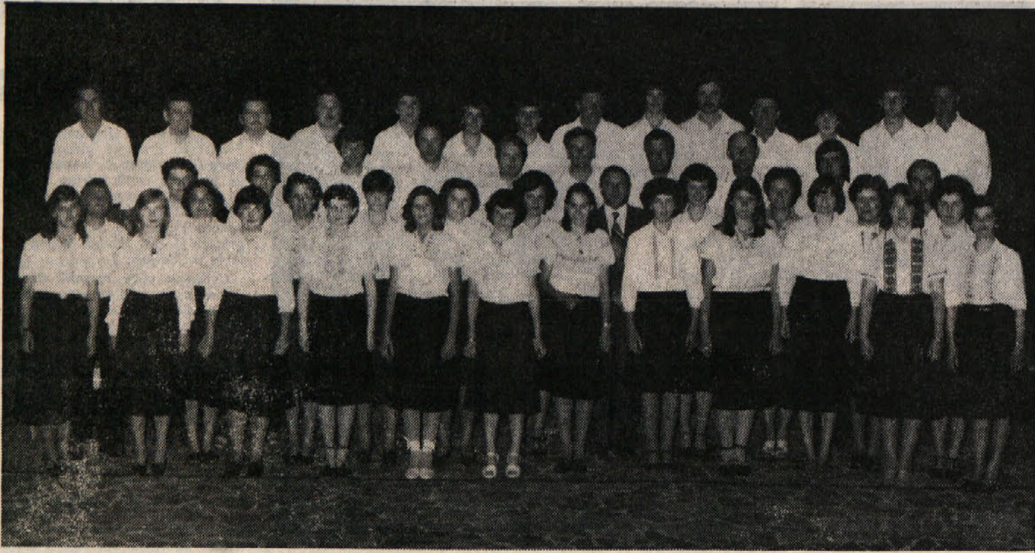
Sedanj, obnovljeni pevski zbor PD «Slovan», ki ga sestavljajo pevci s Padrič in iz Gropade

Padriče ležijo v za Trst zelo pomembnem prostoru in samo s trdim delom in zavestjo ne bo vas postala anonimna. Zelenje, kamniti zidovi, karakteristične hiše postanejo votle sence, če ni ljudi, ki dajo vasi in naravi življenje. Zato je vsak napor, da tu ohranimo z novimi pobudami kulturno bogastvo vasi, dragocen. Nekdanji mir, nekdanje veselice in