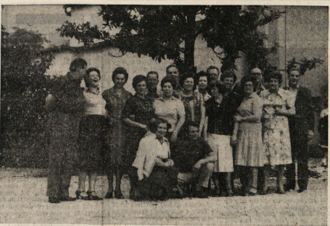
Boljunski pedesetletniki na izletu

1) srečali 2) pozdravil 3) odgovoril 4) pel 5) se začel pogovarjati 6) razložil 7) spomnil 8) sedaj 9) častil 10) veseljem