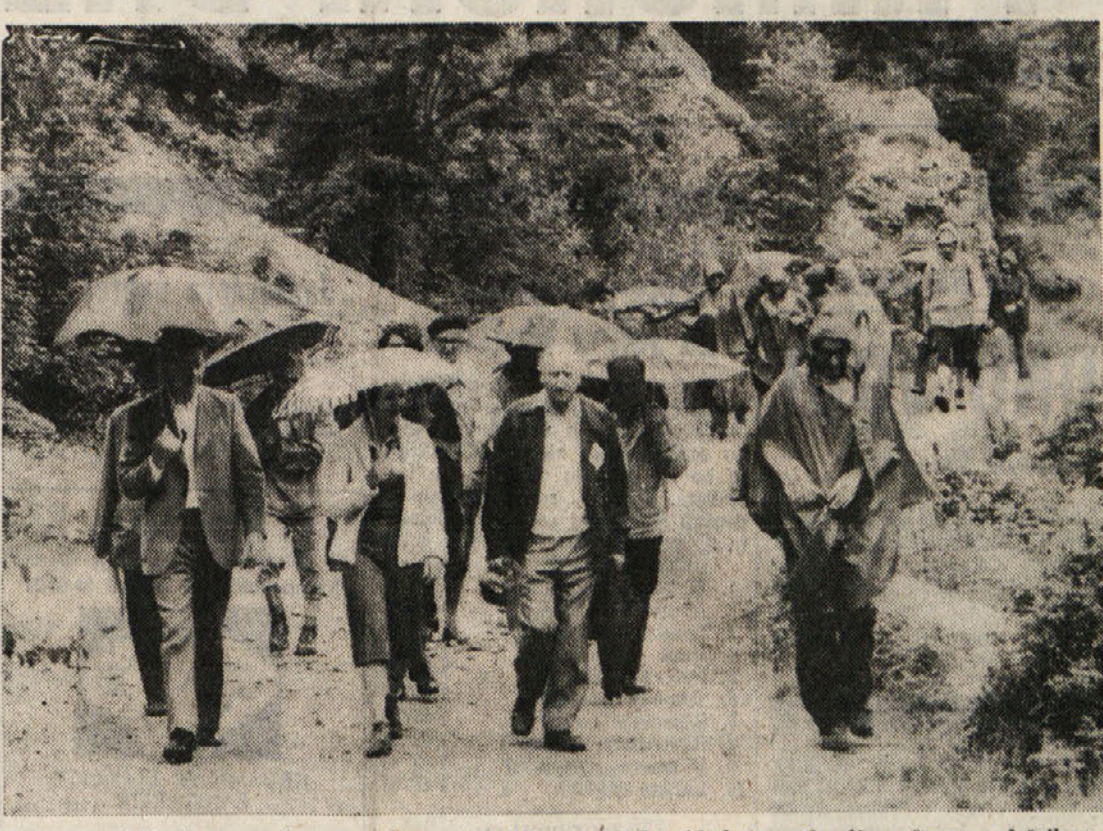
Letošnje poletje je res muhasto, vendar pa je priložnosti za izlete kljub temu dovolj, pa čeprav z dežnikom, kot je bilo na zadnjem planinskem slavlju na Tržaškem na izletu skozi Glinsico