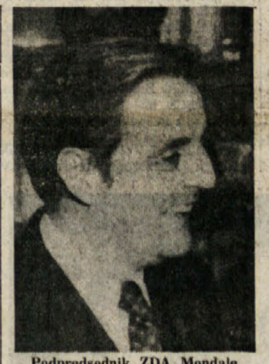
Podpredsednik ZDA Mondale