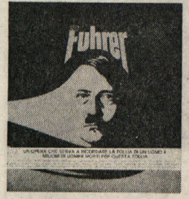
Najbrž je ta plošča tudi sad velikega kreativnega Hitlerjevega mita, ki ga danes doživlja Zahodna Nemčija. Po ogromnem uspehu, ki ga je doživel istoimenski film, je seveda morala zgoditi tudi rock-opera. Rezultati (denarni) bodo prav gotovo pozitivni.

mislimo s to besedo samo na album z določeno tematiko - pripovedjo, potem v redu. Labirintus, torej: ta je doslej malo znana italijanska skupina, sestavljena iz prav tako neznanizvajalcev, ki si je postavila kot temo te opere kontinuiteto oblasti, ki je - kot pravijo - neuničljiva.