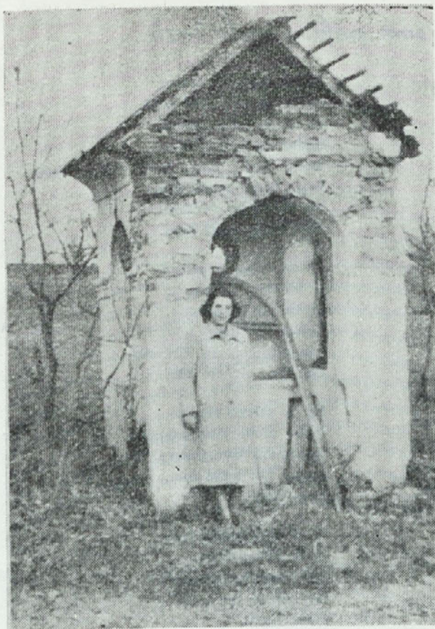
Celo znamenja ob poteh — biseri, vtكاني v naš prt razgrnjen pod Triglavom — so bili ovira rdeči revoluciji