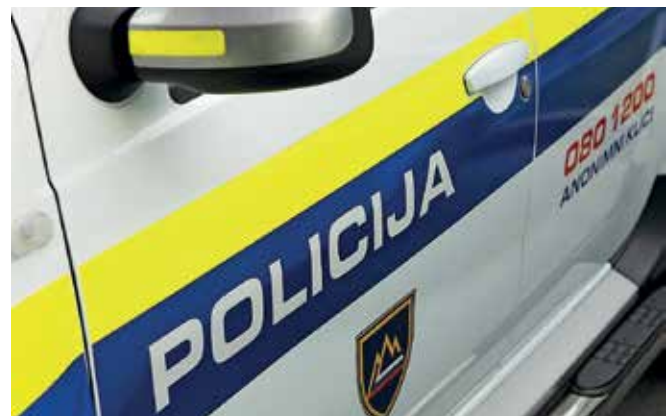
Urban Troha Višji policist I Vodja policijskega okoliša Pivka

Policisti policijske postaje Postojna vam želimo prijeten in varen preostanek poletja.