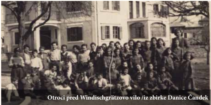
Otroci pred Windischgrätzovo vilo