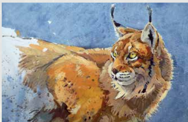
Ilustracija: Andrew Haslen, Artist for Nature Foundation

Bi želel biti redno informiran o projektnih aktivnostih in o risih v Sloveniji? Lahko se vključiš v lokalne posvetovalne skupine. Pošlji nam elektronsko sporočilo na life.lynx.eu@gmail.com .