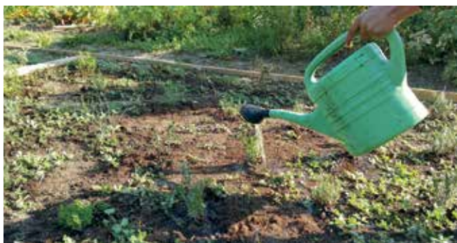
Udeleženci socialne aktivacije pomagajo vzdrževati Čutni park v Postojni.

Helena Bizjak, vodja programa socialne aktivacije