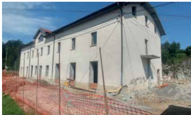
Znamenita Kolodvorska 19 dobiva svojo podobo pod smernicami Zavoda za varstvo kulturne dediščine.