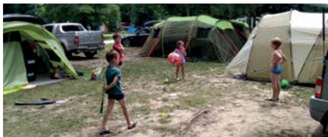
Vaška skupnost Nadanje selo in Vaško društvo Nad'nska lipa

nam je uspelo. Podali smo se v kamp Menina v Savinjski dolini. Ker je v istem terminu v kampu potekal družinski adrenalinski vikend, smo imeli veliko možnosti aktivnega preživljanja prostega časa. Poleg kopanja v hladnem jezeru so se otrokom gotovo najbolj vtisnile v spomin sladke penice in hrenovke, ki so jih zvečer pekli nad žerjavico. Bilo je veliko smeha in dobre volje. Ker smo bili vsi skupaj nad vidnim navdušeni, upamo, da se nam prihodnje leto pridruži še kakšen udeleženec več.