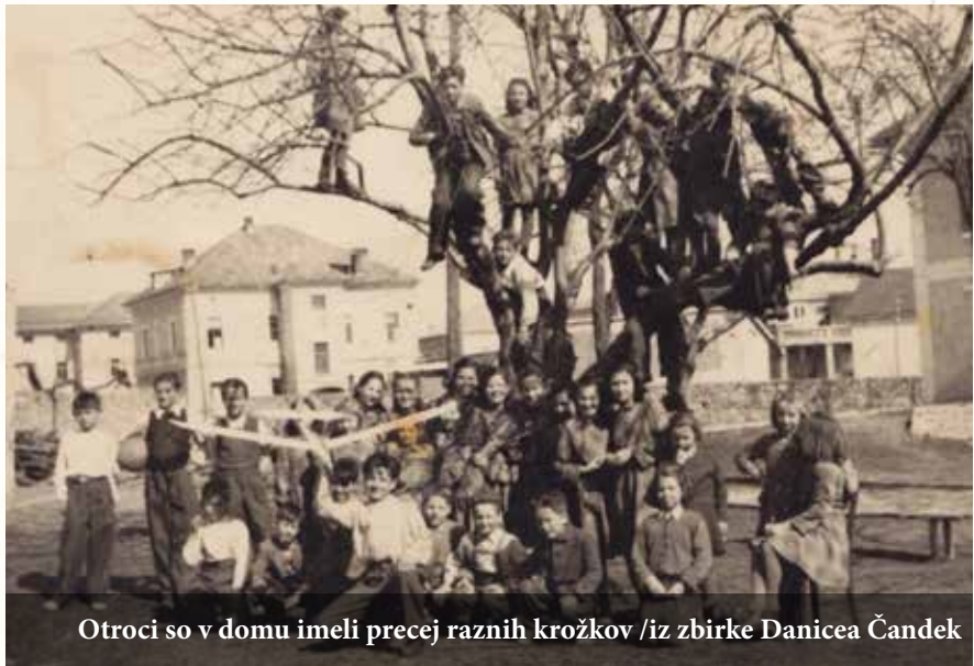
Otroci so v domu imeli precej raznih krožkov