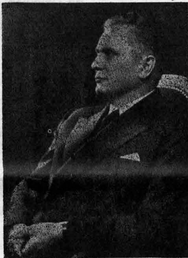
Voditelj jugoslovanskih narodov maršal Josip Broz - Tito

Mnogo velikih slovesnosti je že doživelo glavno mesto naše socialistične domovine po osvoboditvi, mnoge zmage na fronti socialistične graditve je že praznoval Beograd v teh štirih letih. Tako slavnostno okrašen in praznično razpoložen pa še ni bil nikoli kakor na dan volitev v Ljudsko skup-