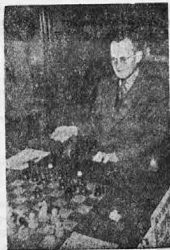
Jugoslovanski šahovski mojster Vasja Pirc

Tako pisanje o zmagovalecu Gligoriću ter tov. Trifunoviću in Pircu, ni samo njim, temveč tudi celi naši naselbini, posebno pa našim narodom v domovini v čast in ponos. To je najboljši dokaz življenja, dela in kulture v novi socialistični Jugoslaviji. Ona vzgaja ljudi, ki se zavedajo svojih dolžnosti, ki znajo premagati vse zapreke življenja samo z delom, resnostjo in vztrajnostjo, ne pa z izživiljanjem in igranjem. Takoj so opazovali v Mar del Plati opazili, da naši šahovski mojstri niso trošili denar v igrah. To je nam v ponos in kot najboljši dokaz, kakšne ljudi vzgaja naša socialistična domovina.