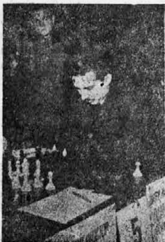
Naš jugoslovanski prvak Svetozar Gligorić