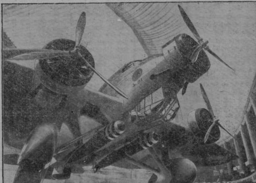
Italijansko bojno letalo s 3000 kilogrami bomb.