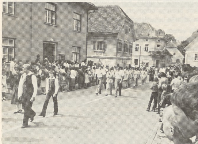
Hortikultura 78 v Mozirju

Celotna prireditev HORTIKULTURA 78 je v Mozirju presegla vsa najbolj optimistična pričakovanja. Savinjski gaj je s svojo idiliko v naravnem okolju privabil že preko 100.000 obiskovalcev, saj si je zaključno prireditev z razstavo cvetja in cvetlično povorko, ki je bila 20. avgusta 1978, ogledalo preko 15.000 ljubiteljev cvetja.