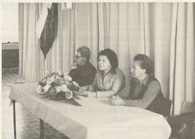
Promleška konferenca naših žen

Tovariša Barboriča je predvsem zanimalo, kaj pravzaprav dela tekstilno industrijo tako nizko akumulativno in kako pravzaprav gospodarimo, da smo uspešni v množici, ki je pravzaprav sinonim v gospodarstvu naše države. Poudaril je, da je rešitev tekstilne industrije predvsem v dohodkovnem povezovanju. Gosti so spraševali o informiranju delavcev o zaključnem računu, če imamo dovolj časa za pripravo podatkov in če so podatki, ki jih bomo posredovali delavcem, dovolj razumljivi (oglasite se, dragi sodelavci, če niste razumeli določenih obrazložitvev) in dostopni našim ljudem.