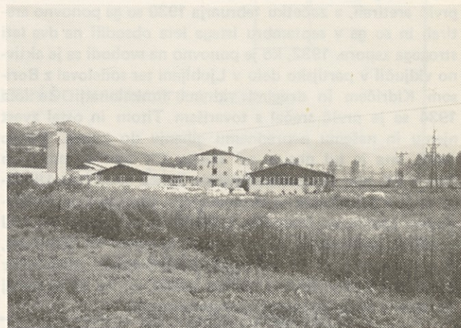
Na desni rastejo novi proizvodni prostori

Prodajna politika bo takšna, da bomo pridobivali še vedno nove kupce in osvajali nova prodajna področja — Kosmet, Makedonijo, Črno goro.