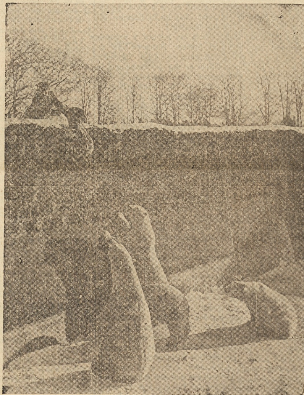
POT V SVOBODO — V živalskem vrtu v Chesterju na Angleškem je voda v bivališču severnih medvedov zamrznila in jim skoro odprla pot v svobodo. Čuvaji so na led vlivali toplo vodo, da se je ta ob kraju stopil in pot v svobodo zaprl.