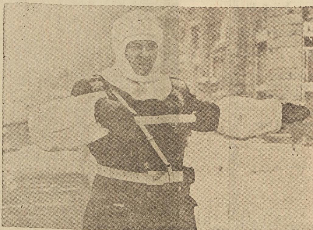
MARSOVEC? — Slika kaže prometnega stražnika sredi Beograda v Jugoslaviji v mrzlih zimskih dneh pri njegovem poslu. Zaradi svojevrstne obleke imenujejo otroci ve stražnike "marsovec".