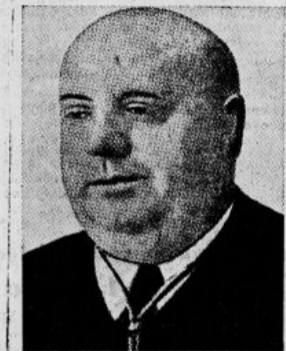
Indalesio Prieto, socialistični vrvak in eden glavnih voditeljev španskega proletariata.

Budimpešta, 20. maja. b. Ob priliki svečanosti se je porušila nenadno tribuna, na kateri je bilo mnogo otrok in gledalcev. Število mrtvih in ranjenih je precej visoko, vendar pa doslej še ni znano. Na porušenem delu tribune je bilo 65 šolskih otrok.