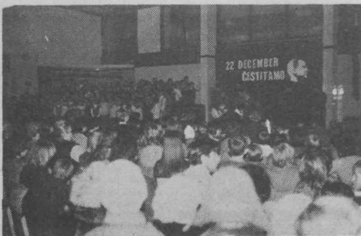
V počastitev dneva JLA je KO ZRVS v avli OŠ Karla Destovnika-Kajuh organizirala za vse občane kulturno prireditev. Enourni program je v nabito polni dvorani navdušil vse prisotne.