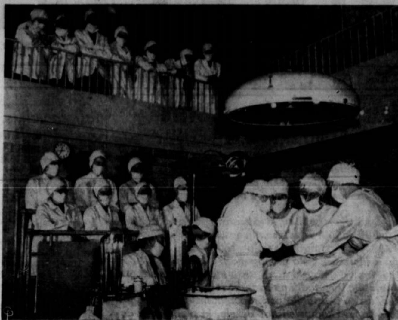
V ZDRAVNIŠKI POKLIC se priglašajo vedno več žensk, kar je dobro, ker one so že po naravi bolj ustvarjane za negovanje bolnikov kakor pa moški. Gornje je slika iz medicinskega kolegija v Philadelphiji, kjer se študentke uče v operiranju bolnikov.

Pa so Japonci udarili v Mandžurijo, komisija društva narodov je japonski prestop ek preiskala in ostalo je pri preiskavi,