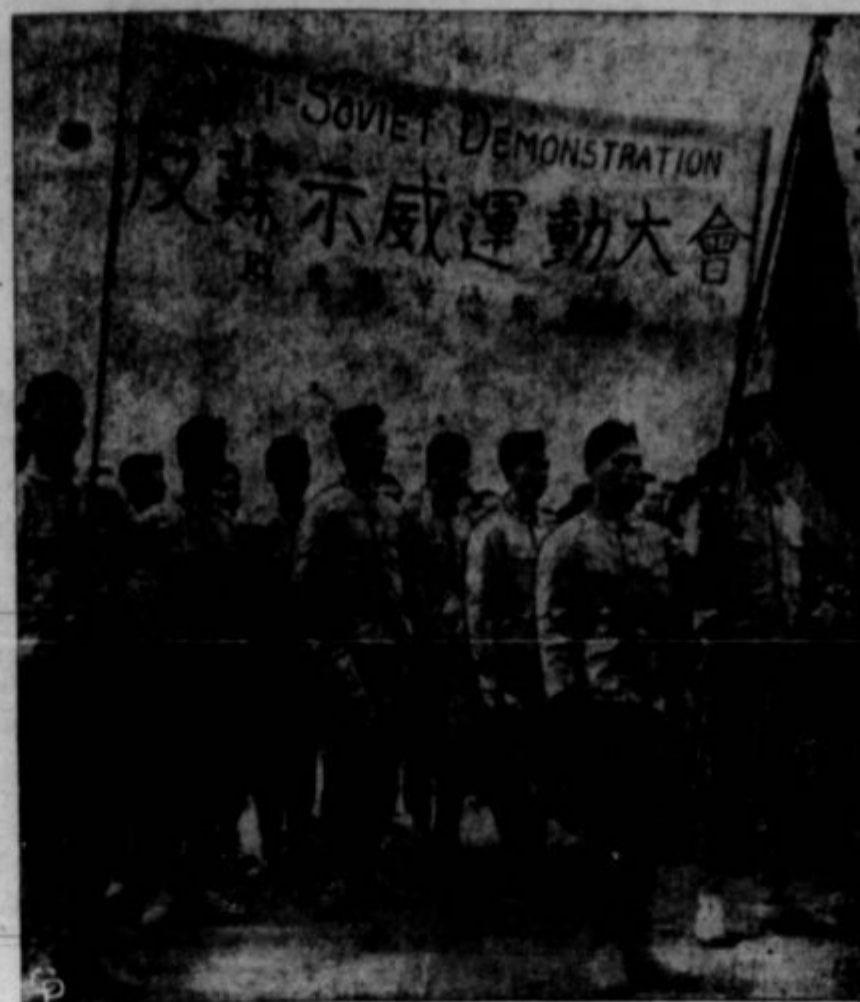
SOVJETSKA PROPAGANDA zna prirejati demonstracije proti kapitalizmu in kapitalističnim vladam kjerkoli, a na ta posej se razumejo tudi njeni nasprotniki. Tako se je v minulih tednih dogodilo mnogo demonstracij proti Rusiji posebno na Kitajskem. Gornje je slika kitajskih študentov—ne na Kitajskem—ampak v Tokiu na Japonskem, ki so zahtevali, da naj se sovjetske čete umaknejo iz Mandžurije.

V čikaških mesnicah primanjkuje zopet mesa. Grem iz ene v drugo, in v tretjo. Vse, kar so imele napredaj, so bile svinjske kosti in bikove možgane. A kje je drugo meso? Kdo uživa najboljše porejje mesnin? Mi gotovo ne in ne od glada umirajoči Evropejci. Deležna pa je teh dobrin vrhnja plast. Ona ima tudi kontrolno nad živilskim trgov, nad klavnicami in nad mesno industrijo v splošnem. Jaz sem sicer zadovoljen tudi z enim funtom bikovih možgan