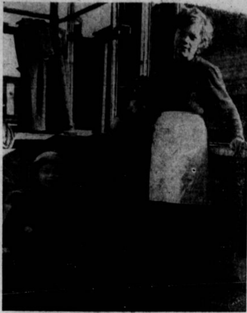
OTROK BREZ STARŠEV IN DOMA je v Evropi nešteto. Gornja slika predstavlja tri izmed njih. Zanje skrbi Ameriški Rdeči križ.