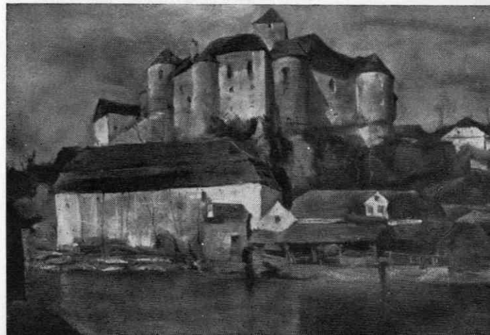
Žužemberški grad, pod njim nekdanji mlin za papir (ok. 1716 — ok. 1870), oz. poznejša usnjarna (B. Jakac, pastel, 1956)

V času, ko je živel Rakovec, to je v glavnem v prvi polovici XVIII. stoletja, so predstavljali na Slovenskem cehi še vedno močno in domala edino proizvajalno silo —