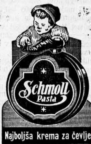
Najboljša krema za čevlje

rico pa v kak kot ali za dvoriščina in vežna vrata ter po vrsti eden za drugim zadostila svoji poltenosti! V Gorici sami ni bil samo eden, nego več slučajev, da so ti italijanski pobje dekleta omamili s kokainom in potem počenjali z njimi največje perverzности. Veliko deklet so našli še drugi dan popolnoma omamljenih od kokaina. Naravno, da pri svoji znani vroči krvi niso štedili s čaščenjem boginje Venere. Marsikateri naš fant