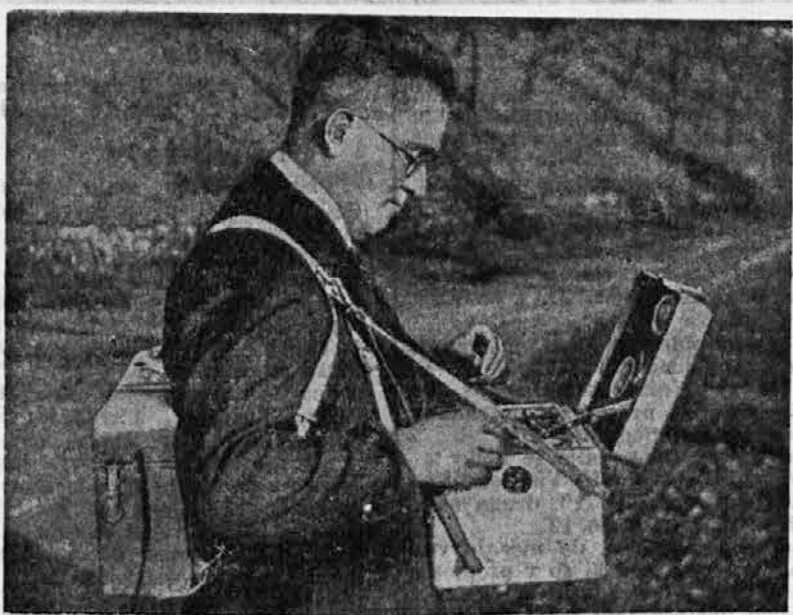
Aparat, ki kaže sestavo zemeljskih plasti, nahajališče rud in podobno.