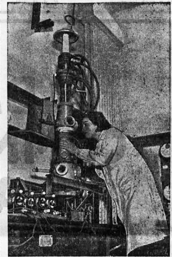
Mikroskop, ki poveča 14.000 krat.

Bejruth, 21. junija. s. Poročila, ki prihajajo iz Kaira pravijo, da so ogromne trope kobilic v dolžini 4 km in v širini enega kilometra napadle pokrajini Ausan in Kena v starem Egiptu. Poljedelski minister je takoj izdal vse potrebne ukrepe, da se kobilice uničijo.