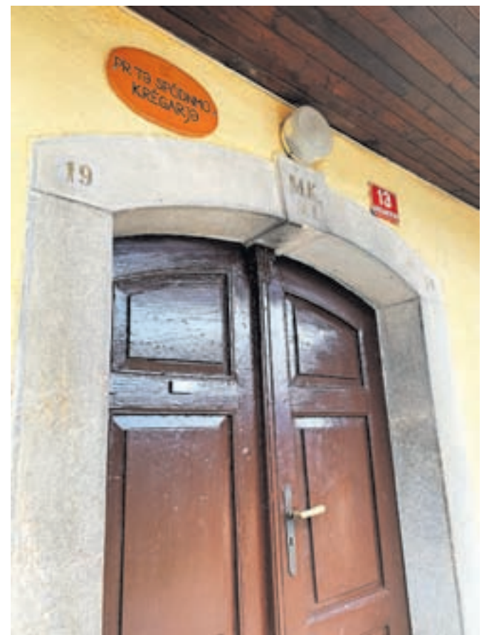
Prvi korak je zajel krajevne skupnosti Tunjice, Kamniška Bistrica, Šmartno v Tuhinju in Motnik.

Lanskoletni projekt je bil med domačini izredno dobro sprejet. Pokazal je, da domačini cenijo stara hišna imena ter so nanje ponosni. Predstavljajo del naše nesnovne kulturne dediščine in prav je, da se ohranijo in