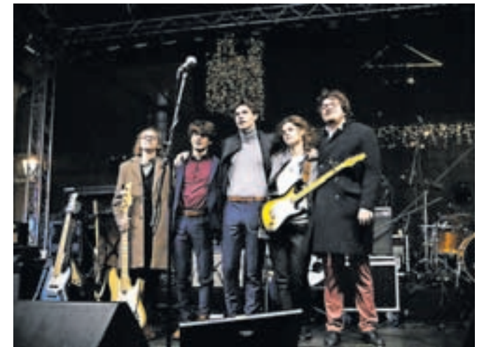
Za glasbeno poslastico je na predzadnji dan leta poskrbela tudi skupina LPS.