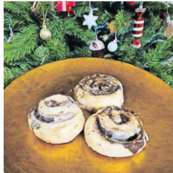
Cimetove rolice z drožmi

Tudi o imenu svojega podjetja sta razmišljala kar nekaj časa, potem sta združila v njem ljubezen do peke in nastalo je ime Love2bake. Zakaj zamrznjene, nas je zanimalo; in zakaj sploh rolice, je bilo naše naslednje vprašanje. »Oba izjemno rada kuhava, eksperimentirava v kuhinji, predvsem pa so nama všeč bogati okusi,« pripoveduje Pibernikova. Ko sta odkrila droži, so te hitro dobile glavno mesto v njuni kuhinji in čisto iz lastnih potreb sta iznašla način, kako si ta zapleteni postopek olajšati. Zamrzovalnik je postal