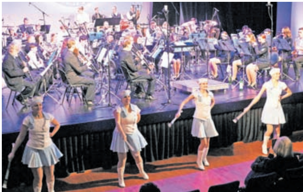
Kot gostje so nastopile kamniške mažoretke.