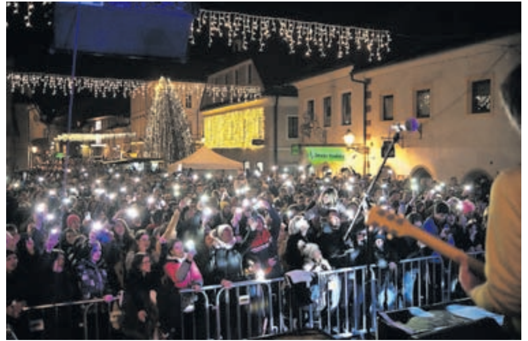
Zadnji četrtek v letu 2022 je Kamnik utripal s skupino Big Foot Mama.

Na Zavodu za turizem in šport Kamnik so zadovoljni, da so lahko ponovno organi-