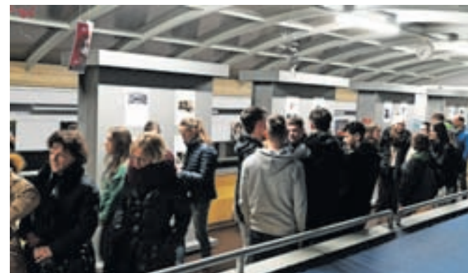
Razstava ponuja niz portretov Slovenk, ki premikajo meje mogočega osem tisoč metrov visoko in še višje.