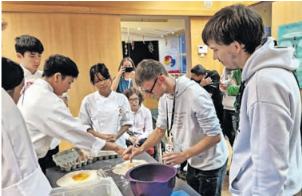
Udeleženci so pripravljali testenine pod mentorstvom italijanskih dijakov.

Kamnik – Partnerske ustanove so Ammattiopisto Luovi (Finska), Gureak (Španija), Live (Finska), Learningdigital (Italija), Atempo (Avstrija). Večinoma so to šole za dijake s posebnimi potrebami, podobno kot CIRIUS Kamnik. Projekt je za nas pomemben zlasti zato, ker v njem aktivno sodelujejo tudi dijaki. Pripravljamo digitalna gradiva, ki bodo učiteljem in dijakom služila za pripravo na izmenjave. Uporabljali pa jih bodo lahko tudi tisti, ki se iz različnih razlogov izmenjav ne morejo udeležiti. Prvi izdelek je interaktivna računalniška igra Seppo, ki so jo razvili na Finskem. Omogočala bo medkulturno spoznavanje na zanimiv način, ki je mladim blizu. Sledi gradivo za urjenje življenjskih in jezikovnih veščin v obliki slovarja, gradivo za pisanje digitalnega dnevnika mobilnosti in priložnik za učitelje. Prvo srečanje je potekalo marca v Helsinkih na Finskem, drugo pa junija v San Sebastianu v Španiji. V času od 22. do 24. novembra 2022 smo v CIRIUS Kamnik gostili 28 dijakov in njihovih učiteljev iz štirih partnerskih držav, in sicer iz Finske, Španije, Avstrije in Italije. To je bilo že tretje srečanje v okviru projekta.