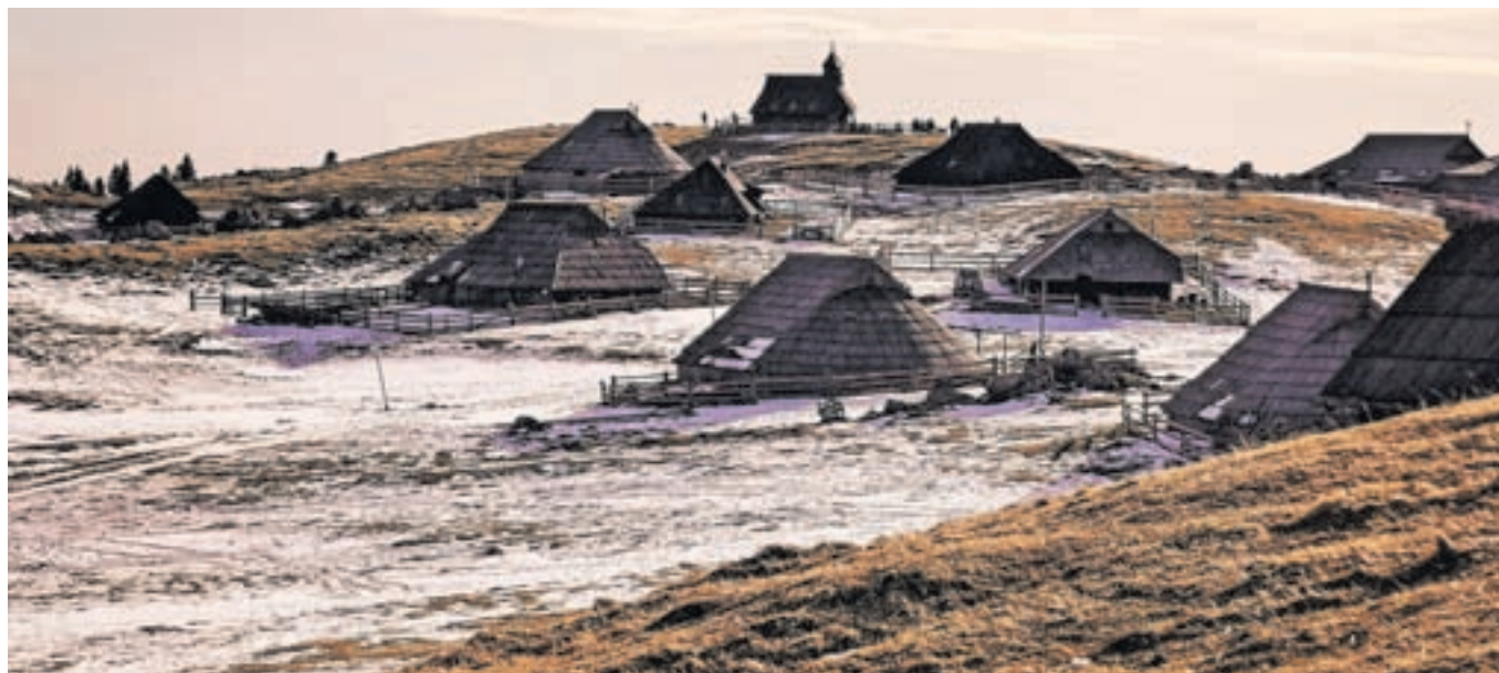
Na Veliki Planini so trenutno le zaplate snega.

obratovanjem smučišča povezani tudi višji stroški (energenti, elektrika, večje število zaposlenih, več obratovalnih ur) in se tako kot tudi na drugih smučiščih zimska sezona sama od sebe