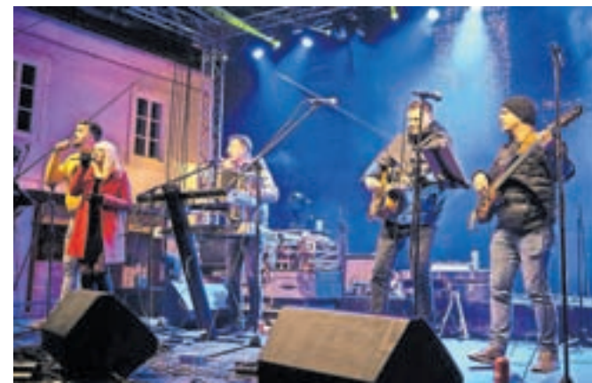
Ob vstopu v novo leto je zbrane na Glavnem trgu zabaval Ansambel Viharnik.

za tem je Kamnik utripal s skupino Big Foot Mama. Kamniški mladi rokerji Before Time so zadnji četrtek v letu 2022 razgrela množico. »Zgodil se je nepozaben glasbeni večer, ki ga bo Kamnik še dolgo pomnil,« so dejali na zavodu. Za glasbeno poslastico sta na predzadnji dan leta poskrbeli skupi-