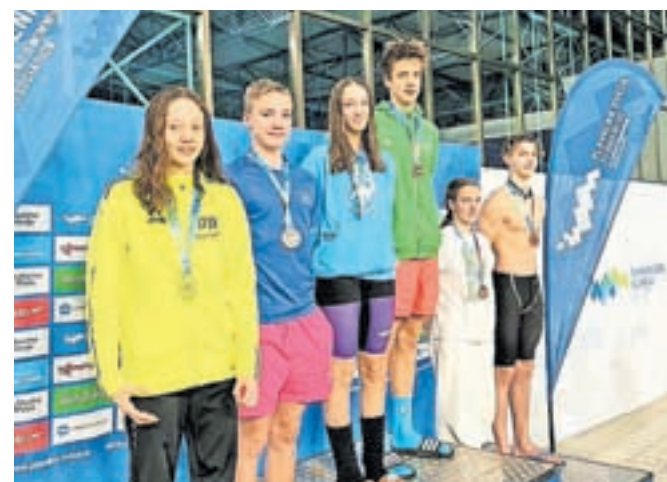
V posameznih kategorijah so kamniški plavalci osvojili več naslovov.