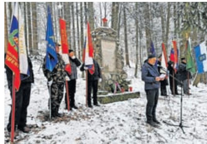
Spominska komemoracija na Kostavski planini

vedno uspelo ohraniti, ter da smo dolžni poskrbeti, »da bomo še naprej živeli v mirni, zdravi, napredni družbi, kjer vlada demokracija, kjer je solidarnost vrednota, kjer spoštujemo drug drugega in živimo dostojno v deželi z neokrnjeno naravo«. Druga decembrska slovesnost je potekala po božiču pri spomeniku na Prevojah v Zgornjem Tuhinju. S polaganjem cvetja so se spomnili 192 padlih, med katerimi so bili tudi vodja ameriške