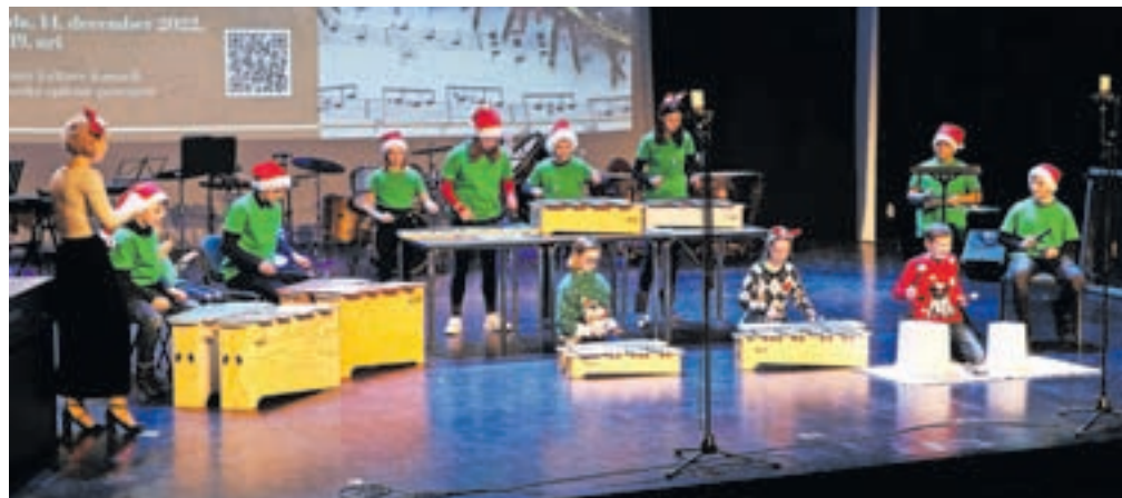
Orffov orkester