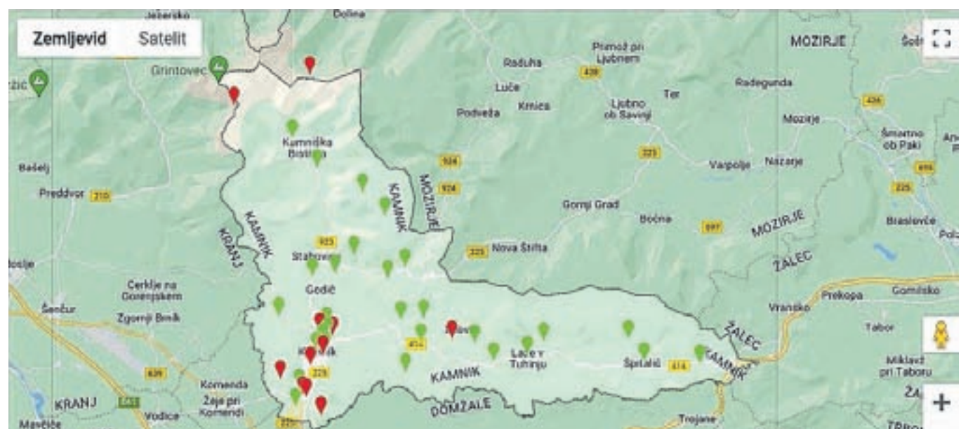
Lokacije defibrilatorjev v občini Kamnik

posredovala Dispečerski službi zdravstva, kjer pojasnjujejo, da bodo lokacije naprav AED ob sprejemu klica s potrebo po nujni medicinski pomoči, kjer se večkrat srečajo tudi z dajanjem navodil za oživljanje, olajšale njihovo delo.