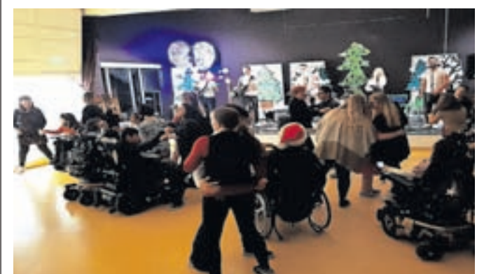
Ples ob živi glasbi