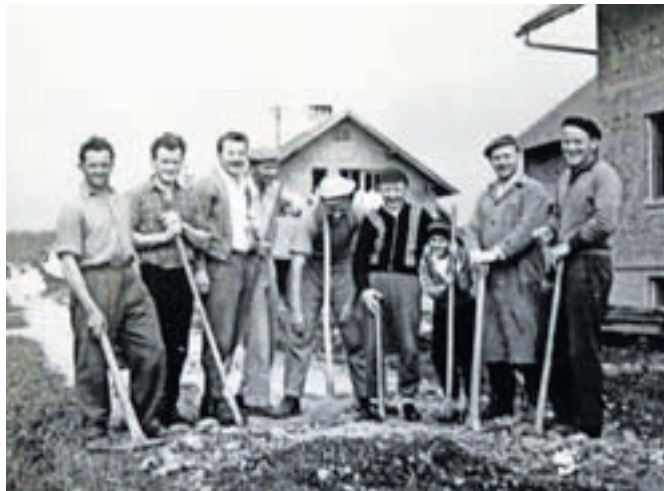
Med gradnjo ...

V ulici še vedno živi pet čilih začetnikov in kar štirje med njimi so že dosegli častljivo devetdesetletnico. Njihovi potomci so kljub asfaltni cesti in ograjam okrog hiš še vedno povezani. Utrip ulice se nadaljuje tudi v novem času, a na drugačne načine kot takrat.