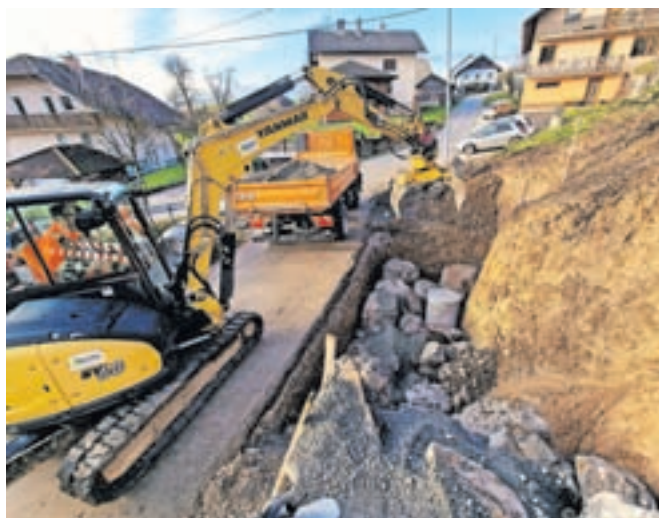
Sanacija plazu na Županjih Njivah

Že ob koncu minulega leta pa se je zaključila sanacija zidu ob Tunjiški cesti v Košihah, v okviru rednega vzdrževanja občinskih cest je tudi to sanacijo izvedlo Komunalno podjetje Kamnik.