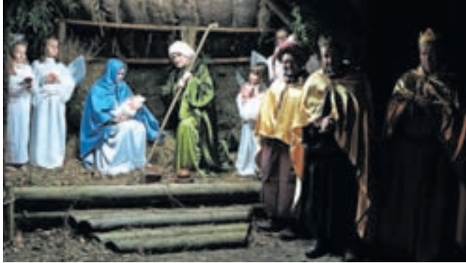
Nazadnje sta Marija in Jožef dobila zavetje v hlevčku.