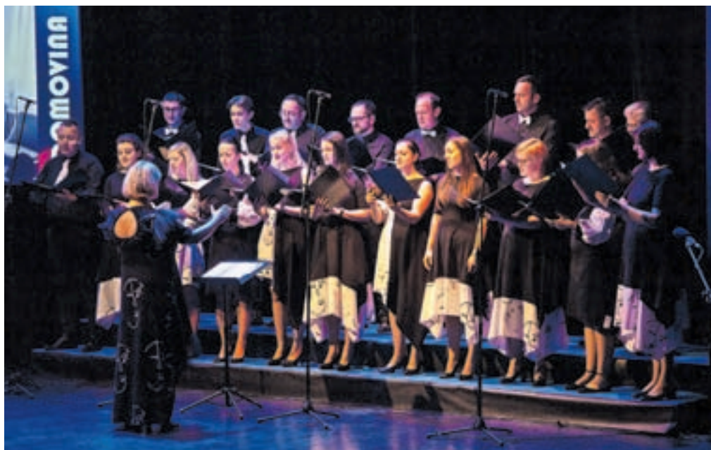
Kulturni del prireditve je popestril tudi Mešani pevski zbor Odmev Kamnik.