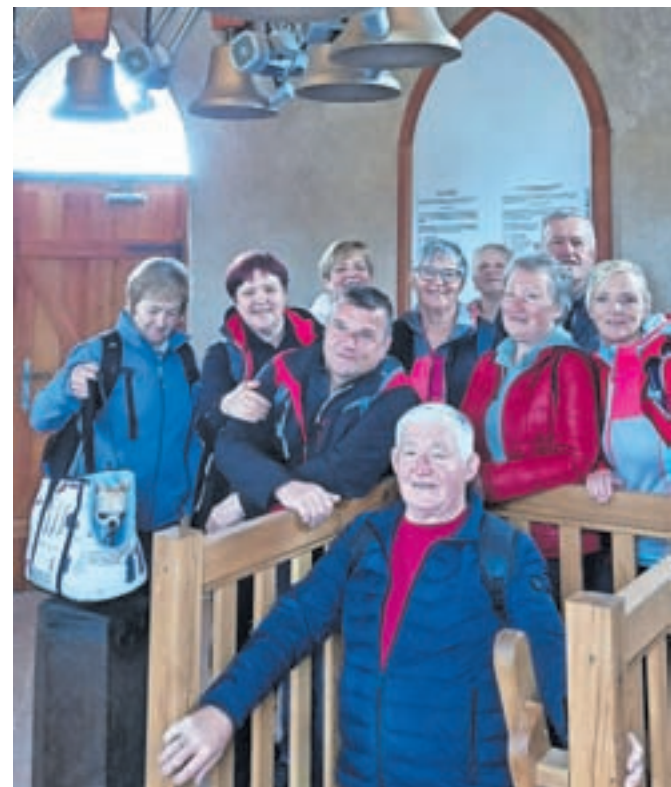
Ob obisku zvonika v Kranju

Oktober smo obiskali Idrijo, ki je znana po živem srebru, čipkah in idrijskih žlikrofih. Slišali smo zgodbe o najdbi živega srebra, pred Antonovim rovom smo si ogledali maketo, kako razvejani so bili rudniški rovi, obiskali topilnico živega srebra, kjer smo izvedeli veliko zanimivosti o živem srebru in nje-