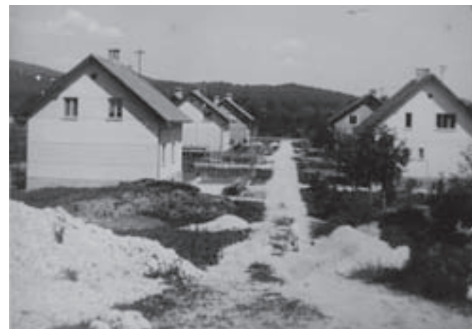
Takole je bila videti Prvomajska ulica med nastajanjem.