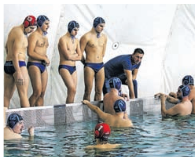
V prvi tekmi so kamniški vaterpolisti v Kranju igrali neodločeno z Ljubljano Slovanom.

»Prišli smo do pomembne točke, ki bo v boju za uvrstitev v končno državnega