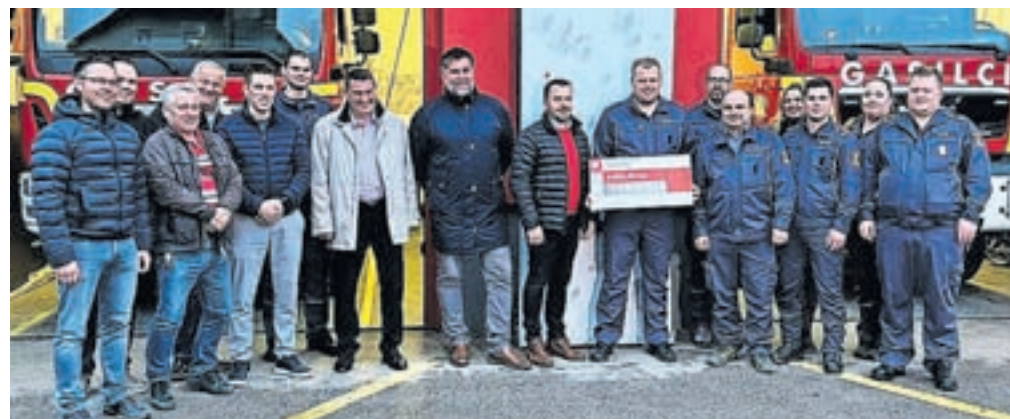
Zavarovalnica Triglav je z donacijo podprla gasilce PGD Kamniška Bistrica.

Zavarovalnica Triglav je v sklopu letošnje preventivne akcije Za boljši jutri ob