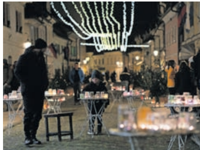
V Kamniku so pripravili ognjeno zgodbo z naslovom Vrnimo Šutni luč.

V januarju zavod ne pripravlja nobenega dodatnega dogodka, obiskovalce pa še vedno vabijo na dršališče, ki bo postavljeno vse do konca zimskih počitnic.