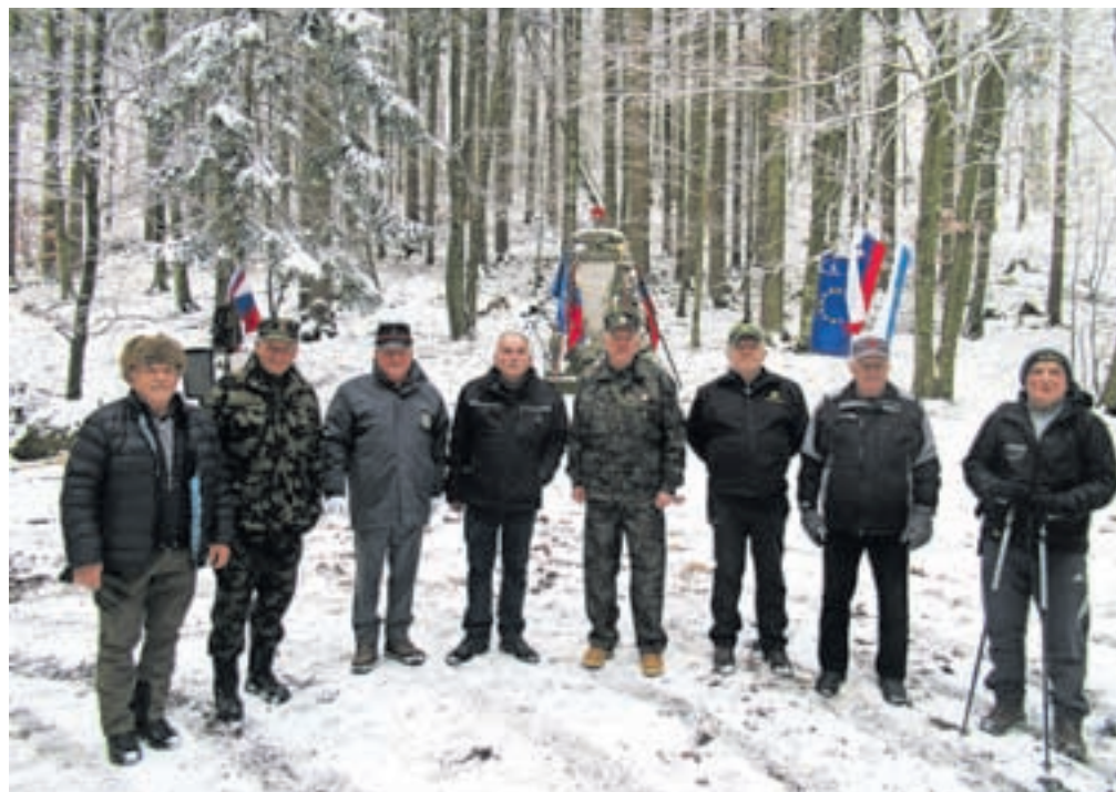
Člani OZSČ Kamnik - Komenda na Kostavski planini