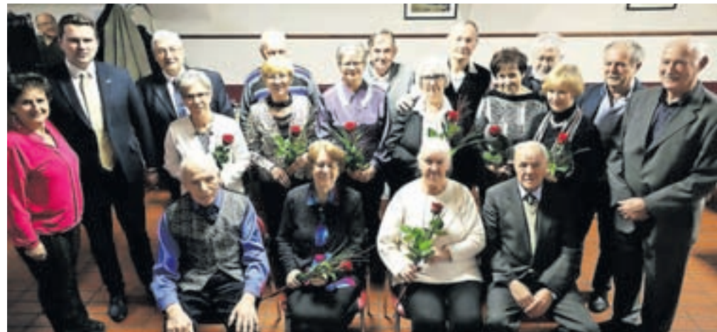
Zakoncem, ki so v preteklih dveh letih praznovali petdeset in šestdeset let zakonskega življenja

šestdeset let, podelili priznanja in cvetje. Ker v decembru leta 2021 razmere niso dopuščale podelitve, so se na Društvu upokojencev Kamnik odločili, da združijo