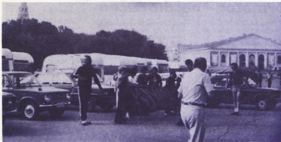
Naši zagrebški „kamperji“ z Adria caravani na enem izmed moskovskih trgov – na cilju so, olimpijske igre se začinjajo ...