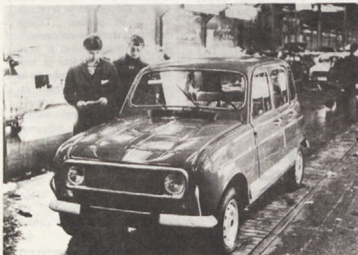
Udarniško, vendar zato nič manj kvalitetno. Kontrola kvalitete v tovarni avtomobilov je bila neizprosna – kot običajno.