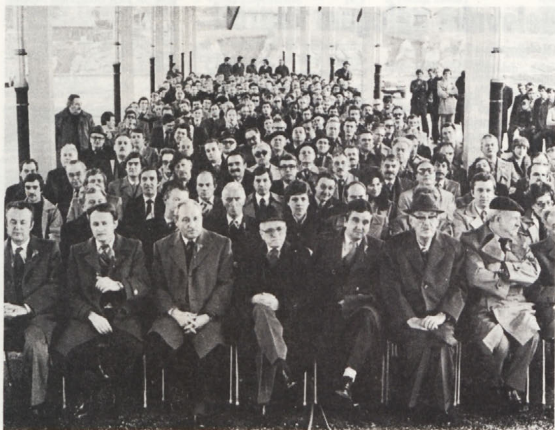
Med častnimi gosti so bili najodgovornejši družbeni delavci, ljudje, ki so sodelovali pri ustanavljanju IMV, inozemski ter domači poslovni partnerji in še mnogi drugi.