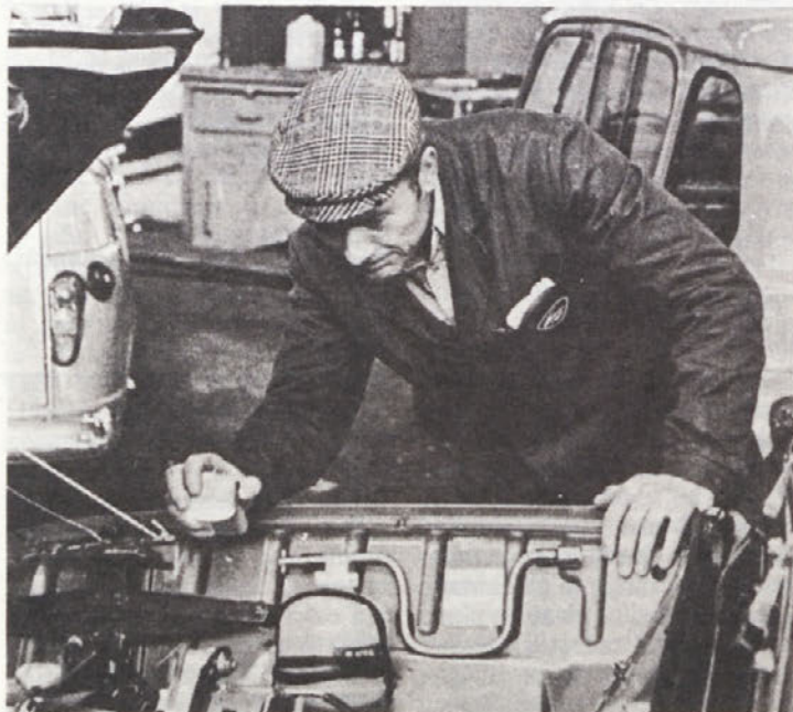
Dodelano vozilo mora prestatati vse mogoče preizkuse tehnične in vizualne kvalitete.

Takšni so naši ljudje, Velikokrat se morda tega niti ne zavedamo.