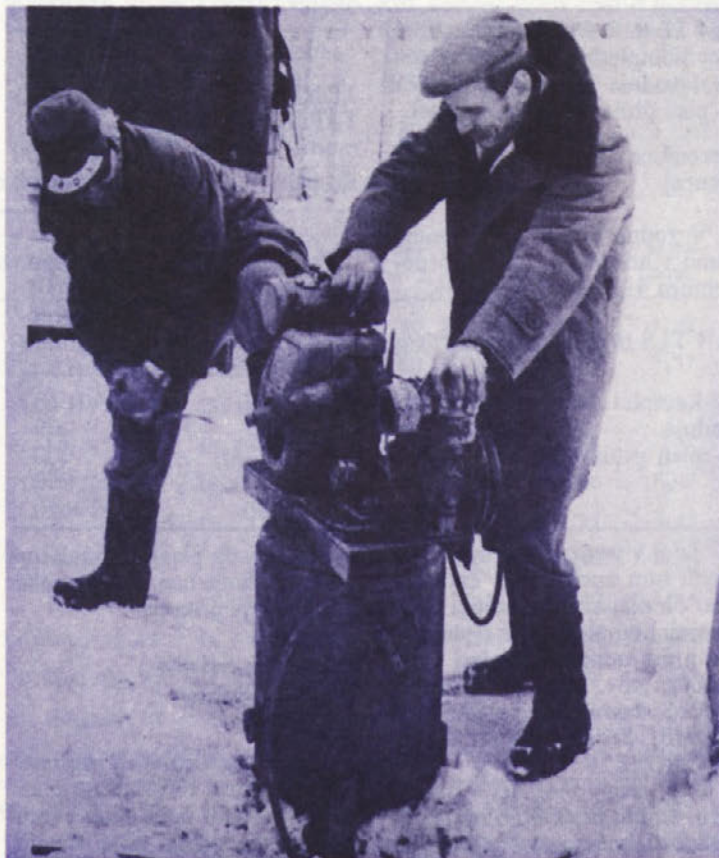
Tehnika je imela pravico odpovedati ubogljivost, česar si ljudje niso smeli privoščiti: „Bo ‚zalaufal?‘“ – „Brez skrbi!“ smo dobili zagotovilo.