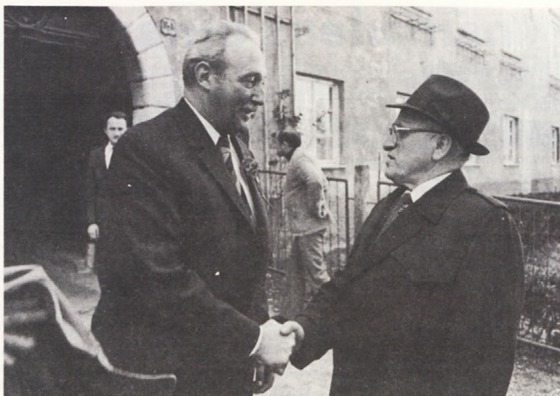
Čvrst stisk roke in pristrčna zahvala enemu najbolj zaslužnih za razvoj IMV. Predsednik predsedstva SR Slovenije, tovariš Viktor Avbelj, je bil in ostal aktiven spremljevalec razvoja našega kolektiva od časov „Agroservisa“ do danes.

pa mora zagotoviti redno oskrbo in usklajeno proizvodnjo. Skladen razvoj vseh nas bo prav gotovo dal svoj pomembni delež k skladnejšemu razvoju slovenskega gospodarstva v naslednjem 5-letnem obdobju.