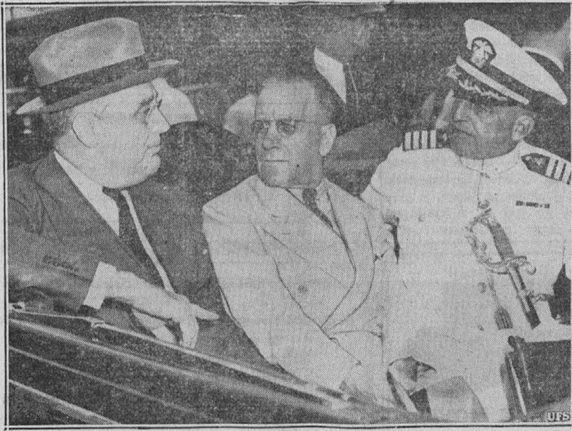
Velika množica ljudi se je zbrala v Miami, Fla., da je pozdravila predsednika Roosevelta na potu iz vlaka do križarke, ki ga bo ponesla na otok Culebra, katerega so Zed. države dobile v zakup od Anglije.

Nocoj, prav nocoj sem se spomnil tebe, o stara mati. Vidim te kako sediš ob topli peči, rožni venec imaš med prsti in tvoje drobne ustnice šepečejo molitev, trese se ti uvela brada, žare žive oči, mežikajo, kakor lučice v jaslicah, sredi mahu.