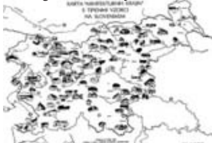
Slika 4: Eden od poskusov znanstveno objektivnega ovrednotenja značilnosti in pomena ljudske arhitekture v slovenskem prostoru (Analiza razpoznavnih značilnih stavbnih skupin kot izhodišče za prepoznavanje identitete arhitekturnih krajin in regij, Fister et al., raziskovalni projekt, Ljubljana 1993) je dokazal izjemno pestrost in kvaliteto preprostega stavbarstva kot nosilca prostorske identitete. One of the attempts at scientific objective evaluation of characteristics and significance of vernacular architecture in Slovene space proved the exceptional variety and quality of simple building culture as the carrier of spatial identity. (Analysis of distinct, characteristic building groups as the starting point for recognising the identity of architectural landscapes and regions, Fister et al., research project, Ljubljana, 1993)

Tako se je na primer uveljavila ugotovitev, da je na Slovenskem le 9 temeljnih tipov podeželskega stavbarstva (5), kar le v rahlo dopolnjeni obliki za mnoge velja še danes. Že površen pregled pa pove, da so bili ti tipi določeni na osnovi predhodno izbranih "primernih" stavb, največkrat nastalih v 19. stoletju in v začetku 20. stoletja še ohranjenih bolj zaradi revščine kot zaradi svoje kvalitete. "Tipične" prekmurske lesene cimprače krite s slamo so bile že takrat le še redke izjeme, saj so že pol stoletja prej zamenjali večino kritine z opečno in lesene stene zaradi požarnih predpisov ometali ali zamenjali z opečnimi - danes jih ni več. V primorski regiji naj bi bila na primer "poglavitna značilnost kamin, močno uveljavljen v vnanji podobi hiše" [Melik, 1936] - dejansko pa so bile stavbe z izzidano kaminsko kuhinjo (spanjenico) v tem prostoru le kvalitetne likovne izjeme in ne pravilo. Takih primerov je še nekaj, rezultati te vrste raziskav so imeli pomembne posledice in so preprečevali, da bi objektivno ocenili vrednosti tudi mnogih drugih bolj ali manj lokalno ali regionalno določljivih identitetnih posebnosti.