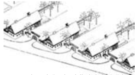
Slika 2: Vzorec prevrednotenja "nacionalnih simbolov": Takoj po 2. vojni izdan odlok o oblikovanju kmečkih stavb na slovenskem podeželju ne glede na pokrajinsko pripadnost (Nasveti za gradnjo kmečkih domov, Ljubljana, 1945) je uporabil tipologijo iz časov dokazovanja slovenske samobitnosti s preloma med 19. in 20. stoletjem. The pattern of re-evaluating "national symbols": Immediately after World War 2 an Ordinance about the design of farmhouses in the Slovene countryside was passed. It paid absolutely no regard to provincial setting and used the typology from the turn of the 19. and 20. century, when Slovene originality was being proved. (Suggestions for building farmhouses, Ljubljana, 1945)

Extreme simplification and exploitation of national symbols was always the characteristic of ideological evaluation of "vernacular architecture" - Slovene identity was most often seen by others as the poor farm-labourers "cottage". Within the framework of Yugoslav characteristics, the small cottage from Bohinj was the representative Slovene vernacular architecture. (Kojić, Belgrade, 1973)