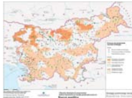
Slika 5: Predlog urejanja prostora v Strategiji razvoja RS, utemeljen predvsem z objektivnim ovrednotenjem pomena in vloge arhitekturne dediščine, v kateri predstavlja najštevilnejši del prav identitetno pomembno anonimno stavbarstvo podeželja. (MOPE 2003/04) The rationale of the proposal for spatial management in the Strategy of spatial development of Slovenia is above all objective evaluation of the significance and role of architectural heritage, in which the most numerous part contributing heavily to identity, is precisely the anonymous building culture of the countryside. (MOPE 2003/04)

Zasnovan je poseben arhiv (Korpus slovenske arhitekture), v katerem je do danes zbranih preko 5.000 dokumentov o naseljih,