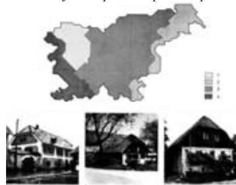
Slika 3: Romantično poenostavljanje značilnosti in pomena podeželske arhitekture v Sloveniji je predstavitev v "Drugem skupnem poročilu o zgodovinskih središčih - Alpe-Jadran". (Ljubljana 1994) Romantic simplification of characteristics and significance of countryside architecture is the presentation in the "Second Joint Report on Historical Centres - Alpe-Adria" (Ljubljana, 1994)

Da bi preseglili tako zožene cilje, so si nekateri raziskovalci skušali pomagati z novo vrednostjo. Za podeželski prostor (ki je po prvi svetovni vojni že pridobil pravico predstavljati tudi