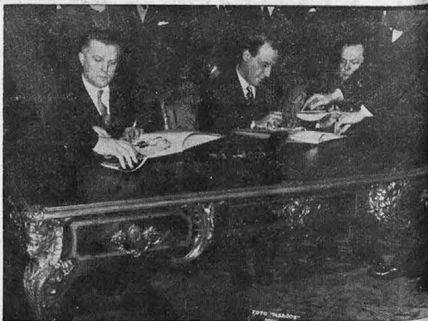
Minister gen. major F. Pirc in Minister J. A. Bramuglia ko podpisujeta dodatni plačilni sporazum trgovske pogodbe

V podpisani dodatni pogodbi se določa način plačevanja vseh zadev, ki