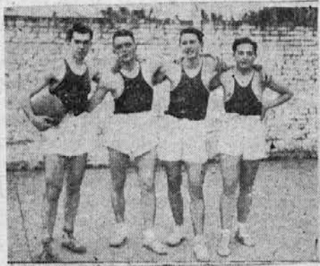
Naši mladeniči, ki so se odlikovali v zadnjem tekmovanju basket-balla

"Mi brigadirji", je dejal, "ki smo gradili pionirsko progo, smo danes ponosni na delo naših rok. Kakor so jurisali brigadirji minerskih brigad v Vranduku s svojimi kompresorji, gra-