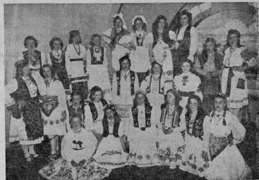
Tudi v Rosariu so svečano praznovali kraljev rojstni dan. — Na sliki vidimo skupino žensk v naših narodnih nošah

Na grobu ne dehti cipresa, ne zimzelen ne rožmarin,