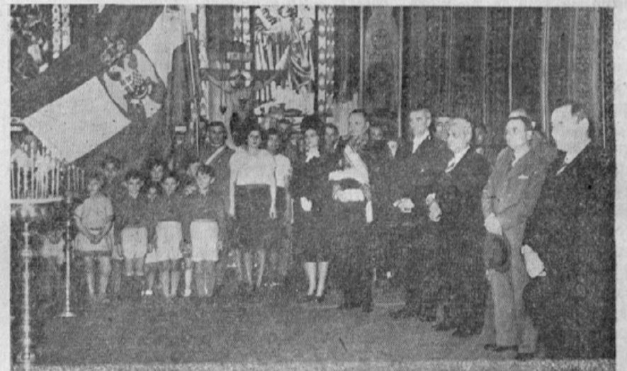
Svečano bogosluženje v pravoslavni cerkvi