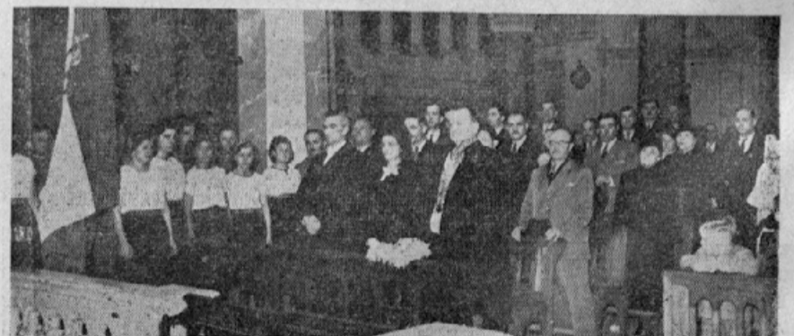
Slavnostna maša v katoliški cerkvi sv. Roze