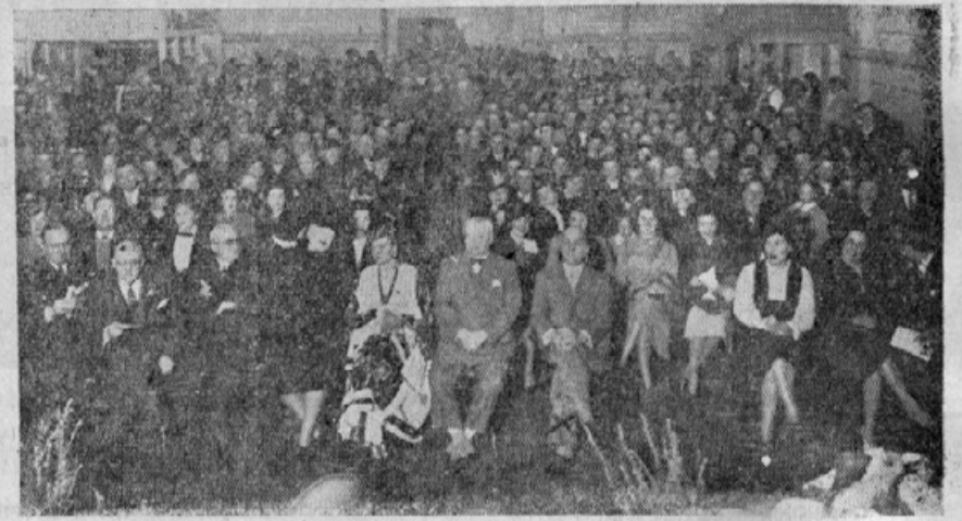
Udeleženci proslave v Rosariu

G. minister je končal svoj govor v našem jeziku ter rekel: