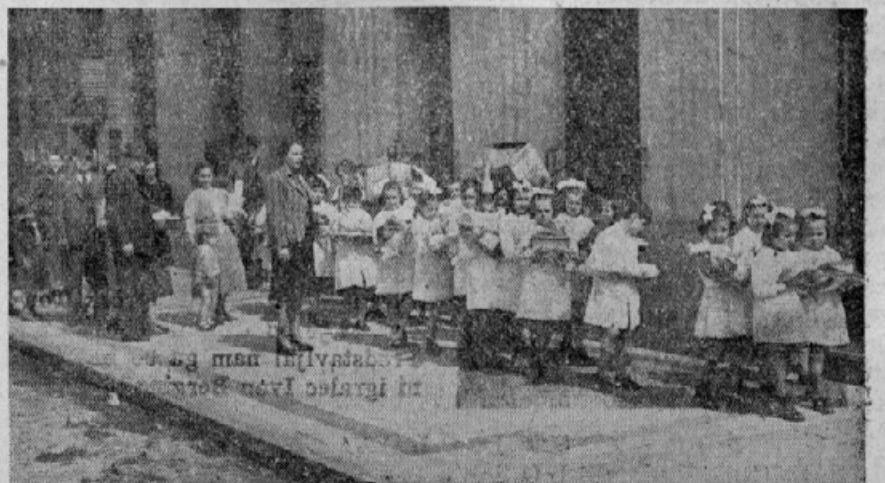
Šolski otroci z darili odhajajo iz šole domov

jo, šalico, žlico! Laufschrift!"). Potem so jih odgnali v vrstah po štiri in štiri v meljsko vojašnico. Prej pa so jim pobrali še vse ključce. Kmalu nato so prišli delavci in so začeli samostan predelovati za nemške namene. Patri, ki so jih Nemci pustili v sobicah pred porto, so glede prehrane popolnoma odvisni od dobrotnikov. Sadizem nemških organov je šel tako daleč, da so zaprli celo samostansko stranišče, tako da se morajo patri posluževati javnega stranišča na ulici.