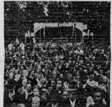
8 tabora Kmečke zveze v Kranju so mladi fantje in dekleta pred tisoč in tisočglavo množico pred našimi razne kmečke običaje.

Kmečki tabor v Kranju je klub nestalnemu vremenu, ki je gotovo oplašilo precej ljudi, izborni uspel.