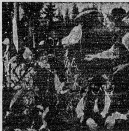
8 tabora Kmečke zveze v Kranju so mladi fantje in dekleta pred tisoč in tisočglavo množico pred našimi razne kmečke običaje.