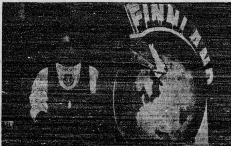
S prve mednarodne mlekarne razstave v Berlinu: Finsko deklo ob velikanskem kosu finskega sira.

s Eno leto po državnem udaru. V avgustu 1936 je grška vlada preko noči razveljavila ustavo, razpustila parlament, razglasila obsedno stanje nad vso Grško in uvedla diktaturo. Kralj je po daljšem razgovoru z ministrskim predsednikom vse te ukrepe odobril. Vojaštvo se je v celoti pridružilo vladi, tudi večina meščanstva, dočim so se delavci nekoliko upirali novemu stanju. V Solunu, Atenah in v nekaterih drugih industrijskih krajih je prišlo do precejšnjih neredov. Grška vlada je razglasila,