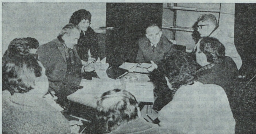
Podpisovanje pogodb. Slika je bila posneta na sejmju Centroproma v Beogradu

Pri izdelavi operativnih planov smo imeli težave, ker so bili prodajni plani višji od potreb, ki so bile v letnem planu, na začetku leta pa je bilo tudi premalo delavcev za