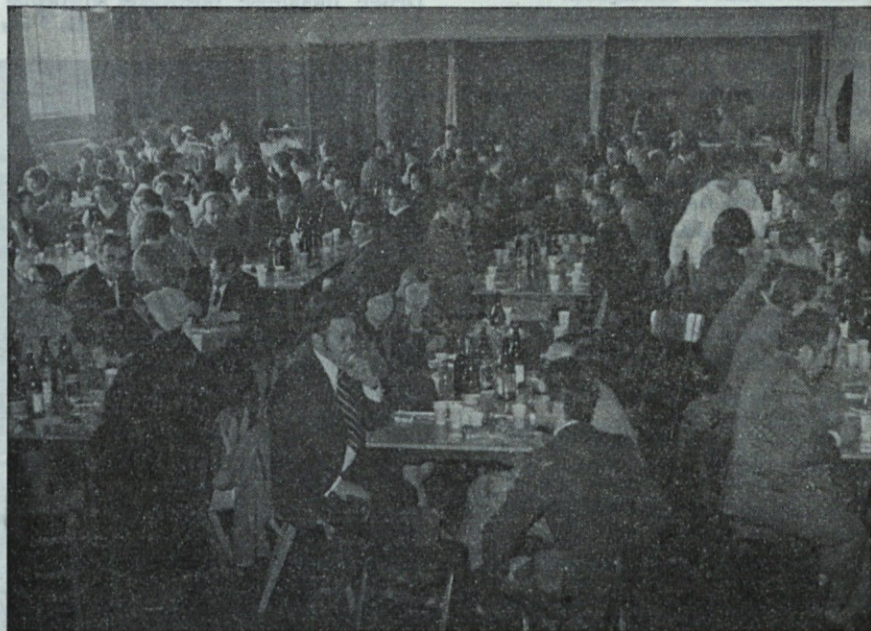
Na obnem zboru OOS Tosame, je po »uradnem programu« med udeleženci zbora zavladalo živahno razpoloženje, ki se je zavleklo do poznega večera