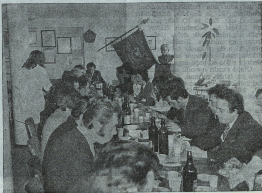
Z letnega občnega zbora industrijskega gasilskega društva Tosame