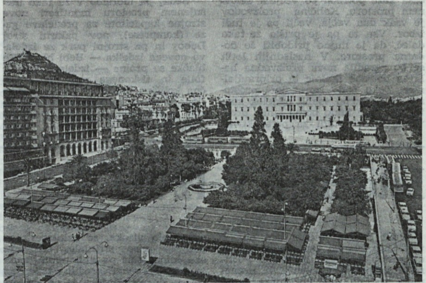
Atene — zibelka demokracije — tu je zbrana vsa gospodarska moč Grčije