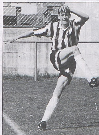
Predvsem na njegovo moč v defenzivi upa trener Polanz na tekmi proti Leibnitzu – E. Pleschgatternig.

Leibnitz - Pliberk (v soboto ob 17. uri)