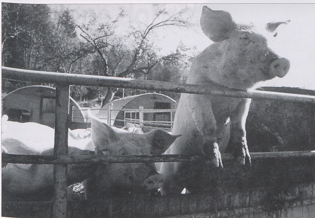
Tik po pristopu Avstrije k EU je še zelo slabo kazalo za avstrijsko prašičerejo. V teku časa pa je cena le začela rasti. Danes imajo prašiči in pujski zelo dobro ceno, ki se bo verjetno še zvišala.