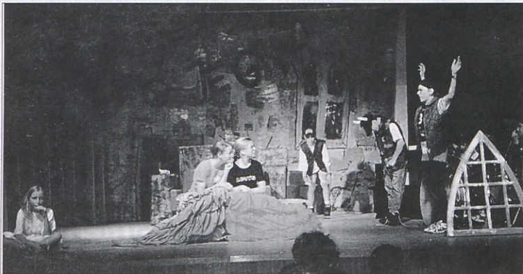
Fantje iz Žvabeka so kraljevim hčerkam všeč.

je treba za uspelo krstno predstavo iskreno čestitati. Pred krstno predstavo pa je nastopil še otroški