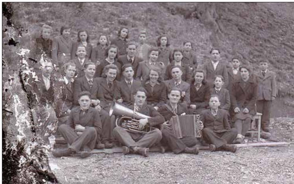
Mladina iz Potoka, Osojnika in Davče v Potoku leta 1946.

Fotograf Šturm je ob izdelavi fotografij iz steklenih plošč ugotavljal, da so posnetki strokovno zelo kakovostni, dobro ohranjeni in lepi ter da se ponekod pozna svojevrstno, a uspešno "retuširanje" posnetkov. Očitno je znal iskati kakovostne in ustrezne osvetlitve fotografskih objektov.