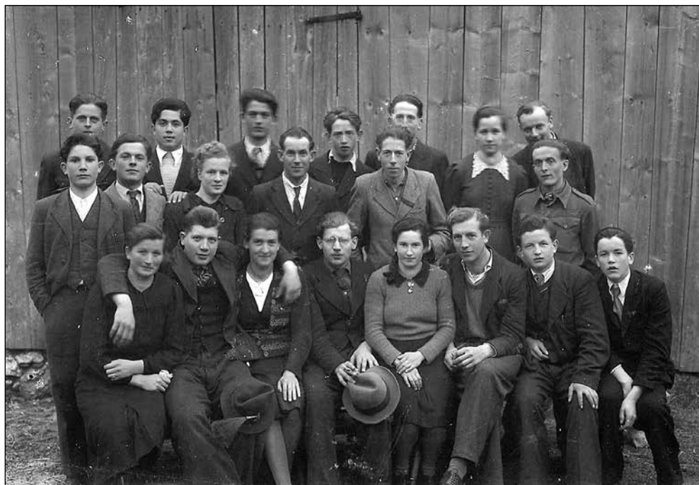
Dekleta in fantje iz Spodnjih Danj za Markljcam leta 1946.