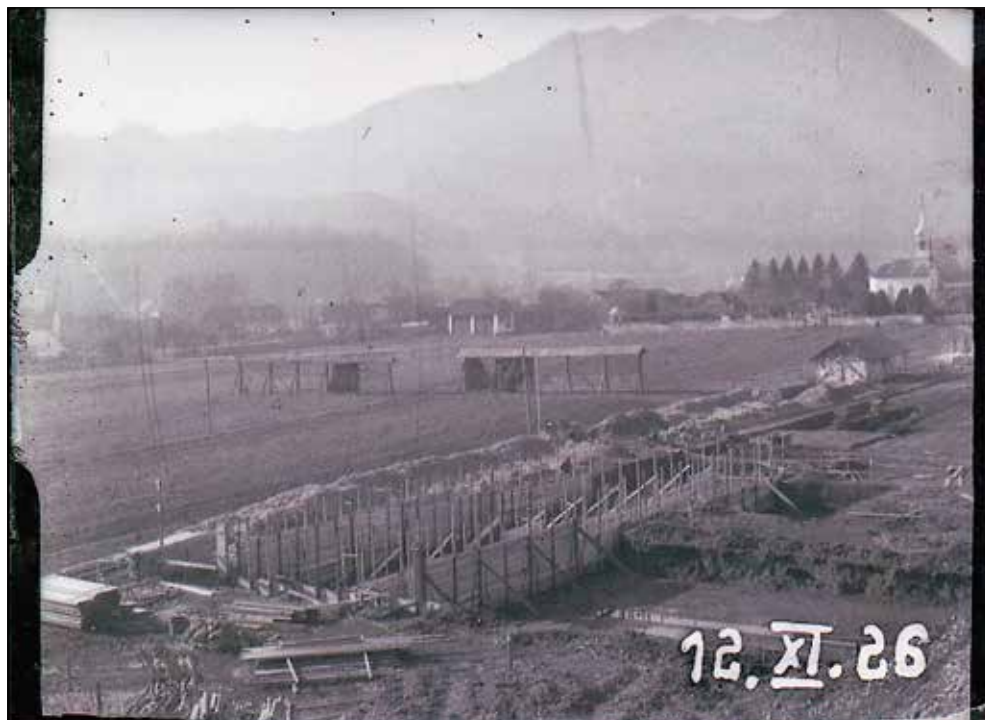
Gradnja vojašnice v Škofji Loki na Osterfeldu v letih 1926–1928.

Z dovoljenjem Loškega muzeja v Škofji Loki in ob pomoči kustosinje ge. Ristič sem dvakrat pregledal vse fotografske plošče, ker je z negativov včasih težko prepoznati njihovo vsebino. Seveda sem marsikje prvokrat samo približno ugotavljal, kaj naj bi bilo na posamezni plošči. Samo na nekaj ploščah piše, da je lokacija posnetka v Škofji Loki, in na eni je kot čas posnetka gradnje vojašnice v Škofji Loki navedeno "leto 1926". Sprva niti pomislil nisem na neskladje, da je bil Kalan rojen 1914, med posnetki pa je verjetno najstarejši posnetek gradnje Burdy-