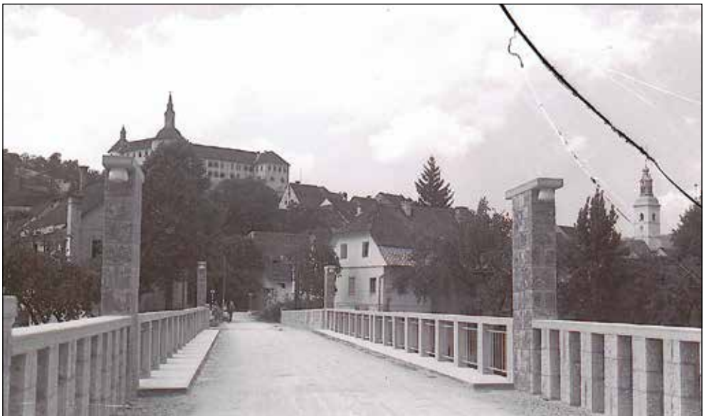
Puštski most, zgrajen leta 1938, je porušila umikajoča se jugoslovanska vojska na veliki četrtek, 10. aprila 1941.