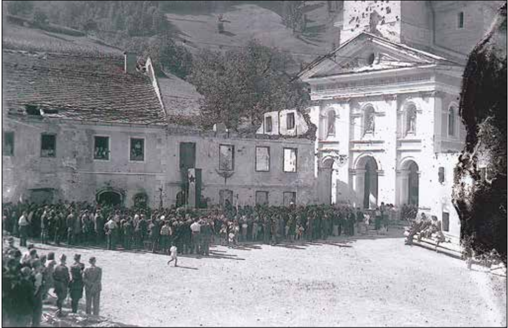
Miting v porušenih Železnikih leta 1945.

revolucionarno pobitih Mlinarjevih v isti vasi ter častne straže ob prekopih padlih na raznih krajih na domače pokopališče v Selcih po drugi svetovni vojni. Tudi po vojni je ostal še nekaj let glavni fotograf za celo Selško dolino. Več je fotografij miličnikov v