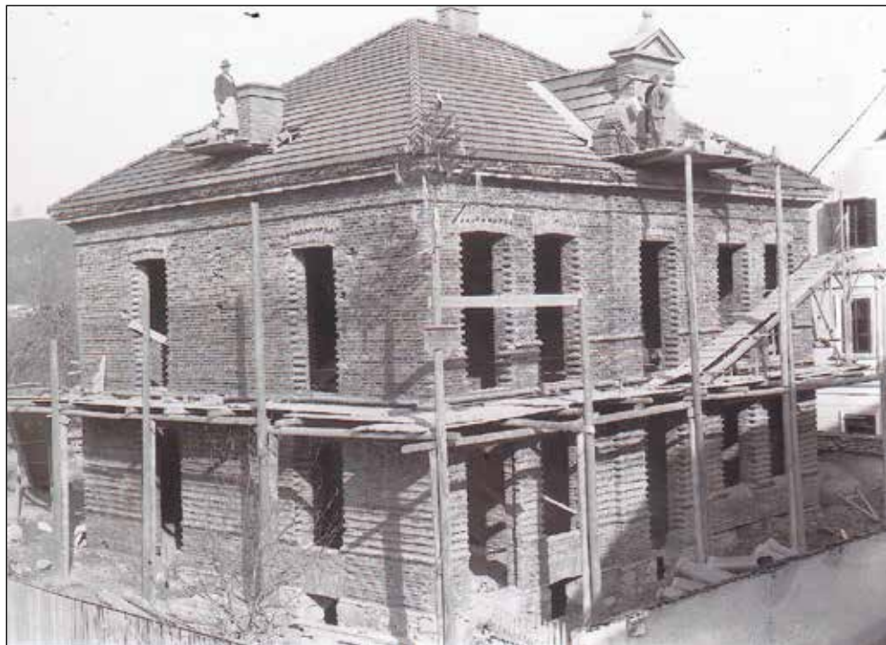
Gradnja Burdychove lekarne v Škofji Loki v letih 1902–1904.

Posnete plošče v velikosti 9,5 x 14,5 cm razen nekaj manjših je Loški muzej po pridobitvi dal strokovno očistiti Muzeju novejše zgodovine v Ljubljani. Tako so zelo dobro ohranjene in posnetki čisti. 16 Vsaka plošča je sedaj v posebni zaporedno oštevilčeni papirnati vrečki. Fotograf Šturm v Škofji Loki mi je z dovoljenjem Loškega muzeja iz teh plošč napravil nekaj več kot dvesto fotografij predvojnih društev, raznih tečajev, porušenega centra Železnikov na koncu druge svetovne vojne, družin in skupin fantov ter deklet. Posebej je očitno, da je Kalana zanimala tehnika. Kar več posnetkov je o gradnji mostov, saj je kar nekaj posnetkov o neidentificiranih gradnjah čez vodo, v Škofji Loki pa kar o vseh mostovih. Nekateri objekti so ostali ohranjeni samo na njegovih posnetkih. Verjetno je tako posnetek Puštalskega mostu, ki je bil zgrajen leta 1938 in že čez dobri dve leti uničen od umikajoče se jugoslovanske vojske na veliki četrtak, 10. aprila 1941, edini. Večje je število fotografij Kapucinskega mostu in pogledov na grad nad Škofjo