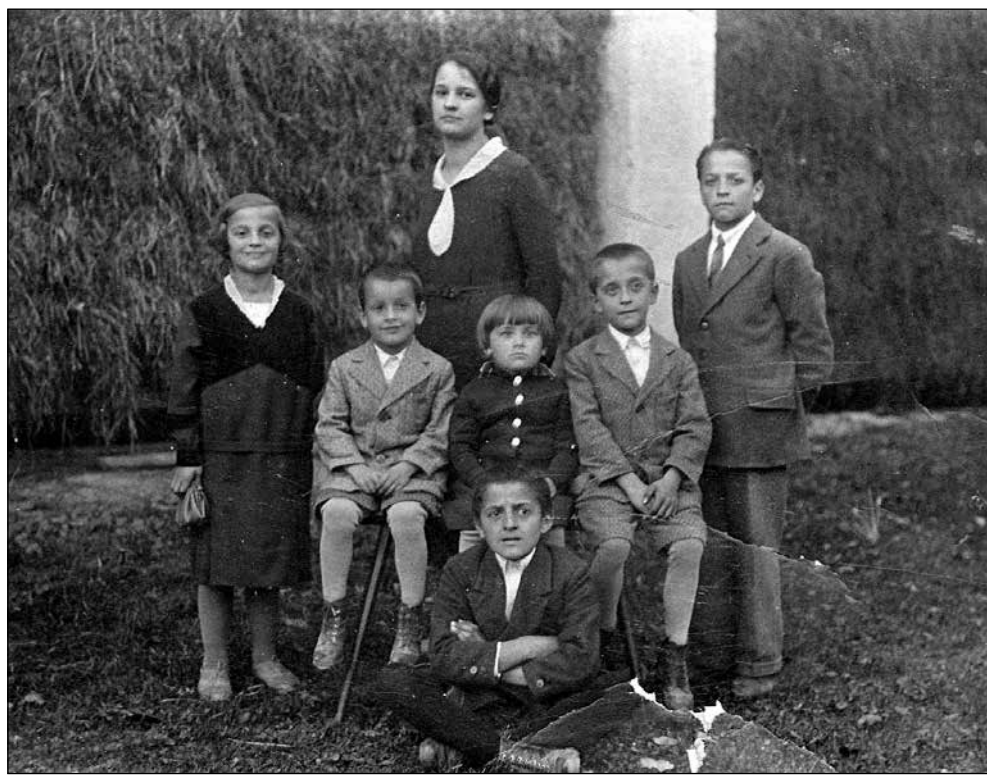
Lukcova družina ob Jeralovem kozolcu na Studenem.