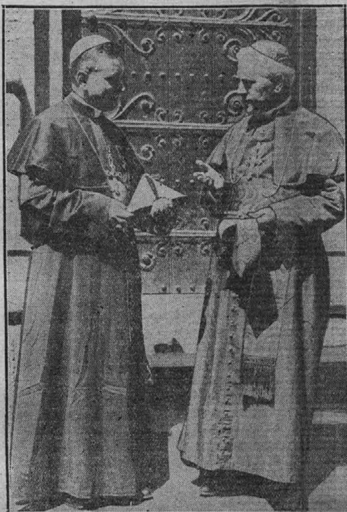
Na levi na sliki se vidi Most. Rev. Amleto G. Cocognani, katerega je imenoval Vatikan novim apostolskim delegatom za Zed. države. Slika je bila vzeta, ko je delegata sprejel kardinal Hayes v New Yorku v svojem stanovanju kmalu po njegovem prihodu v Ameriko.