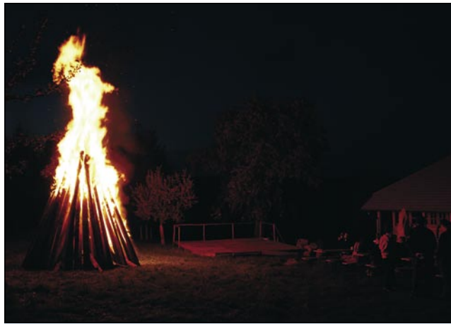
Plameni so trno visiko segali

malo dela. Na velko soboto predpodnevom smo se s traktorom vozili po gauščaj pa smo iskali sūje bore, dapa nej male, liki tak kuste, ka