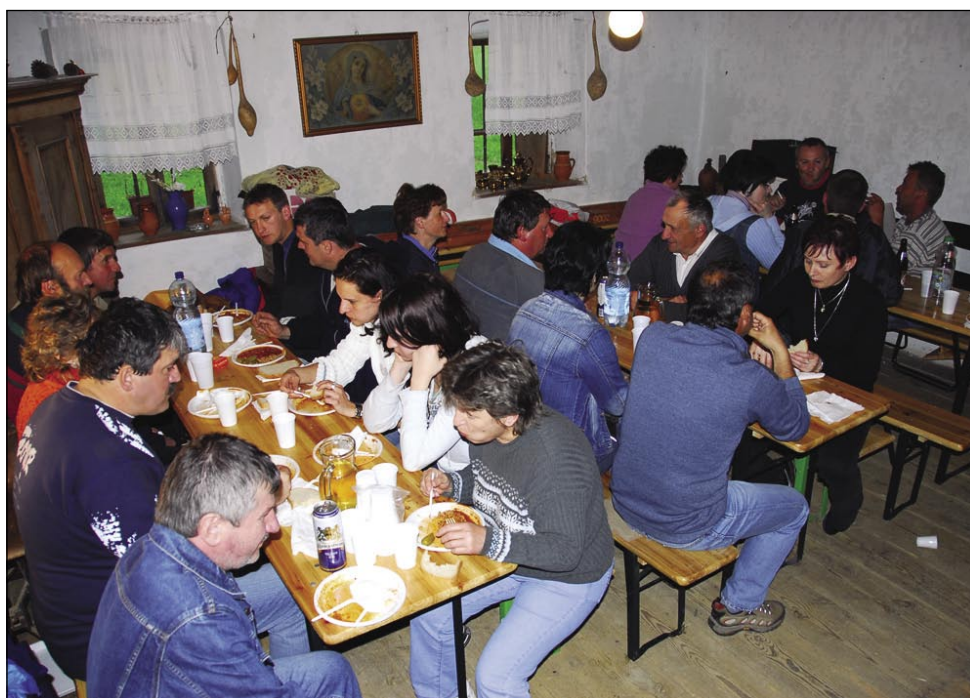
V velki sobi andovske domačije je bilau fajn toplo