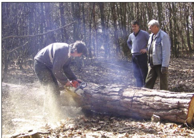
Drva za ogenj se pripravijo na velko soboto dopodneva

ognja taša vročina bila, ka nam je guntanje vse sūjo gratalo. Meli smo vino, pivo, palinko, likere pa radečo domanjno vino, ka je najbola šlau. Sūje ružanice so tak fejt gorele, ka je plamen več kak deset mejtrov visiki bijo pa tak je sveklau bilau, kak če bi vodne bilau. Tak za pau vōre je gnauk samo spraščalo pa so se ružanice vse rancobrnaule, ešče sreča, ka niške nej stau paulek. Že pau deset je bila vōra, gda so Būdinečari prišli, štere smo že komaj čakali. Nej samo zato, ka so naši padaši, liki zato tō, ka dočas smo mi tō nej mogli djesti. Gda smo z večerjov zgotauvili, te smo vcujstanili strejlati, prvin smo nej steli, nej ka bi se stoj zadavo, če bi se zbojo. Dapa od tauga se je nej trbelo bojati, zato ka telko smo se nikdar nej mantrali s strejlanjom kak zdaj. Nej je šlau za vraga nej, cejlo nauč če smo de-