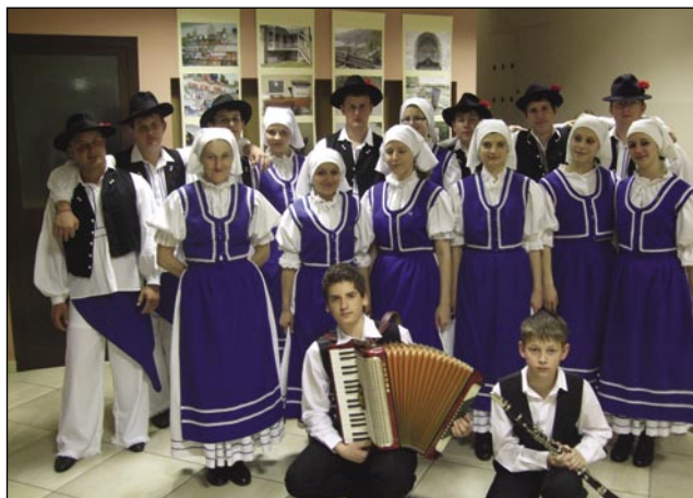
V gornjeseniški folklori pleše veliko mladih

mi plesi. Prireditve sta organizirala KPD Lipa in KS Šempas z naslovom Domovina je