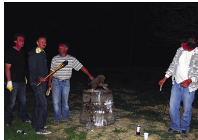
Letos nas je štūk nej sto baugati

Kak vsakšo leto zdaj smo se tō predpodnevom v desetoj