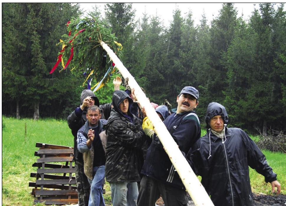
Andovski majpan se je postavlo v dežji

Letos so si v Andovcaj pa Būdincaj – kak vsigdar – nika nauvoga vōzmislili. Zato, ka dvej vesi, dvej družstvi že itak dobro sodelujeta, so tak brodili, ka si vōmenijo majpane, andovsko drejvo postavijo v Būdincaj, būdinski gelič pa v Andovcaj. »Tau smo se zgučali vküper, gda smo letos podpisali Listino o sodelovanju in prijateljstvu,« je pravo predsednik Porabskoga